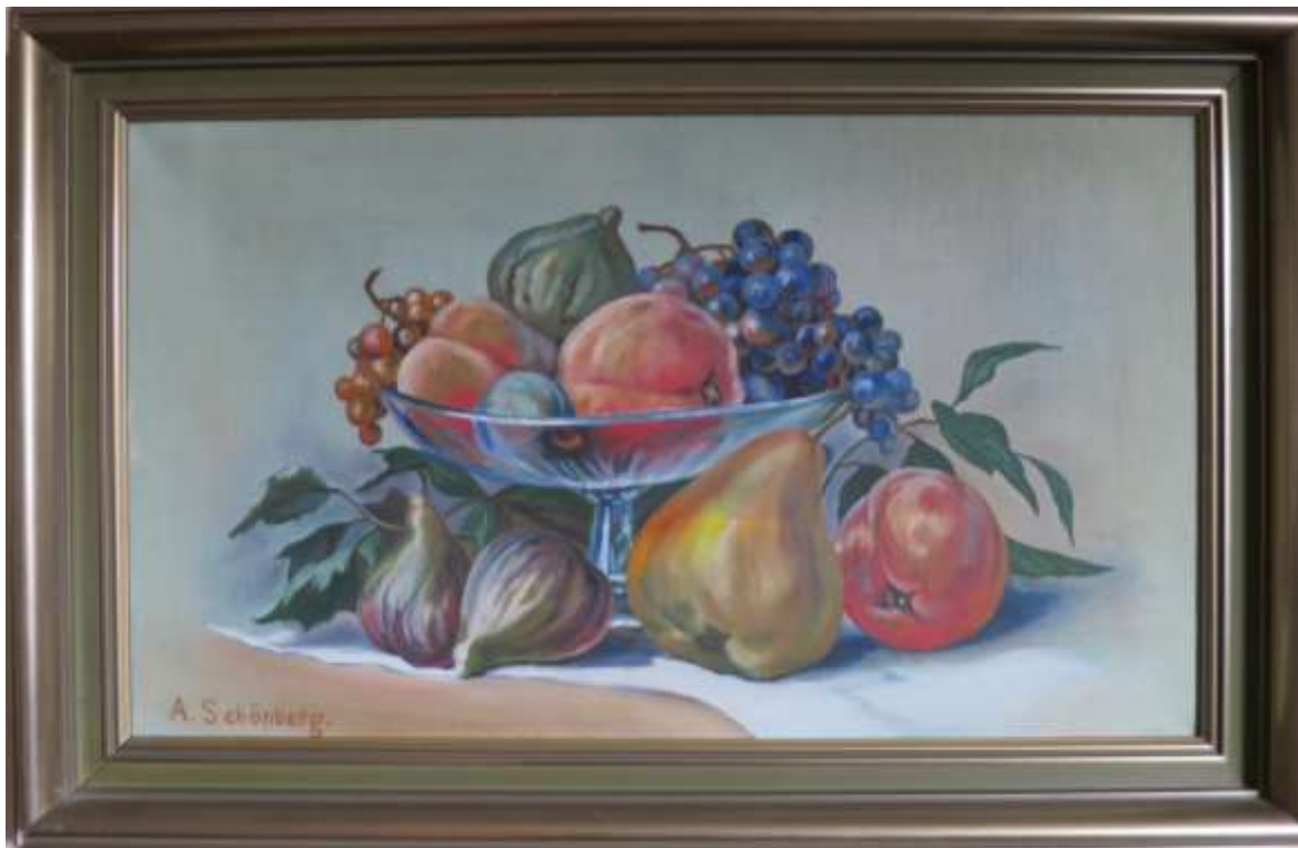
Alma Buckard, Fruktskål , olja 47 x 72 cm.