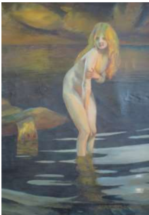
Alma Buckard, Kvinna i strandkanten , olja 64 x 49 cm.

Under denna period upptäckte hon både akvarell- och oljemåleriet. Hon fann stor glädje i detta och det märktes snart att hon hade talang. I början av 30-talet antogs hon som elev vid Kungliga Konstakademien /Kungliga Konsthögskolan i Stockholm. Hur ansökningsförfarandet gick till vet vi inte men tavlan som spelade den kanske viktigaste rollen bland hennes arbetsprover var Kvinna i strandkanten .