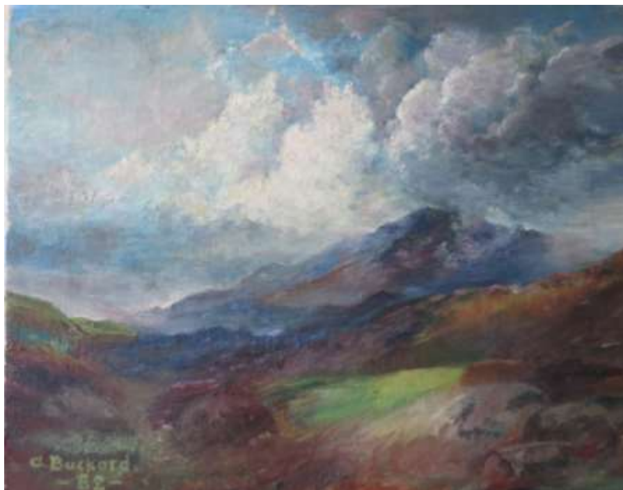
Alma Buckard, Berglandskap , olja 27 x 36 cm.