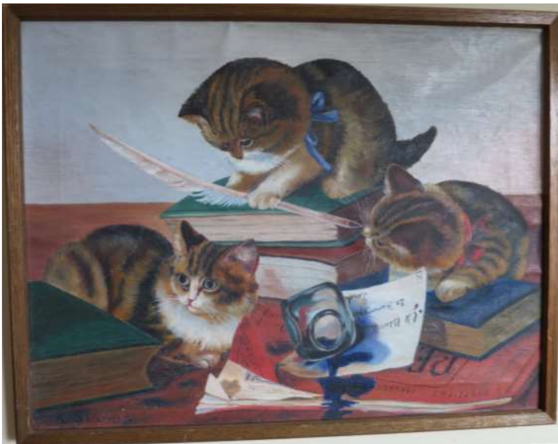
Alma Buckard, Kattungar , olja 46 x 59 cm.