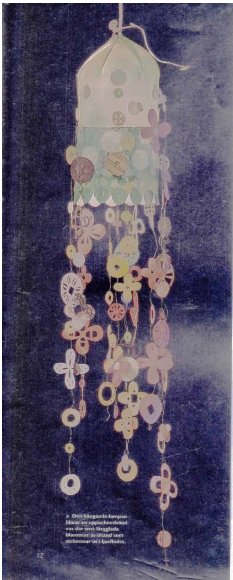
▲ Den hängande lampan liknar en uppochnedvänd vas där små färgglada blommor av olika sort strömmar ut i ljusflödet.

egentligen känner mig rätt klumpig. Jag är uppväxt med en hoper-mostrar som slöjdade. De var bondkvinnor, för dem var det en lyx när de kunde och hann slöjda. De vävde och gjorde korgar av rot. När det var bråttom och de skulle leverera till Hemslöjden, speciellt till jul då de gjorde julstjärnor av säv, då fick jag hjälpa till.