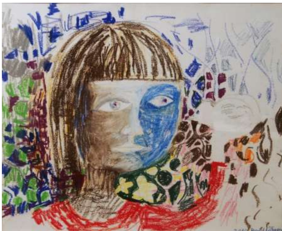
Bodil Löfgren, Flicka med fågel , oljepastell 2010, 45 x 56 cm,

STENHUSET SURAHAMMARS KONST OCH HANTVERKSGILLE Vi visar gärna utställningen på andra tider