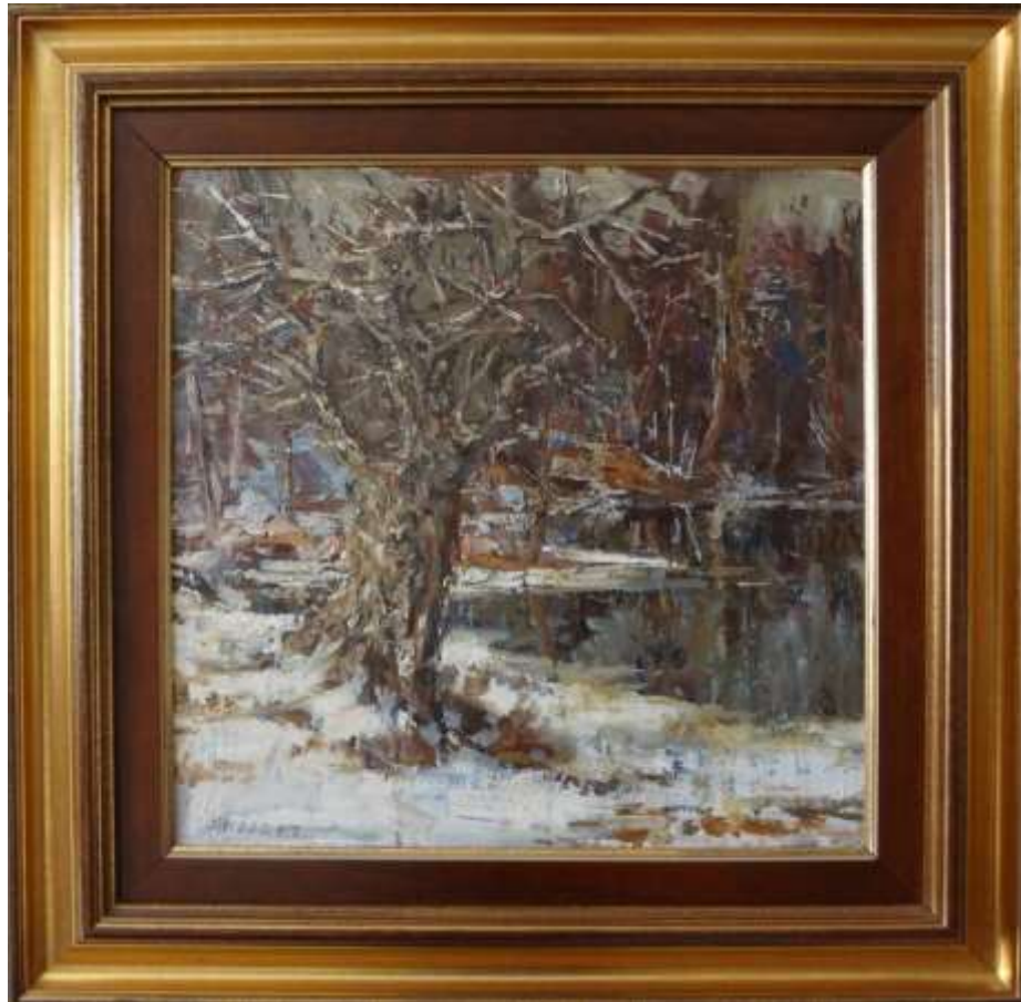
John Sköld, oljemålning på pannå 1957, 39 x 39 cm.