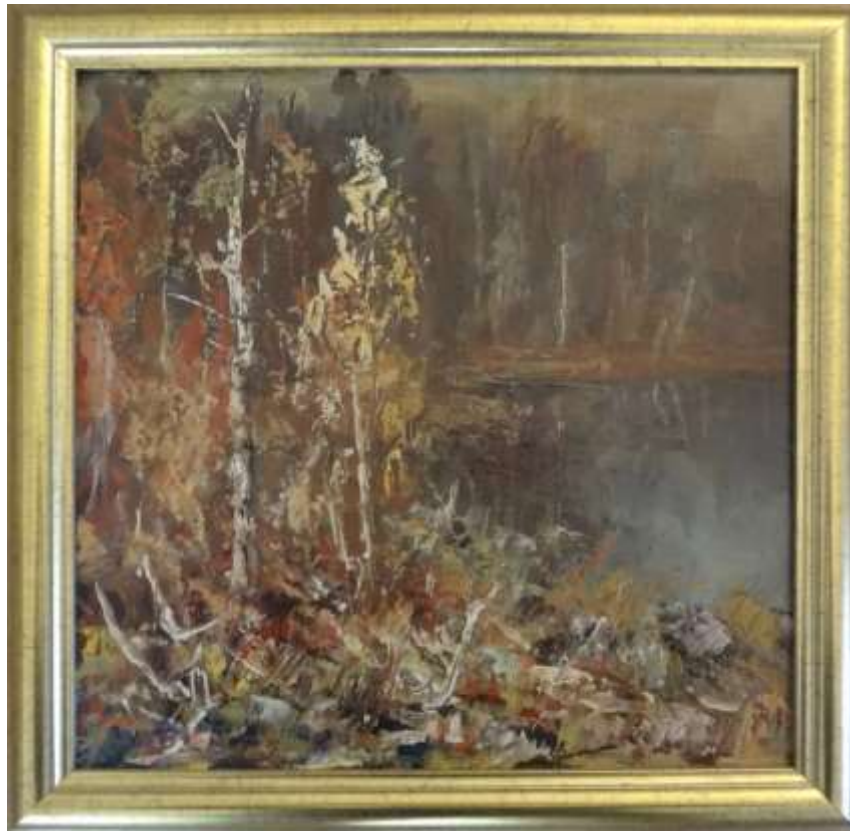
John Sköld, oljemålning på pannå ca 1955, 30 x 30 cm.