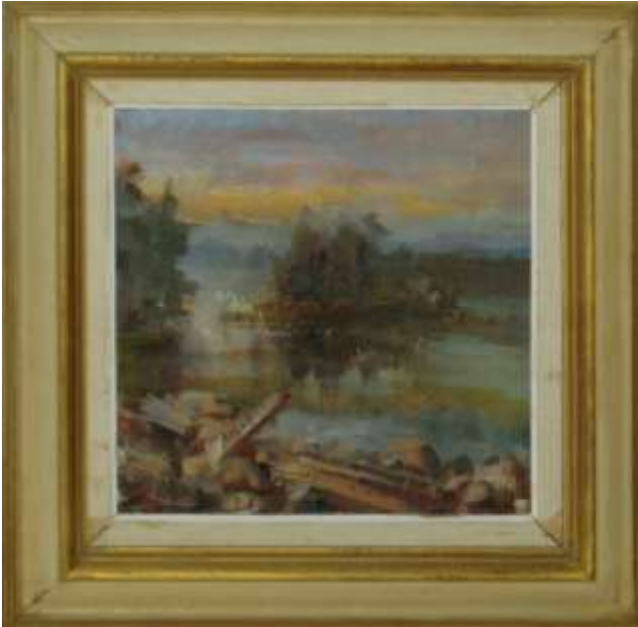
Sten Blomgren: Tavlan visar utsikten mot Silkesholmen i skymningen, målad av John Sköld 1957. I vänsterkanten på tavlan ser man Mattön – en ganska stor ö med missionshus och kanske ett 50-tal hus.