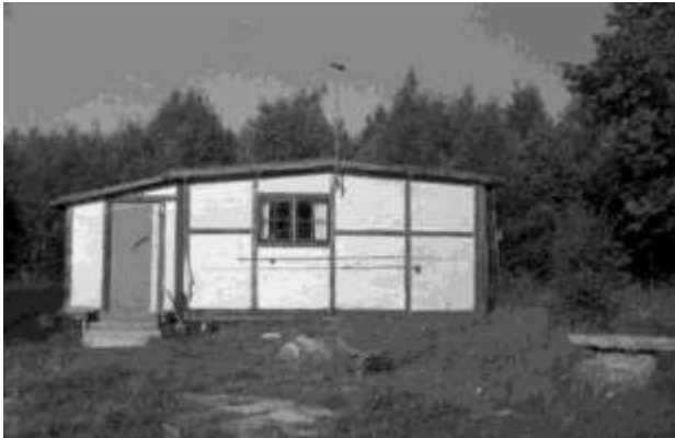
John Skölds första stuga i närheten av järnvägsbron.