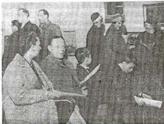
Den talrika konstpubliken funderar och diskuterar.