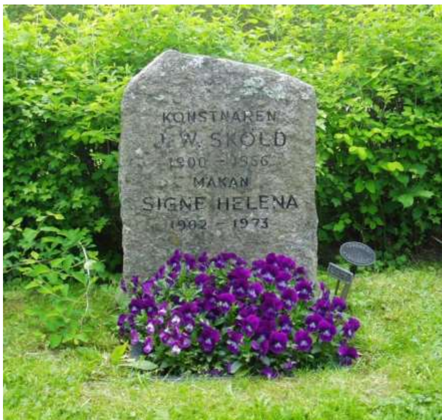
Nya kyrkogården i Sala