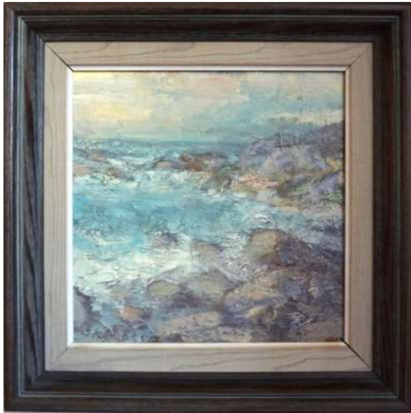
John Sköld, oljemålning på pannå 1955, 23 x 23 cm.