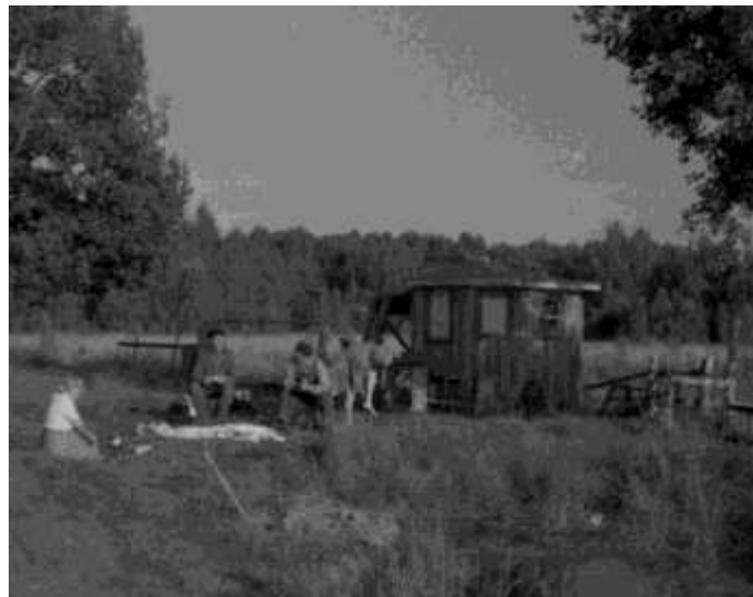
Ateljébyggnaden några tiotal meter från stugan.