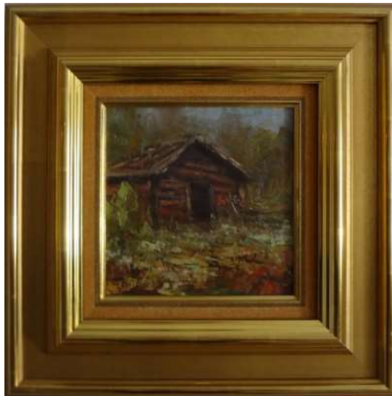
John Sköld, oljemålning på pannå 1958, 19 x 19 cm.