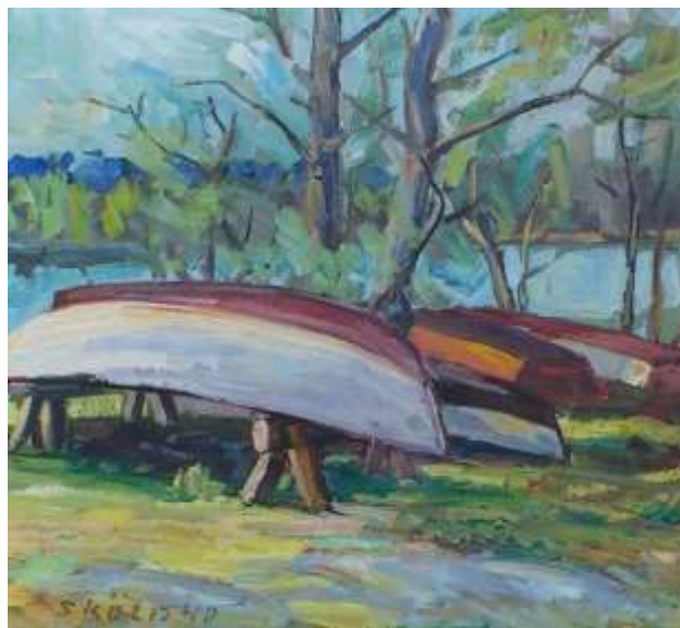
John Sköld, oljemålning på pannå 1940, 29 x 31 cm.