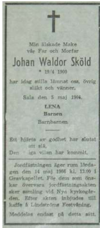
Sala Allehanda den 6 maj 1966.