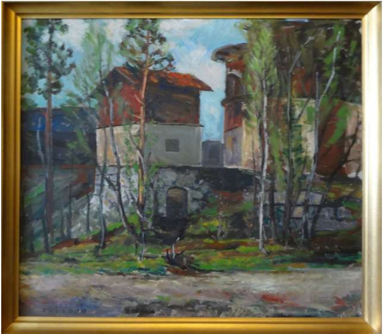
John Sköld, oljemålning på pannå 1940, 52 x 60 cm.