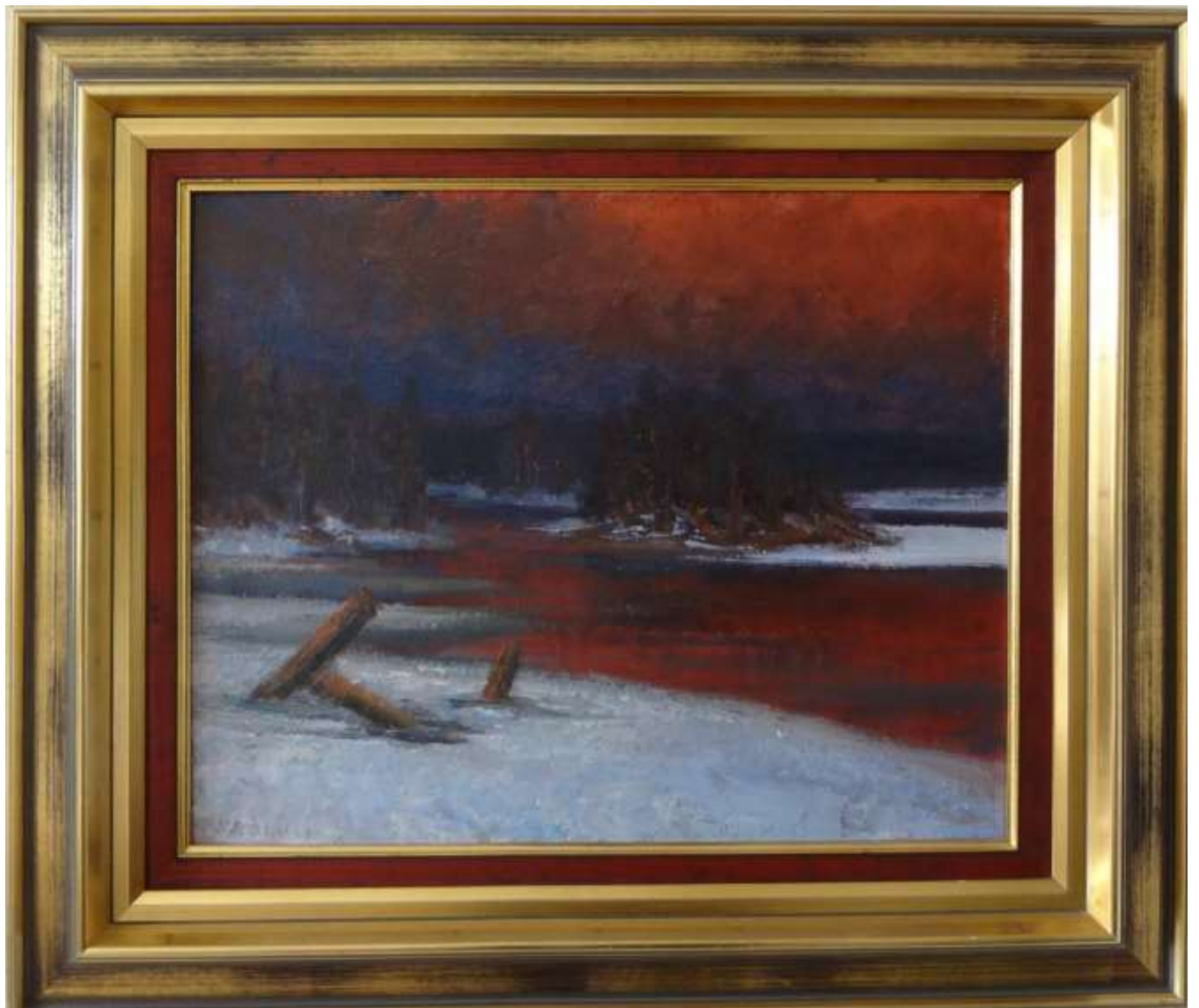
John Sköld, oljemålning på pannå 1958, 36 x 45 cm.