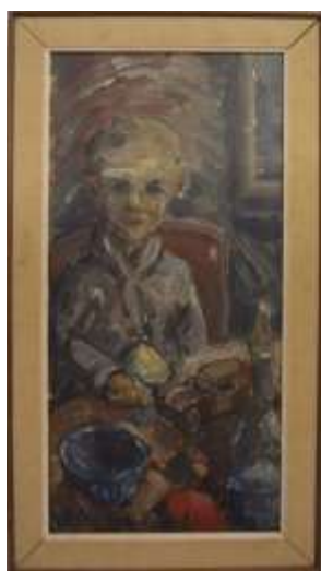
Nils Grahamstad, oljemålning på duk, 55 x 27 cm.

Den färdiga väggmålningen var stor – jag tror ungefär 4 x 6 meter. Huset är tyvärr numera rivet.