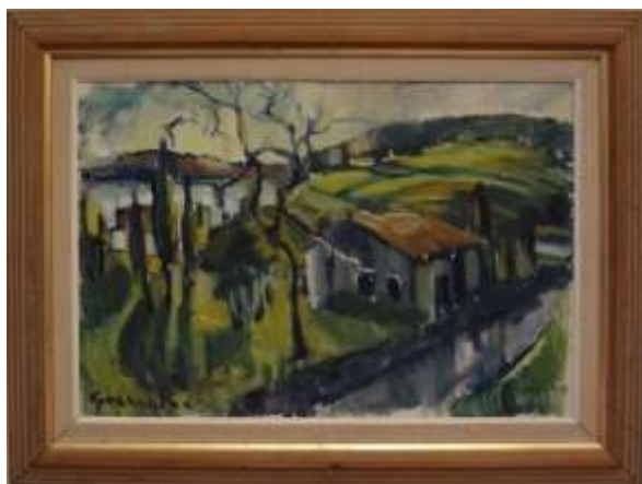
Nils Grahamstad, oljemålning på duk, 46 x 66 cm.