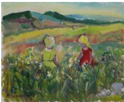
Nils Grahamstad Severin, oljemålning på duk, 39 x 49 cm. Garpenhus Konst & Auktion AB.

Det här är ett motiv, 'lekande barn', som återkommer på många av hans målningar.