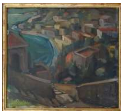
Nils Grahamstad, oljemålning på duk, 34 x 38 cm.