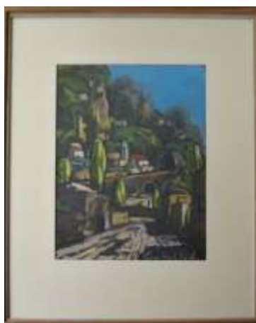
Nils Grahmstad, pastell, 27 x 22 cm.