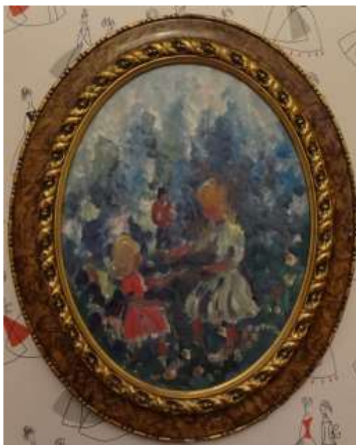
Nils Grahamstad, oljemålning på pannå, 40 x 30 cm.

Den här har han målat till min svärfar. Den här är målad på en ädelträpannå. Han gillade att måla över befintliga tavlor. Köpte tavlor och målade över dom!