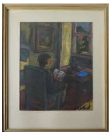
Nils Grahamstad, pastell, 27 x 22 cm.