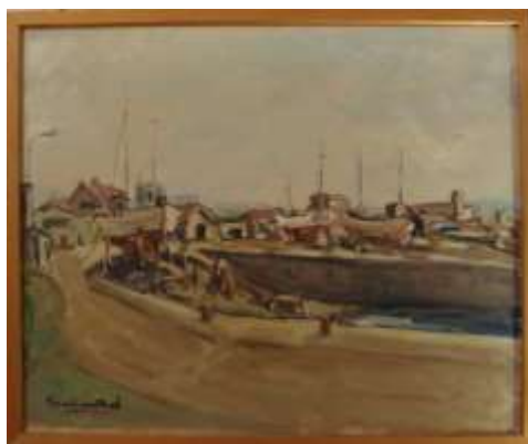
Nils Grahamstad, Bornholm , oljemålning på duk, 50 x 61 cm.

Jag har inte velat ha den framme för jag tycker den är så dystert. Ängestfylld. Men jag kanske kan försöka vänja mig nu.