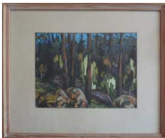
Nils Grahamstad, pastell, 22 x 26 cm.

Den här är väldigt ovanlig och troligtvis ganska tidig. Jag har inte sett någon sådan pastell tidigare.