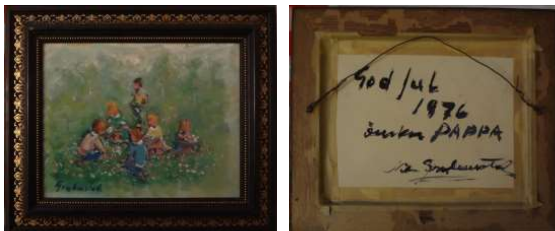
Nils Grahamstad, oljemålning på pannå, 20 x 25 cm.

Här återkommer motivet med de lekande barnen. På den högra ser man i bakgrunden hur Göteborgs höghus växer upp.