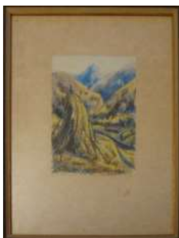
Nils Grahmstad, Gramstad, Norge , pastell, 24 x 16 cm.

Det här kan vara från Norge. Han tyckte mycket om Norge och namnet Grahmstad kommer från orten Gramstad, strax utanför Stavanger.