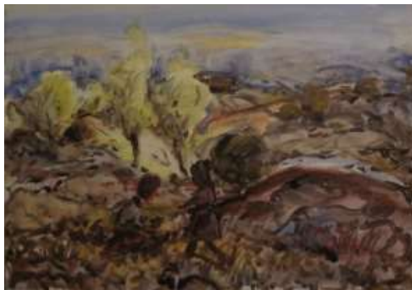
Nils Grahamstad, oljemålning på duk, 48 x 65 cm.

Det här är en skiss. Så här började han målningen. Det tog bara några minuter. Det skulle gå fort – tjoff, tjoff, tjoff. Han tyckte det blev bäst så. Spontan.