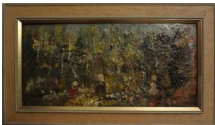
Nils Grahamstad, oljemålning på pannå, 29 x 58 cm.

Tavlan kunde sedan vara klar på en halvtimme, timme!