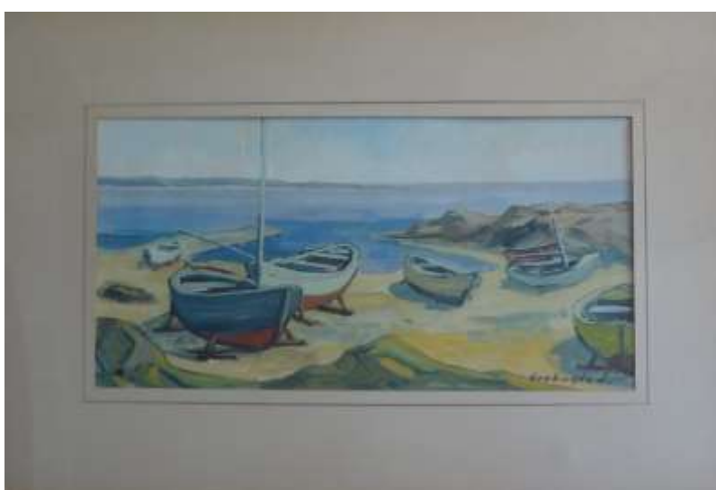
Nils Grahamstad, gouache, 25 x 51 cm.

Det här är ett motiv, 'lekande barn', som återkommer på många av hans målningar.