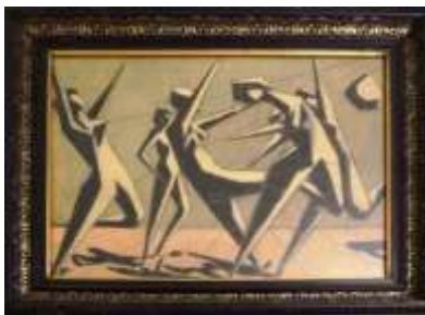
Nils Grahamstad, blandteknik 1957, 29 x 38 cm.

Skiss till en offentlig utsmyckning. Texten på baksidan lyder: Skiss till dekoration av trapphus i Högsbo, 1957. Nils Grahamstad.