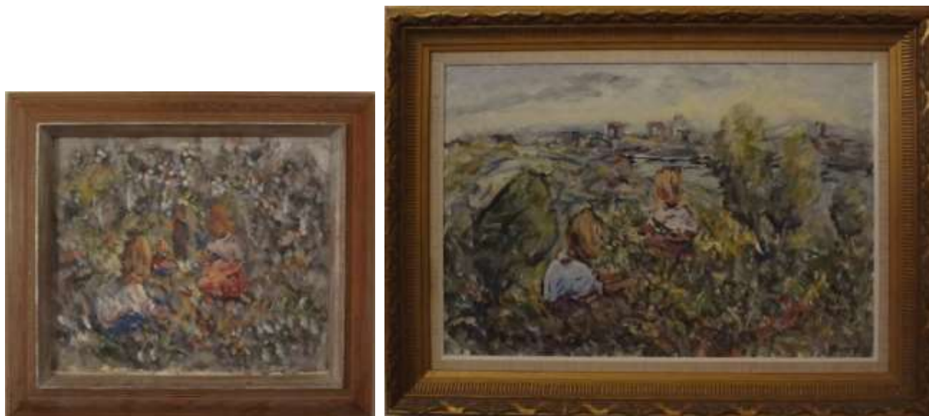
Nils Grahamstad, oljemålningar på duk, 38 x 46 cm resp. 45 x 65 cm

Här återkommer motivet med de lekande barnen. På den högra ser man i bakgrunden hur Göteborgs höghus växer upp.