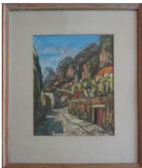
Nils Grahamstad, pastell, 26 x 22 cm.

Den här är väldigt ovanlig och troligtvis ganska tidig. Jag har inte sett någon sådan pastell tidigare.