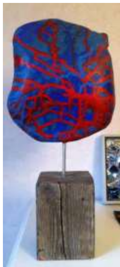
Olle Ring Skulptur, h 40 cm