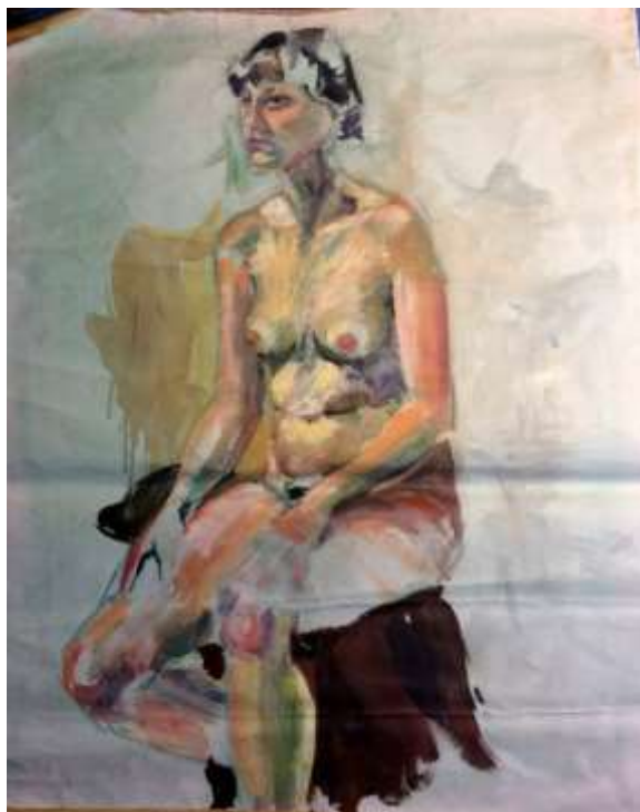
Olle Ring, Modellstudie Oljemålning på duk, 82 x 65 cm