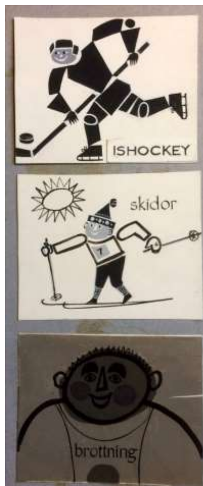
Olle Ring Förslag till TV-vinjetter, Konstfack