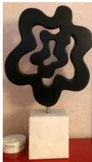
Olle Ring Skulptur, h 40 cm