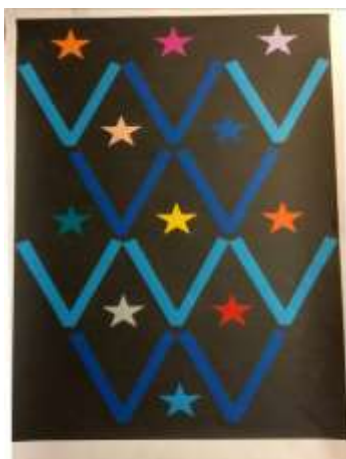
Olle Ring Elevarbete, Konstfack