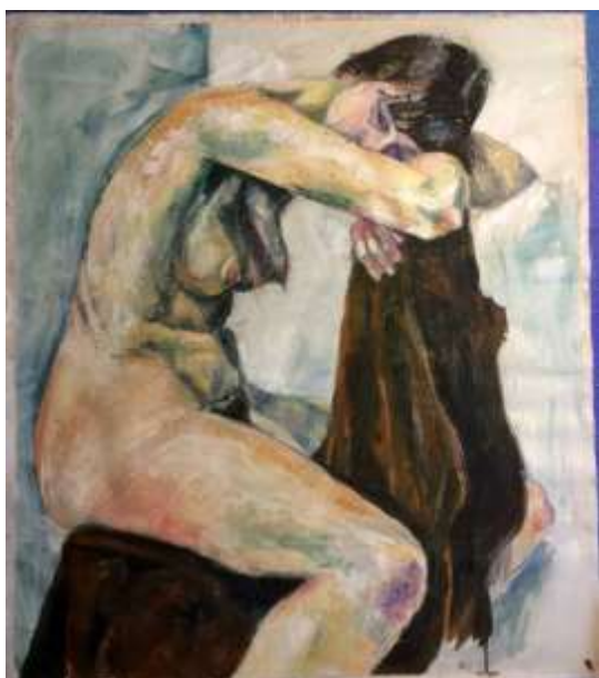
Olle Ring, Modellstudie Oljemålning, 69 x 60 cm