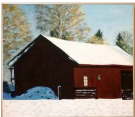
Olle Ring, Lada Oljemålning på duk, 40 x 48 cm