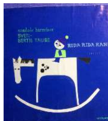
Olle Ring Skivomslag, Konstfack