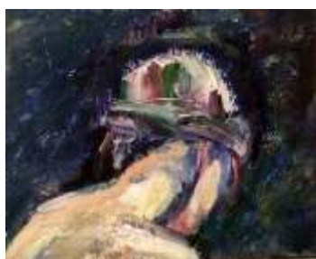
Olle Ring, Studiehuvud Oljemålning på duk, 25 x 28 cm