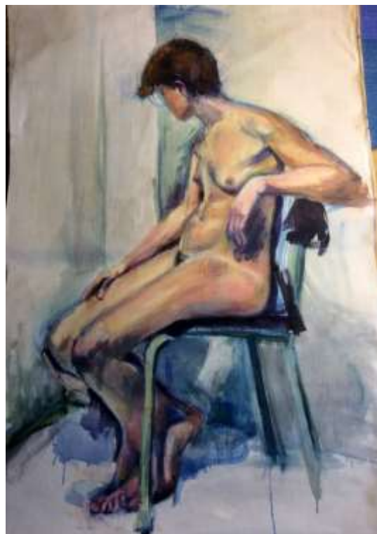
Olle Ring, Modellstudie Oljemålning, 104 x 64 cm