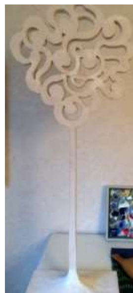
Olle Ring Skulptur, h 50 cm