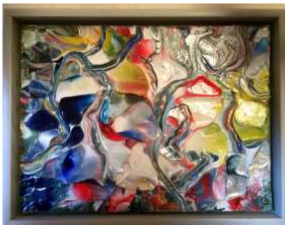
Olle Ring Oljemålning, 20 x 25 cm