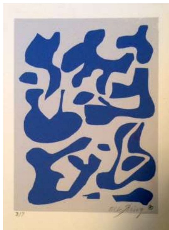
Olle Ring Tryck, 80 x 60 cm