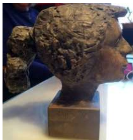
Olle Ring Skulptur, h 15 cm