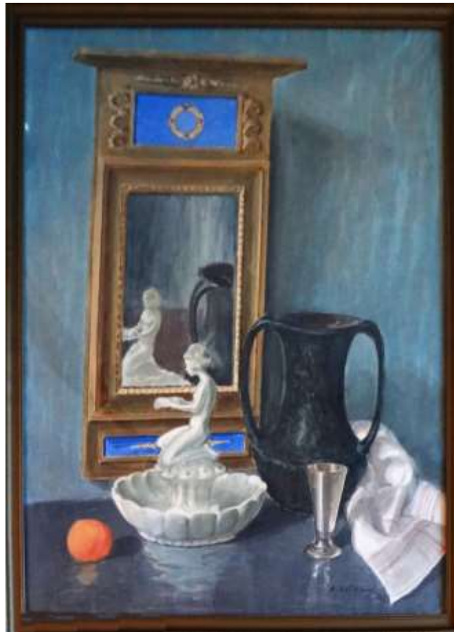
Sven Östbom, akvarell/gouache 1933, 57 x 44 cm.