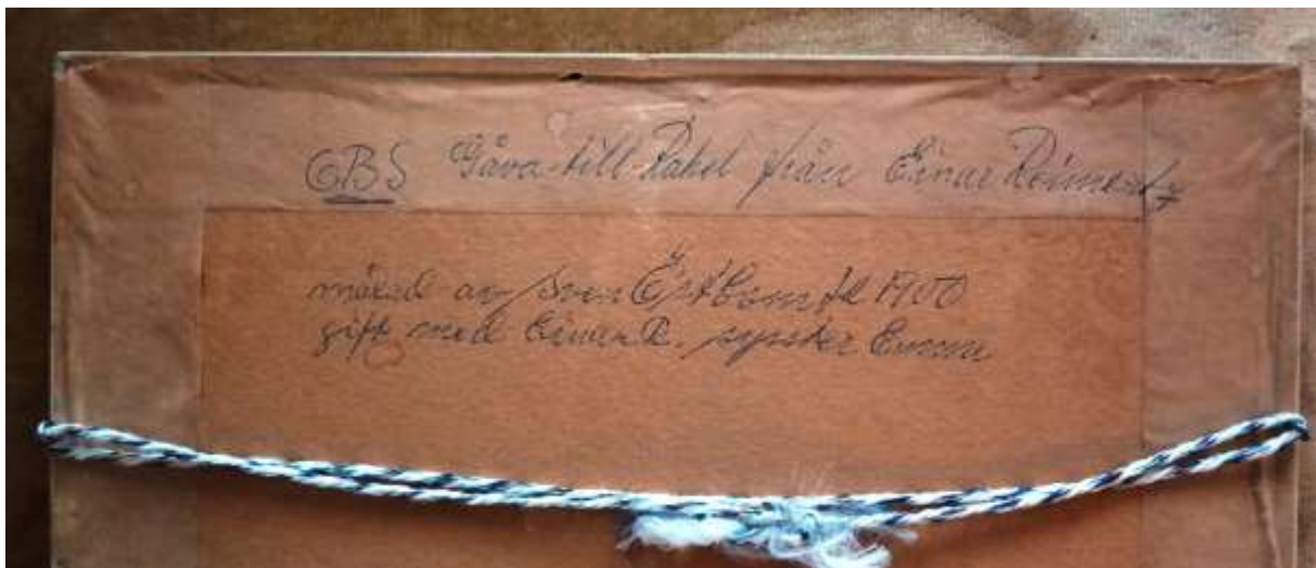
Sven Östbom, gouache 1926, 22 x 30 cm.