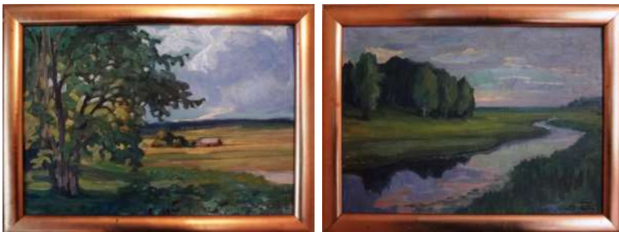
Sven Östbom, oljemålningar på duk/papp, 29 x 41 cm. Gåva till Avlidna Salakonstnärers Sällskap.

Ur boken Broddbobygden med omgivning från 1944 av Oskar Brodén