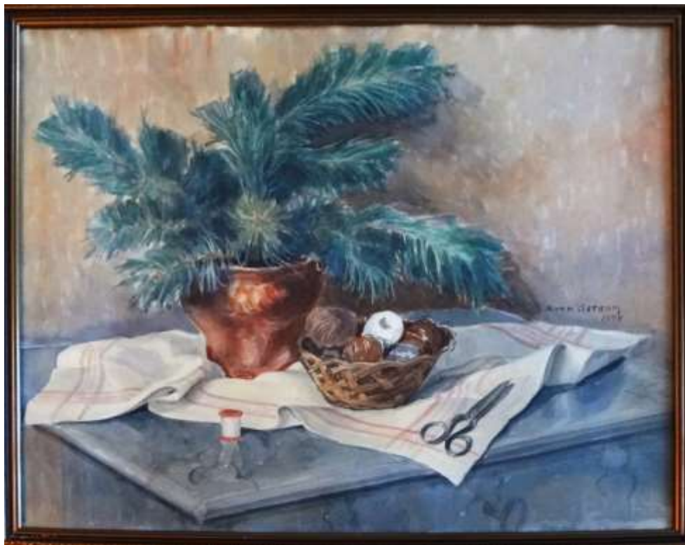
Sven Östbom, akvarell/gouache 1934, 43 x 52 cm.