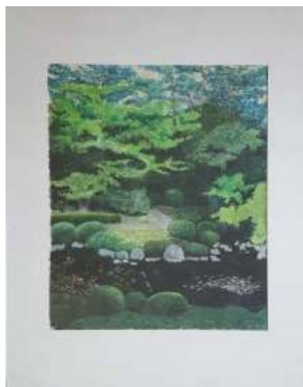
Lennart Dahlström Nedanför Hallmans Konditori akvarell, 40 x 32 cm