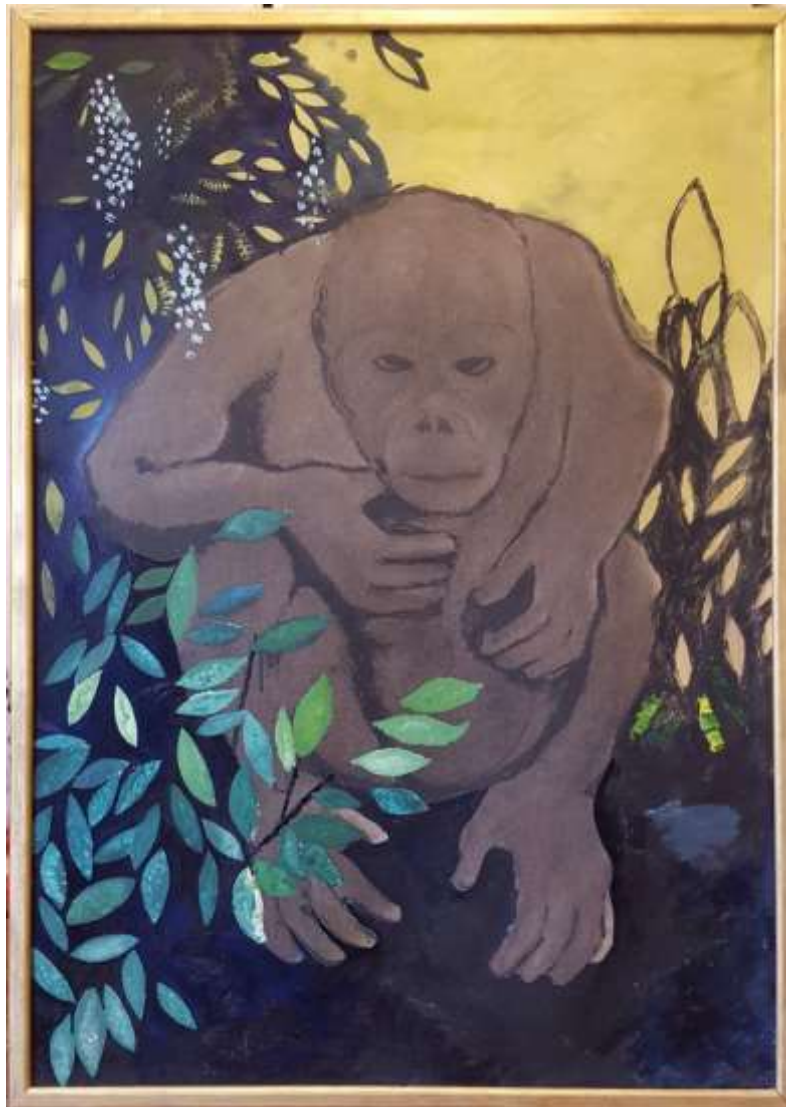
Lennart Dahlström Gorilla målning på papp, 100 x 70 cm