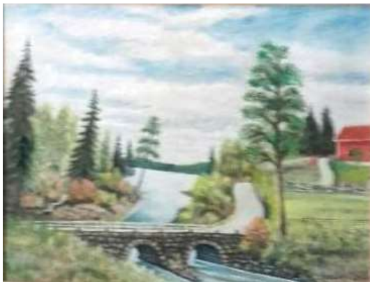
Sixten Folke, Stenbro , olja 41 x 49 cm