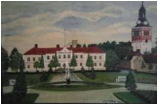
Sixten Folke, olja 1931, 41 x 61 cm