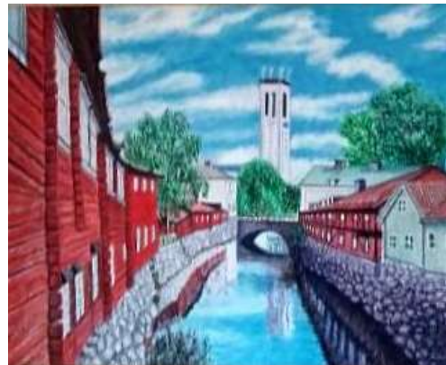
Sixten Folke, Svartån, Västerås , olja 40 x 48 cm