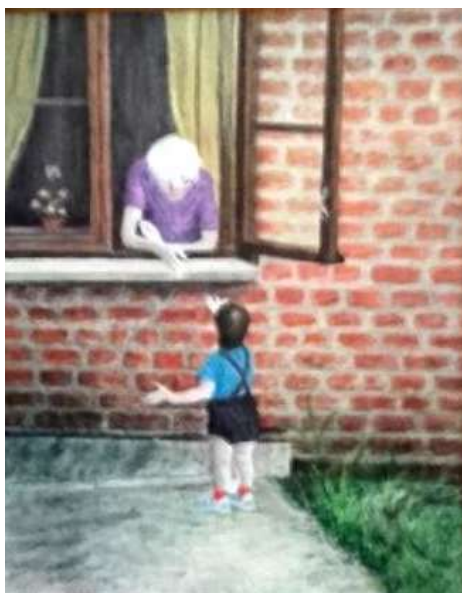
Sixten Folke, Barn vid fönster , olja 48 x 40 cm