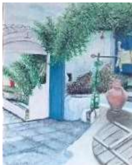
Sixten Folke, Torgidyll , olja 48 x 40 cm