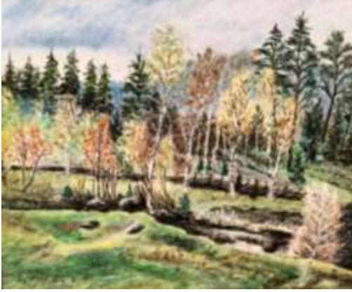
Sixten Folke, Skogsidyll , olja