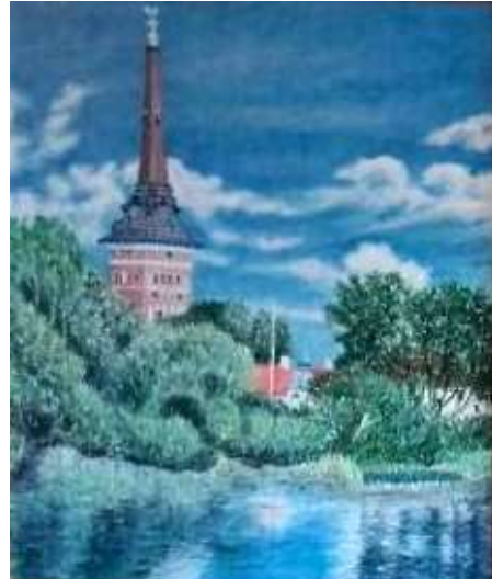
Sixten Folke, Kristina Kyrka , olja 61 x 52 cm