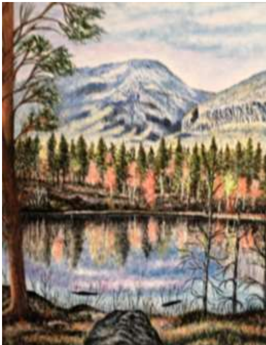
Sixten Folke, Tjörn i skog , olja