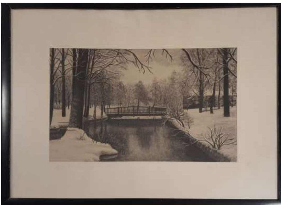
Arvid Andersson, Motiv från Brunnsparken, Sala , teckning 27 x 42 cm.