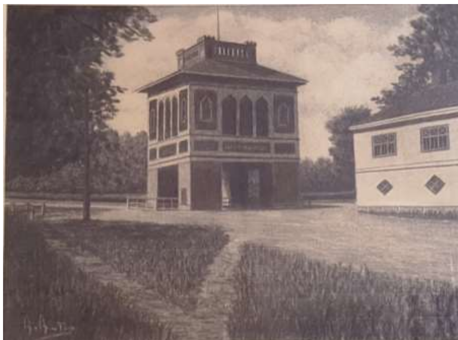
Arvid Andersson, teckning 27 x 36 cm. Tillhör Avlidna Salakonstnärers Sällskap.