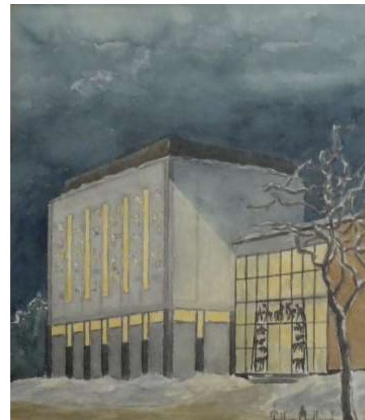
Folke Östlund, Sala tingsrätt , akvarell 1959, 21 x 18 cm