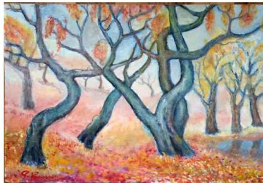
Gustav Larsson, olja 30 x 42 cm