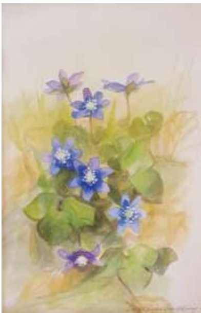
Inga-Lisa Stadling akvarell 1988, 25 x 17 cm