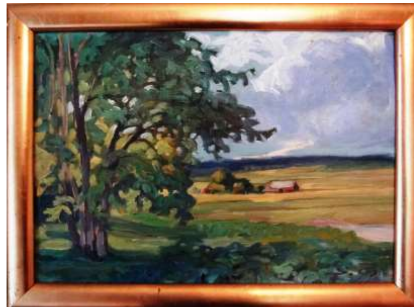
Sven Östbom, olja 29 x 41 cm