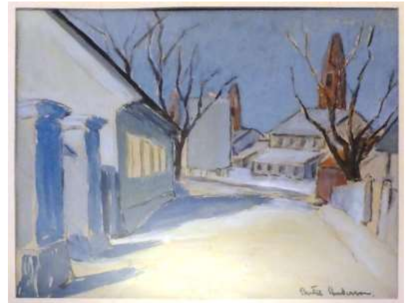
Bertil Andersson, Väsby Kungsgård och Srå kalkbruk , gouache 19 x 22 cm