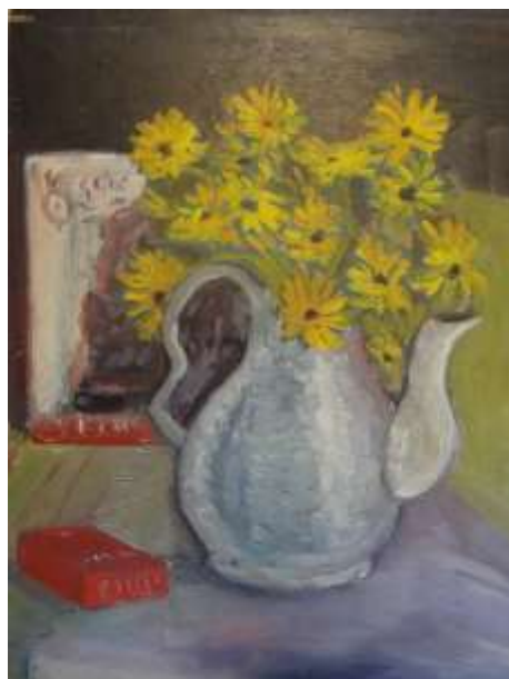
Gösta Södergren, olja 37 x 28 cm