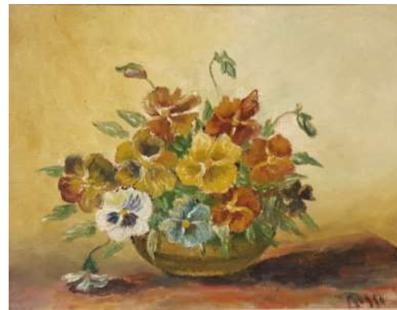
Ragnar Andersson 'Eklunda-Ragge', olja, 30 x 40 cm