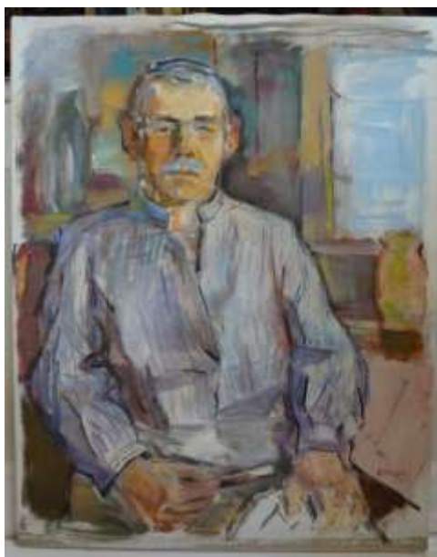
Gustaf Thorsell, Självporträtt , olja 1987, 70 x 55 cm