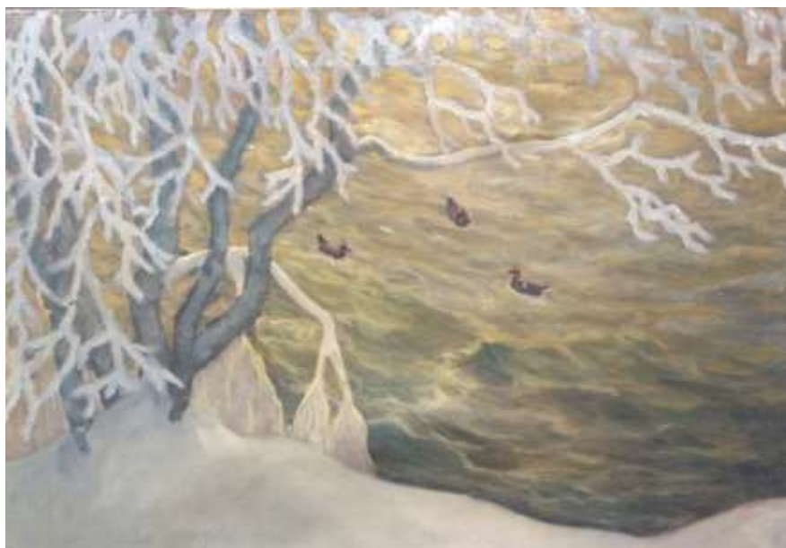
Jon Loman, Sjöfågel vid stranden , 102 x 66 cm