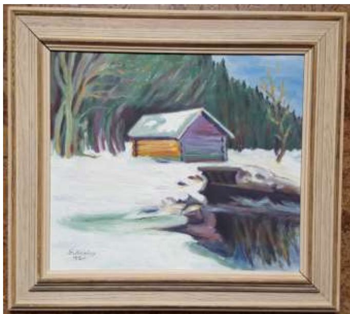
Gustaf Hedling, olja 33 x 38 cm