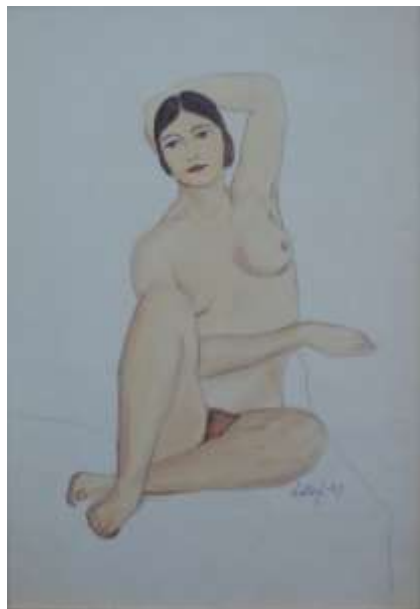
Edward Jangö, teckning-akvarell 1929, 30 x 21 cm