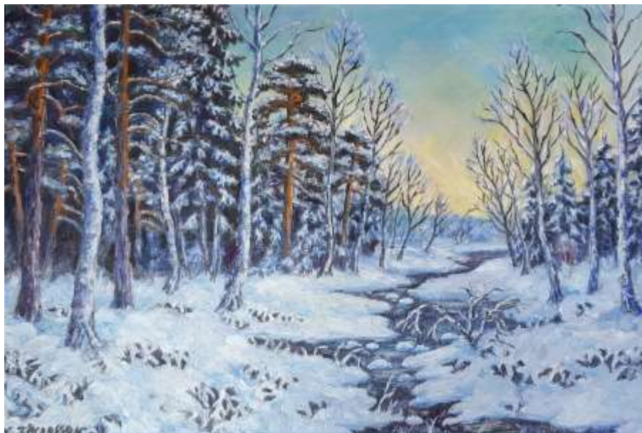
Nils Jacobsson, olja 31 x 46 cm