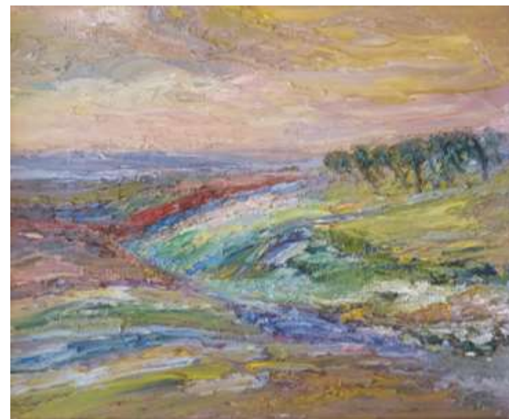
Ture Holm, olja 31 x 38 cm