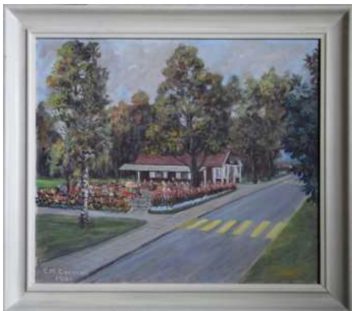
CM Larsson, Parkstugan , olja 1961, 46 x 53 cm