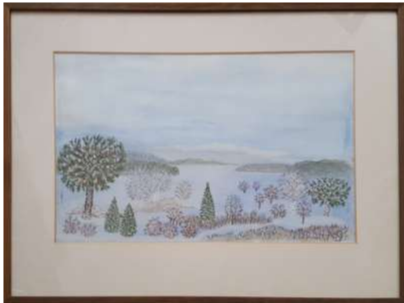
Gerdi Kullberg, gouache 1980, 30 x 45 cm