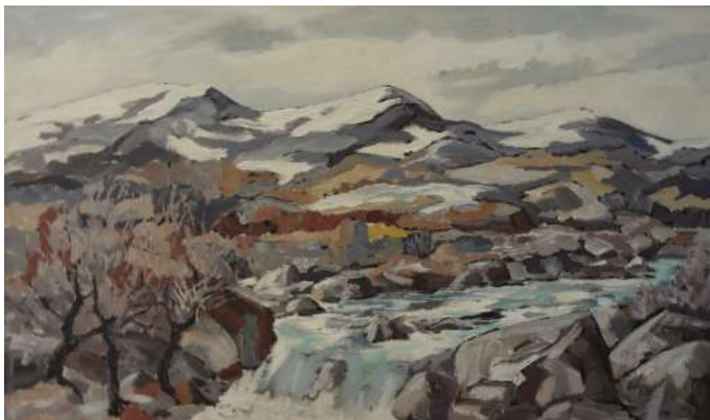
Sixten Engberg, olja 60 x 102 cm