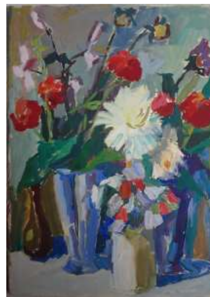
Martin Eder, gouache 35 x 25 cm