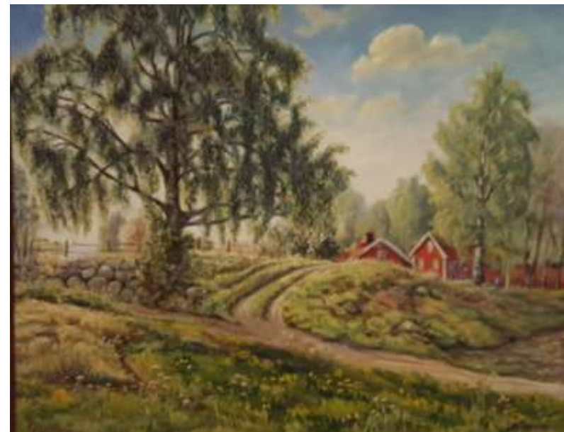
Ivar Nyström, Klasbo , olja 1947, 49 x 62 cm