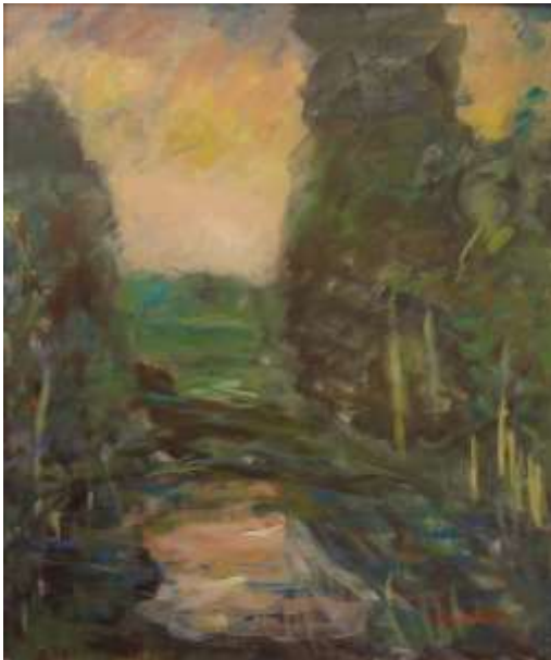
Åge Lindbeck, Efter regnet , olja 1994, 60 x 50 cm