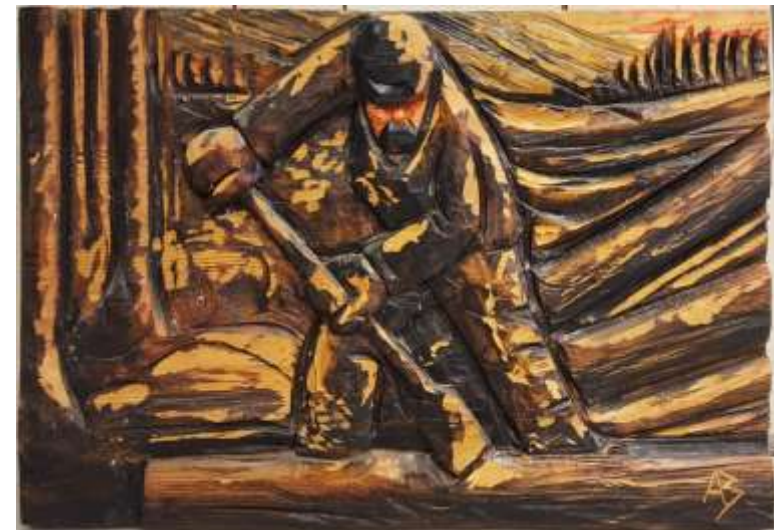
Assar Blidmo, trärelief, ca 50 x 70 x 7 cm