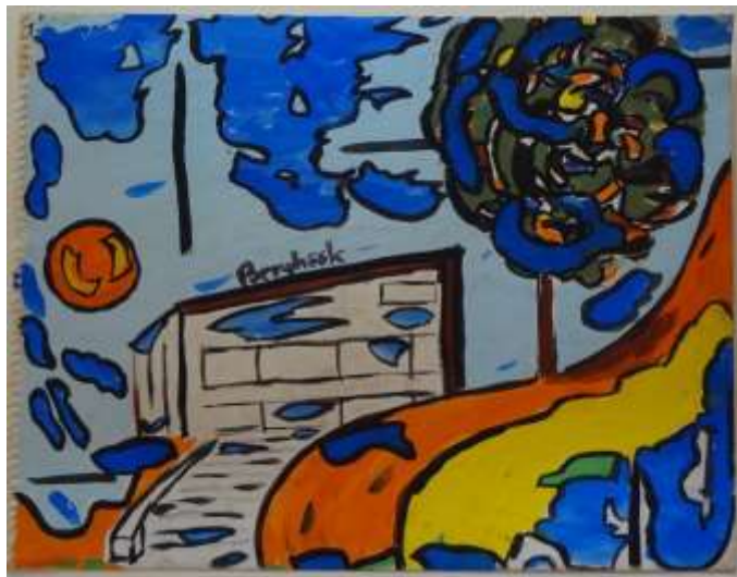
Arne Berghöök, gouache 27 x 34 cm