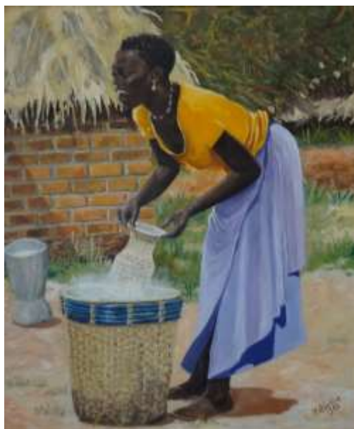
Per F Bjurling, Maria , olja 1963, 55 x 46 cm