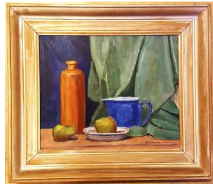
Greta Ringström, olja 1947, 31 x 38 cm