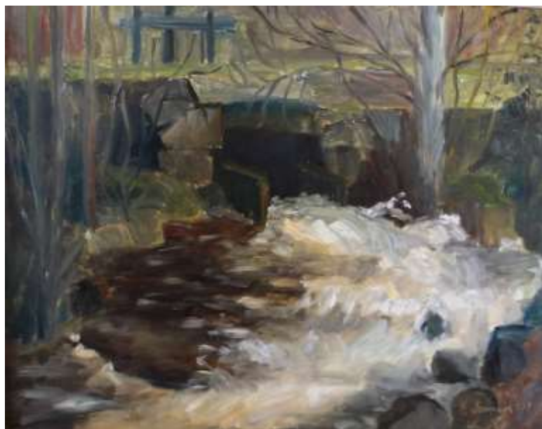
Ebba Loman, Bro och fors , olja 1954, 33 x 41 cm