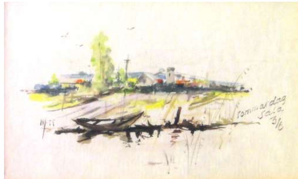
Nisse 'Ritarn' Jonsson akvarell 1955, 8 x 13 cm