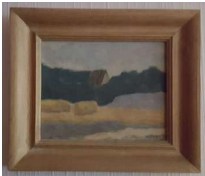
Henry Johag, Visby , olja 20 x 24 cm