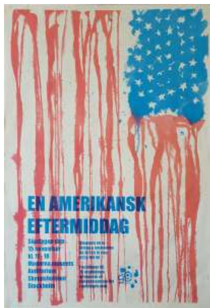
Olle Nessel, affisch 64 x 44 cm