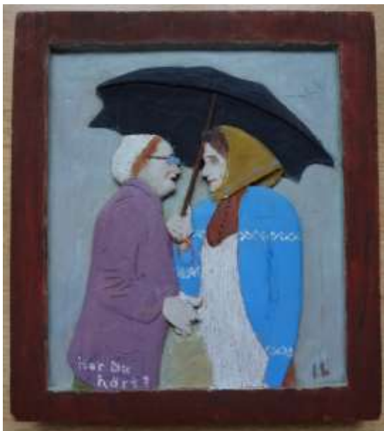
Ivan Lantz, Har du hört , träsnideri 22 x 20 cm