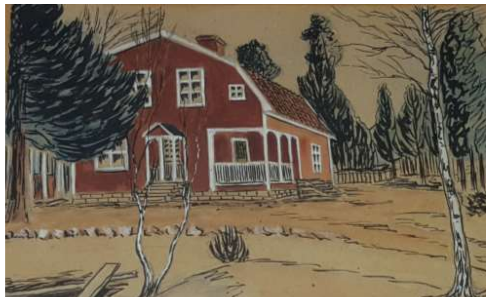
E Thelin, Hagalid, Gravhagen , akvarell-tusch 16 x 24 cm