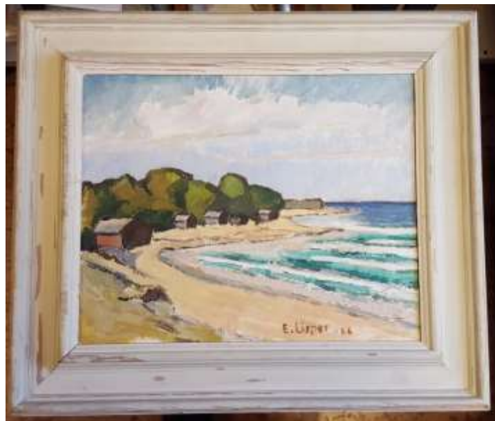
Erik Lisper, Ekeviken Fårö , olja 33 x 41 cm