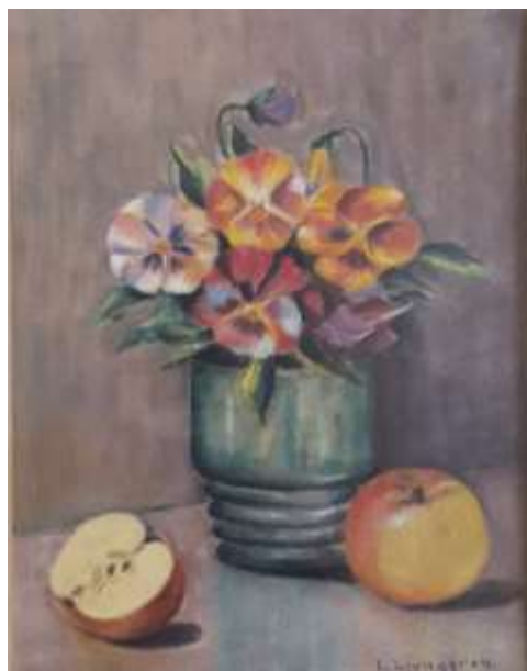
Lars Ljunggren, pastell 31 x 24 cm