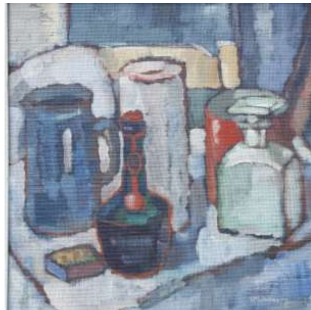
Lennart H Lindberg, olja 47 x 47 cm