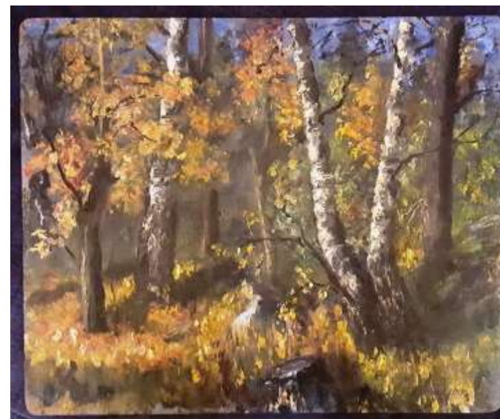
I Ebeling, olja 38 x 46 cm