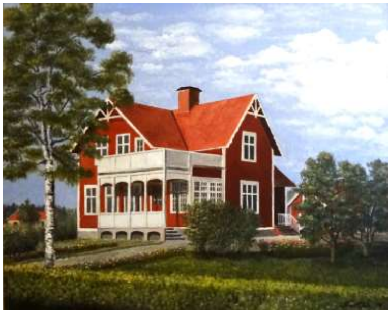
Knut Ohlsson, Poppelgatan , olja 1978, 50 x 60 cm