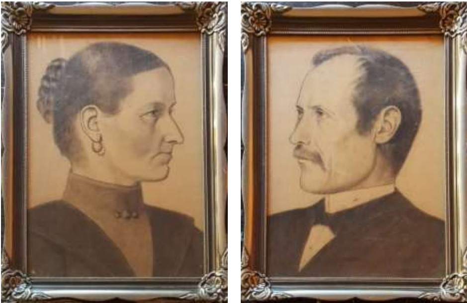
Axel Kilander, teckningar, vardera 39 x 29 cm