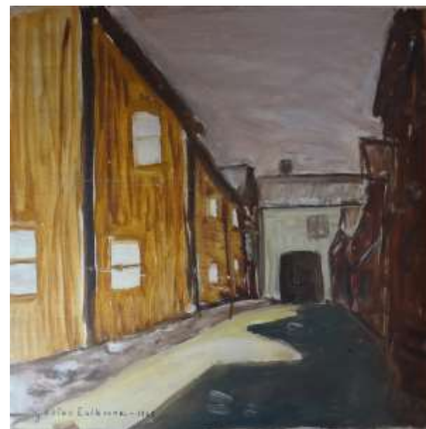
Gustav Eriksson, olja 1968, 45 x 45 cm