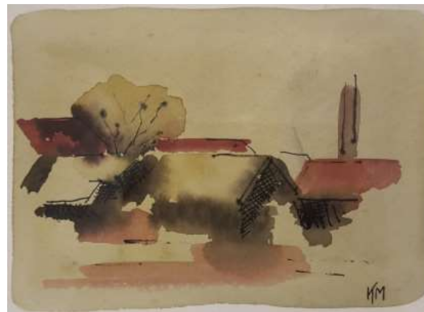
Karl-Otto Modin, Nordins smedja , akvarell 15 x 21 cm