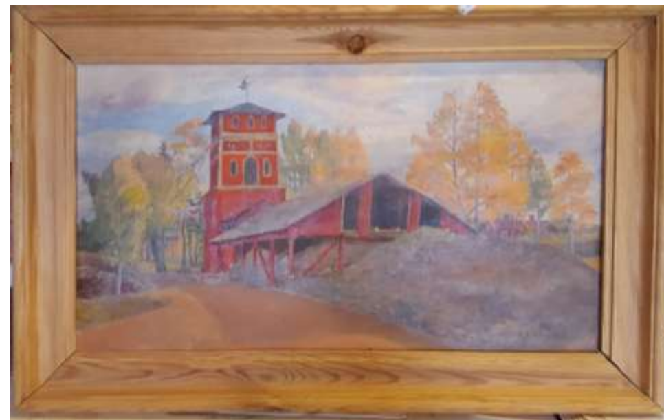
Edvard Cederling, Knechtschaktet , olja 38 x 68 cm