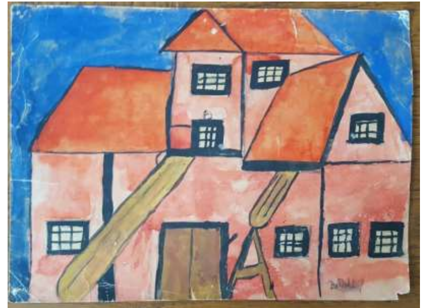
Bob Asklöf, Ekeby kvarn , akvarell omkr. 1956, 21 x 29 cm