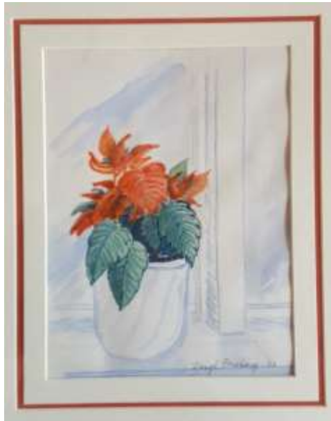
Bengt Forsberg, akvarell 1993, 23 x 17 cm