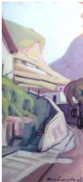
Nils Grahmstad, gouache 46 x 20 cm