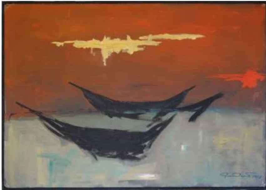
Georg Camitz, olja 1967, 70 x 100 cm