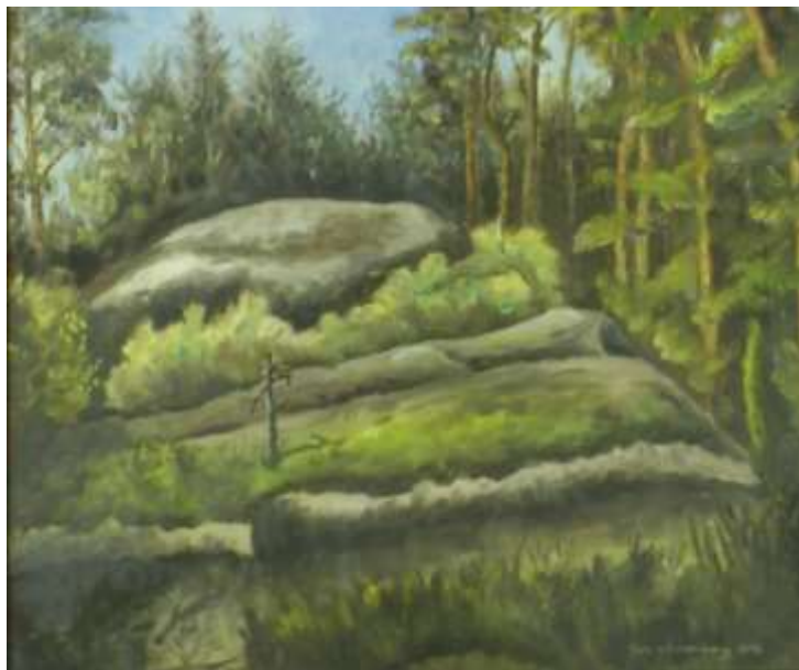
Rune Wennerberg, olja 1978, 36 x 42 cm