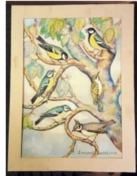
Gerhard Ewert, Talgoxe, Blåmes, Trädkrypare, Tovsmes , akvarell 1975, 34 x 24 cm