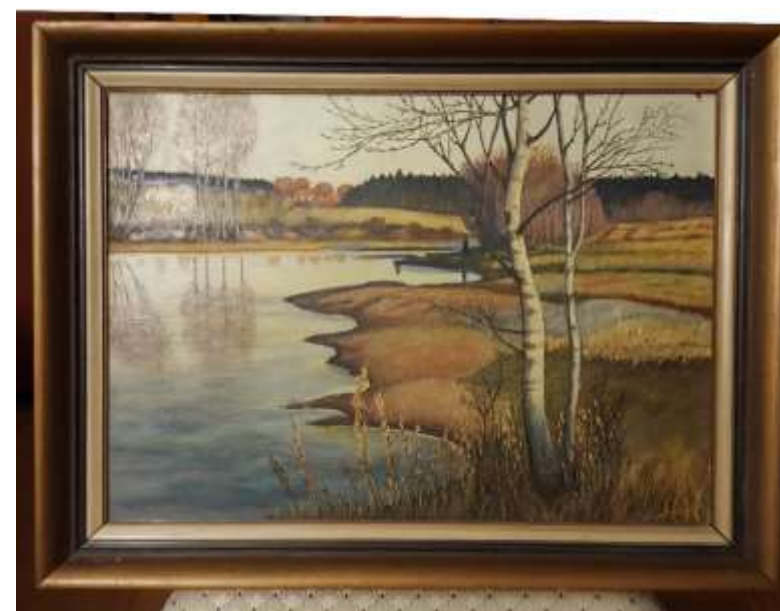
Hilda Holm, olja 37 x 51 cm