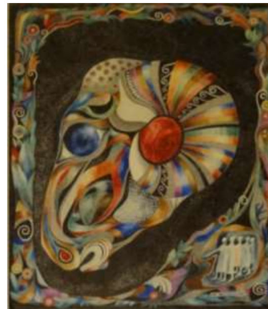
Eva Hellbom, tusch-akvarell, 51 x 42 cm