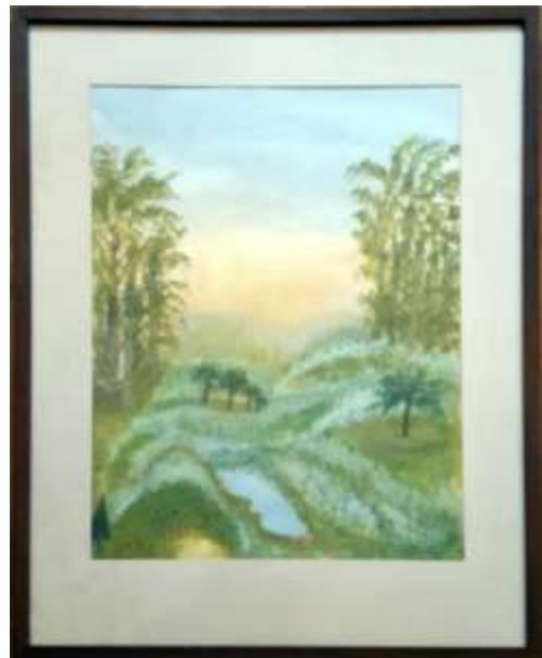
Gerdi Kullberg, gouache 1977, 39 x 29 cm.