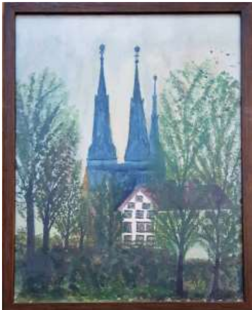
Gerdi Kullberg, Uppsala domkyrka , gouache 1970, 40 x 30 cm