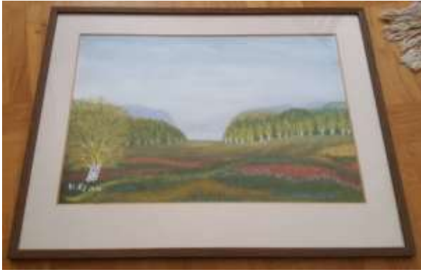
Gerdi Kullberg, gouache 1979, 30 x 45 cm.