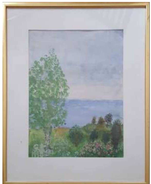
Gerdi Kullberg, gouache 1993, 40 x 29 cm.