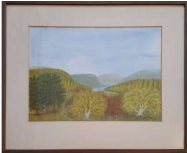
Gerdi Kullberg, Färd mot norr , gouache 30 x 39 cm.