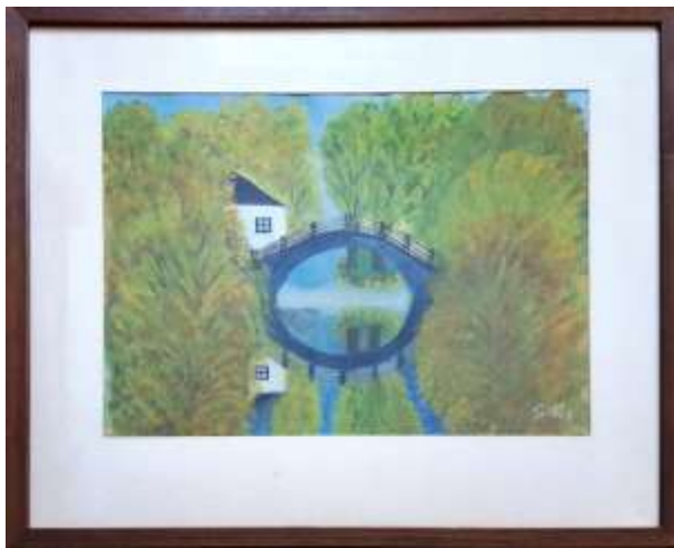
Gerdi Kullberg, gouache 25 x 33 cm.