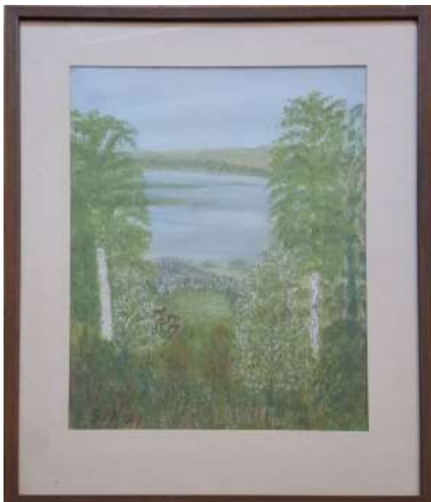
Gerdi Kullberg, gouache 39 x 29 cm.