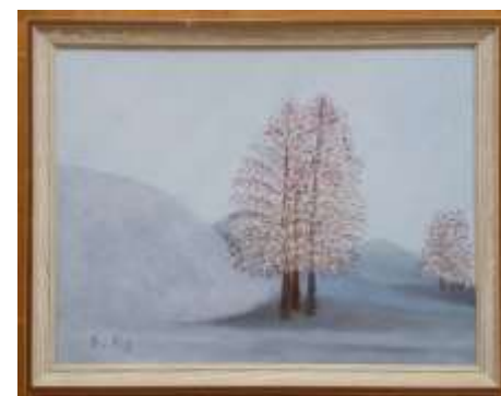
Gerdi Kullberg, oljemålning på duk, 35 x 45 cm.