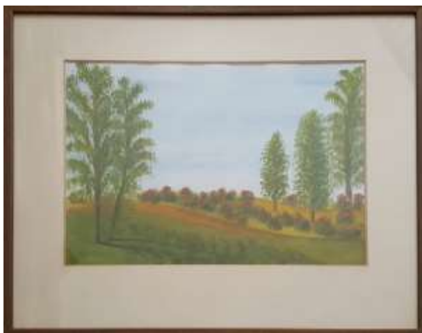
Gerdi Kullberg, Rosenbuskar , gouache 29 x 40 cm.