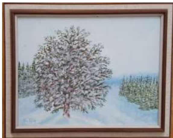
Gerdi Kullberg, oljemålning på pannå, 27 x 35 cm.