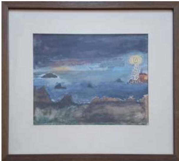
Gerdi Kullberg, Efter ovädret , akvarell 1970, 19 x 23 cm.