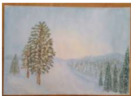
Gerdi Kullberg, Ett ögonblick... , gouache 24 x 34 cm.