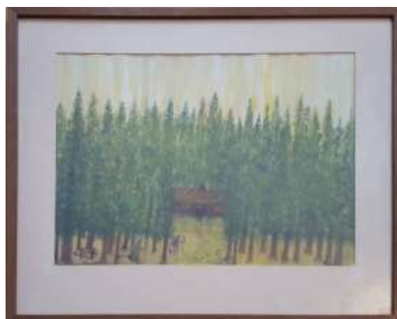
Gerdi Kullberg, De nya grannarna, gouache, 29 x 39 cm.

Pappan var indelt soldat så det här kan vara ett av deras boställen innan de kom till Ringvalla. Hon var fantasifull. Kanske kommer hon själv mitt i bilden – hejar – Hallå! Det lyser i stugan.