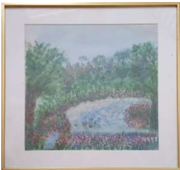
Gerdi Kullberg, gouache 1979, 31 x 29 cm.