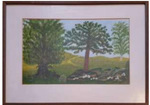
Gerdi Kullberg, gouache 1980, 30 x 44 cm.