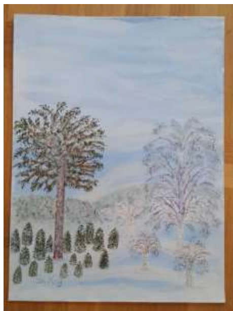
Gerdi Kullberg, gouache 40 x 30 cm.

Vid något tillfälle beskrev hon träden som sin familj. Sin släkt. Vuxna och barn. Det tänker jag ofta på när jag ser hennes målningar med stora och små träd. De med ett enda eller ett dominerande träd förknippar jag med hennes person.