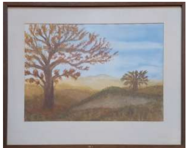
Gerdi Kullberg, Sandyner , gouache 29 x 39 cm.