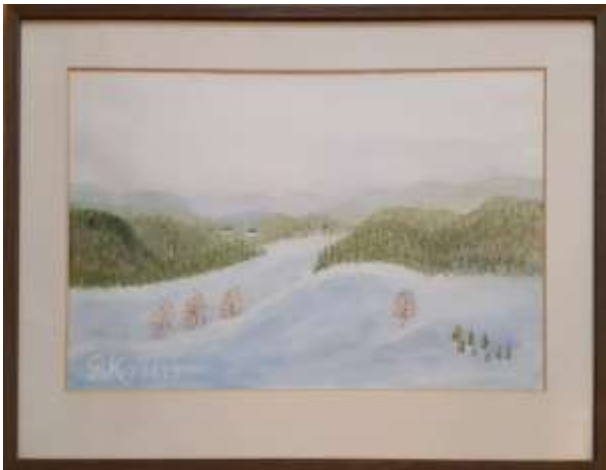
Gerdi Kullberg, gouache 1979, 30 x 45 cm.