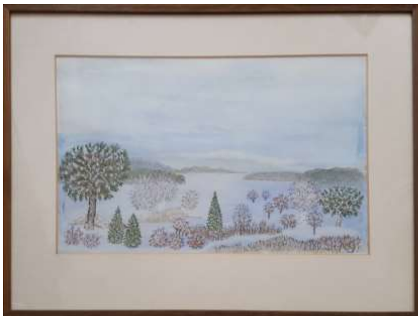
Gerdi Kullberg, gouache 1980, 30 x 45 cm.

Vid något tillfälle beskrev hon träden som sin familj. Sin släkt. Vuxna och barn. Det tänker jag ofta på när jag ser hennes målningar med stora och små träd. De med ett enda eller ett dominerande träd förknippar jag med hennes person.