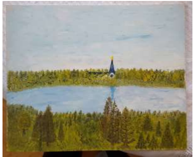
Gerdi Kullberg, Fläckebo kyrka , oljemålning på pannå 1972, 22 x 27 cm.