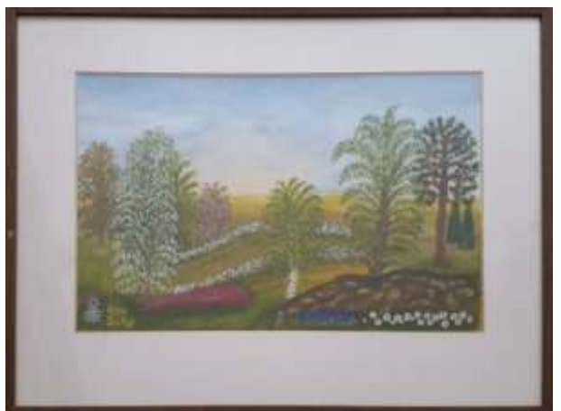
Gerdi Kullberg, gouache 1980, 30 x 45 cm.