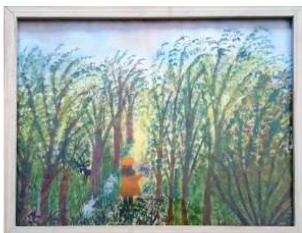
Gerdi Kullberg, gouache 25 x 33 cm.

Pappan var indelt soldat så det här kan vara ett av deras boställen innan de kom till Ringvalla. Hon var fantasifull. Kanske kommer hon själv mitt i bilden – hejar – Hallå! Det lyser i stugan.