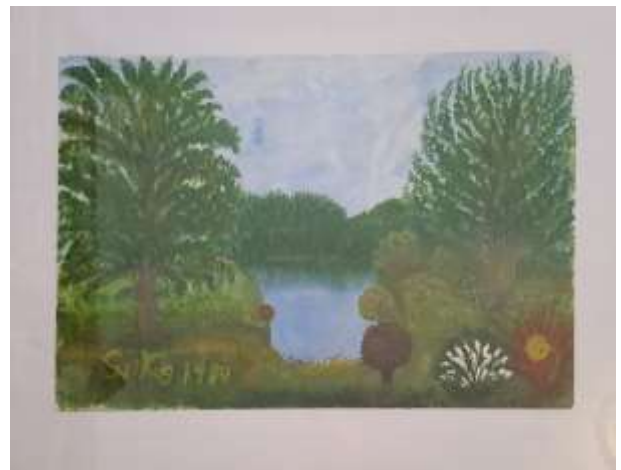
Gerdi Kullberg, gouache 1989, 30 x 42 cm.