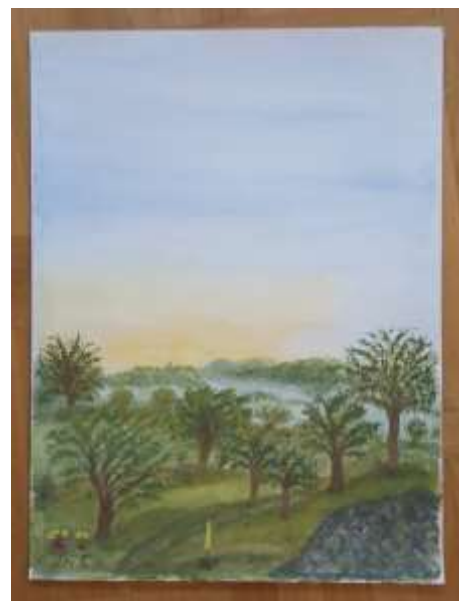
Gerdi Kullberg, gouache 40 x 30 cm.