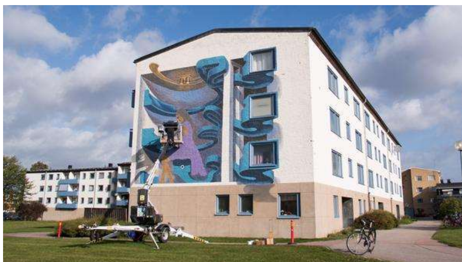
Arbetet med att måla konstverket på Berggatan 9 har pågått hela veckan. Det ska vara klart fredag den 21 september.

De som har kört på Ringgatan vid Åkra den här veckan har antagligen sett att det på en gavel på ett av hyreshusen börjar växa fram ett stort konstverk. Muralmålningen täcker en hel vägg ut mot Ringgatan.