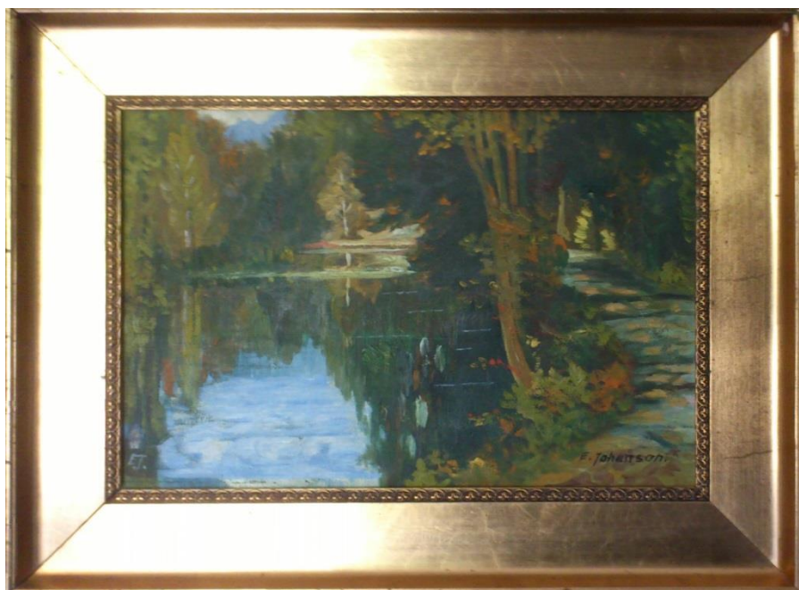
Erik Johansson, oljemålning på duk, 30 x 45 cm. Väsby Kungsgårds samlingar nr 4066.