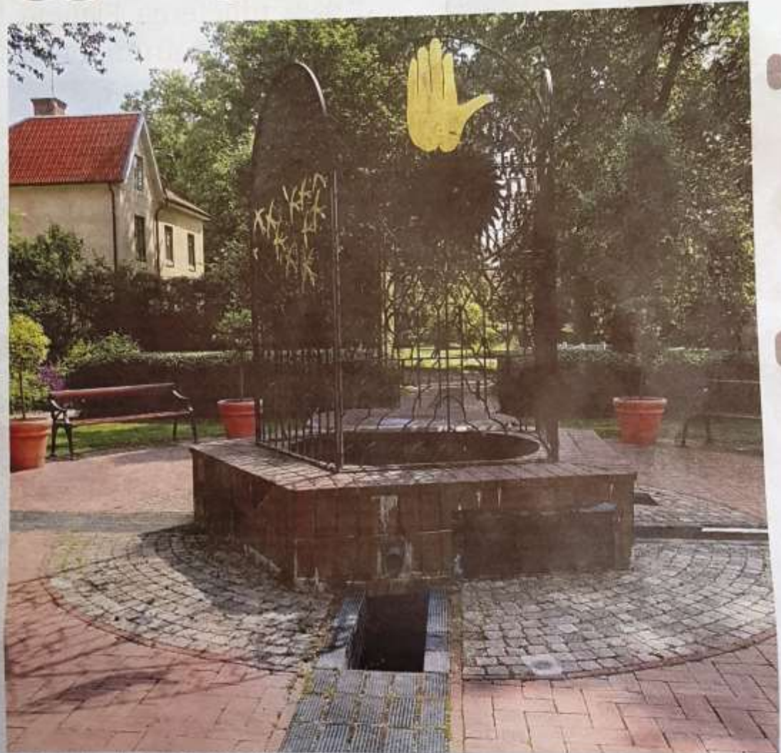
Fontänen är skapad av konstnären Acek Oldenburg och keramikern Åsa Ormell.

Hur var det möjligt att en så symboldig plats ur Bibels och Österns värld kunde anläggas i hjärtat av Västmanland? Och är det inte förunderligt att den så väl passar in som stadens hyllning till en av landets viktiga konstnärer för 100 år sedan.