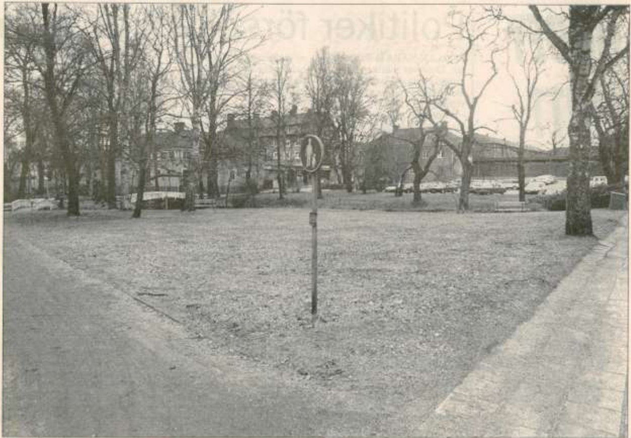
Aguélis egen plats. Här ska den ligga, den rofyllda plats med flödande vatten i keramiska kärl som ska minna om stadens konstnärsson Ivan Aguéli. Med rösterna 7 mot 5 – och en nedlagd – beslutade kommunstyrelsen i går att platsen ska anläggas.