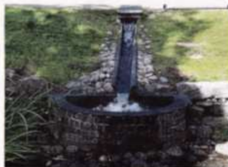
Den långa trårinnan har försetts med tjärpapp.