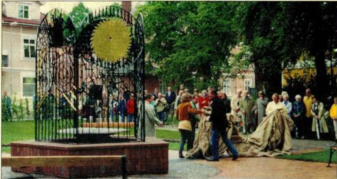
Täckelsen har fallit från brunnen på Ivan Aguélis Plats i Sala.

En plats för möten mellan konst, kulturer, religioner och människor i vår tid.