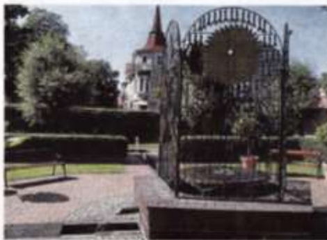
Nu är det åter vattenliv i konstverket vid Aguéliplatsen.

En livlig debatt har också pågått på Facebook och den