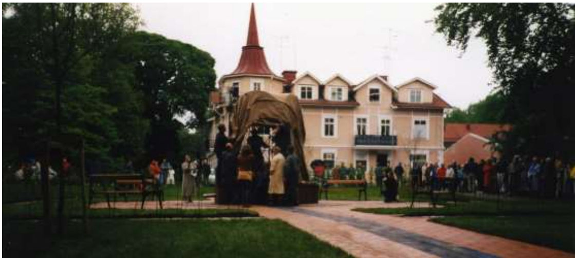
24 maj 2000.