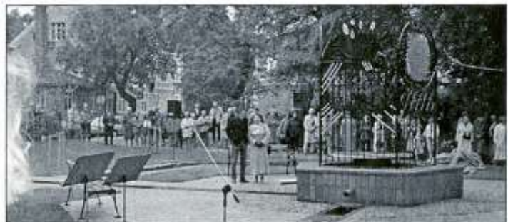
Så ser den nyinvigda Aguéliplatsen ut.