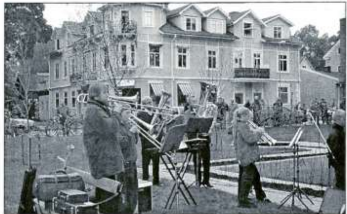
Musikskolans elever bjöd på underhållning.