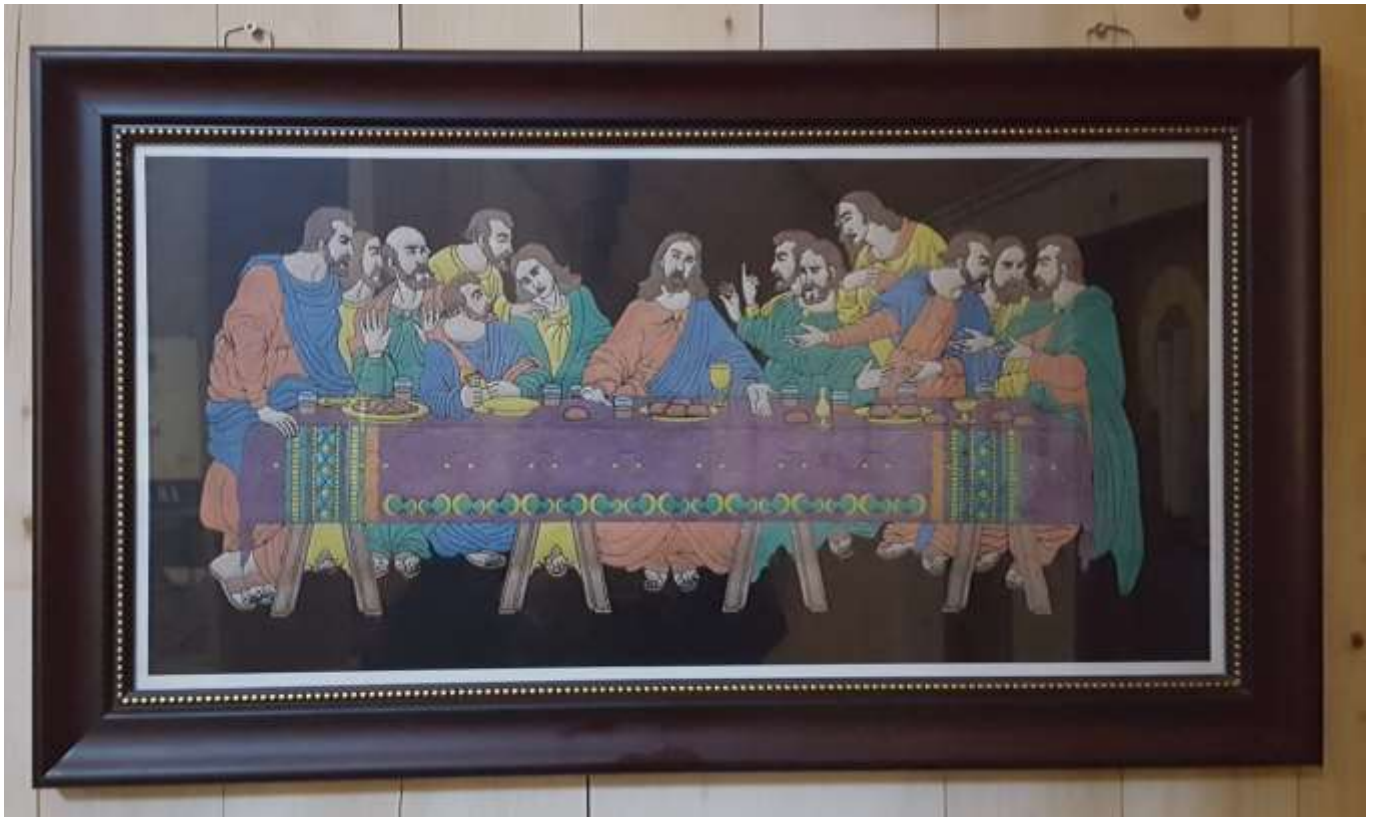
Nattvarden. Broderad av modern till en diakon från Indien.