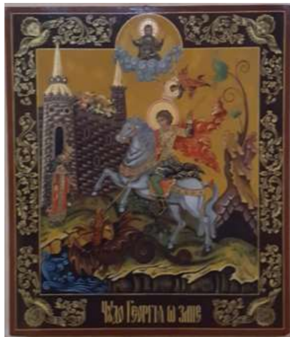
St Göran och draken. Ikonmålning, gåva från St Petersburg.