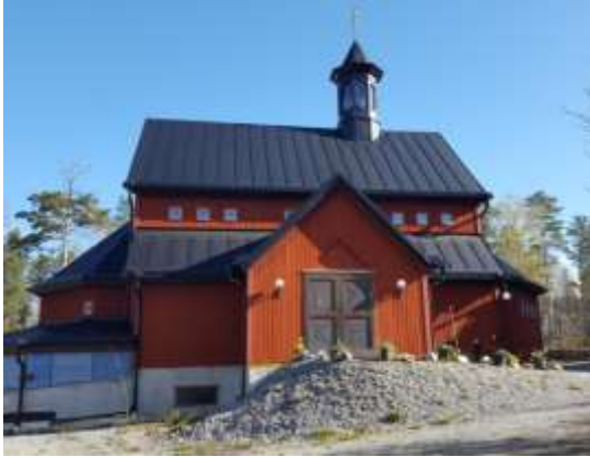
Enhetens kyrka som allmänheten kan besöka.