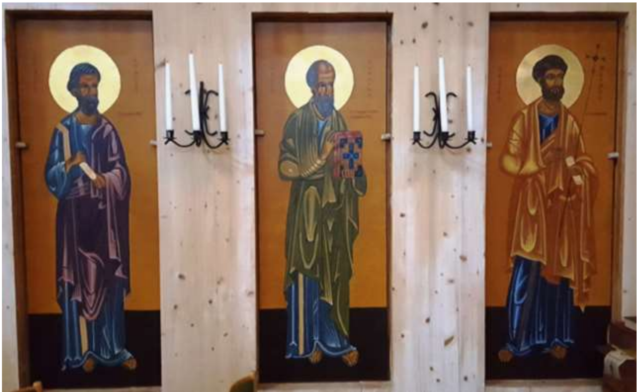
Jakob, Johannes och Petrus.