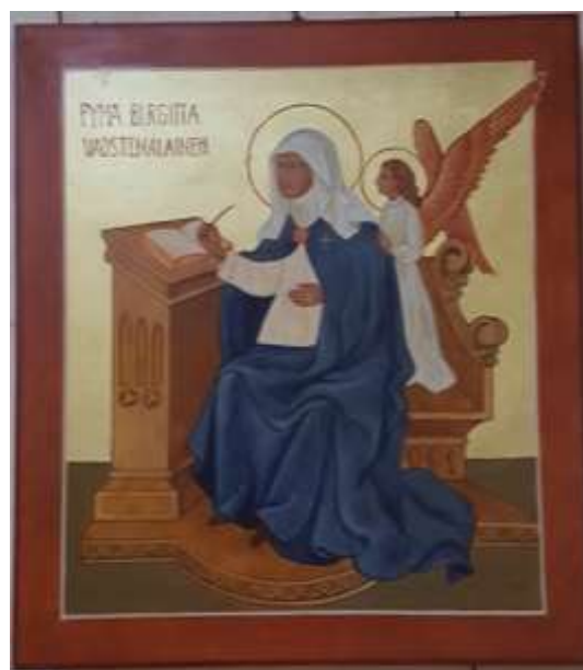
Den helige Birgitta av en finsk ikonmålare. Gåva till kyrkan.

Wikipedia: Begreppet "själv tredje" åsyftar en huvudperson som ingår i en grupp vars totala antal nämns.