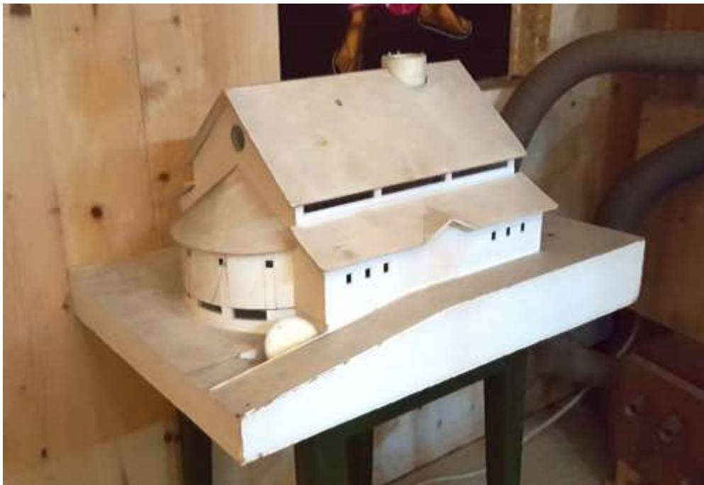
Arbetsmodell för Enhetens kyrka av arkitekten Bo Svalby,