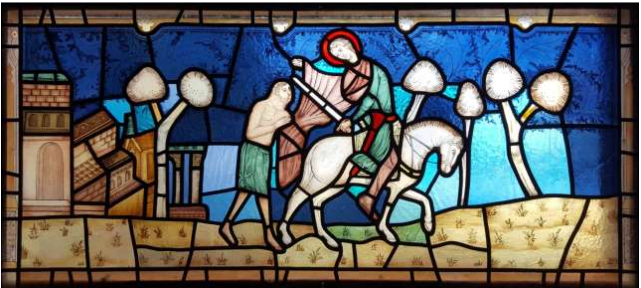
Den helige Martin. Glasmålning från Lettland, placerad i ett fönster en trappa ner i kyrkan.