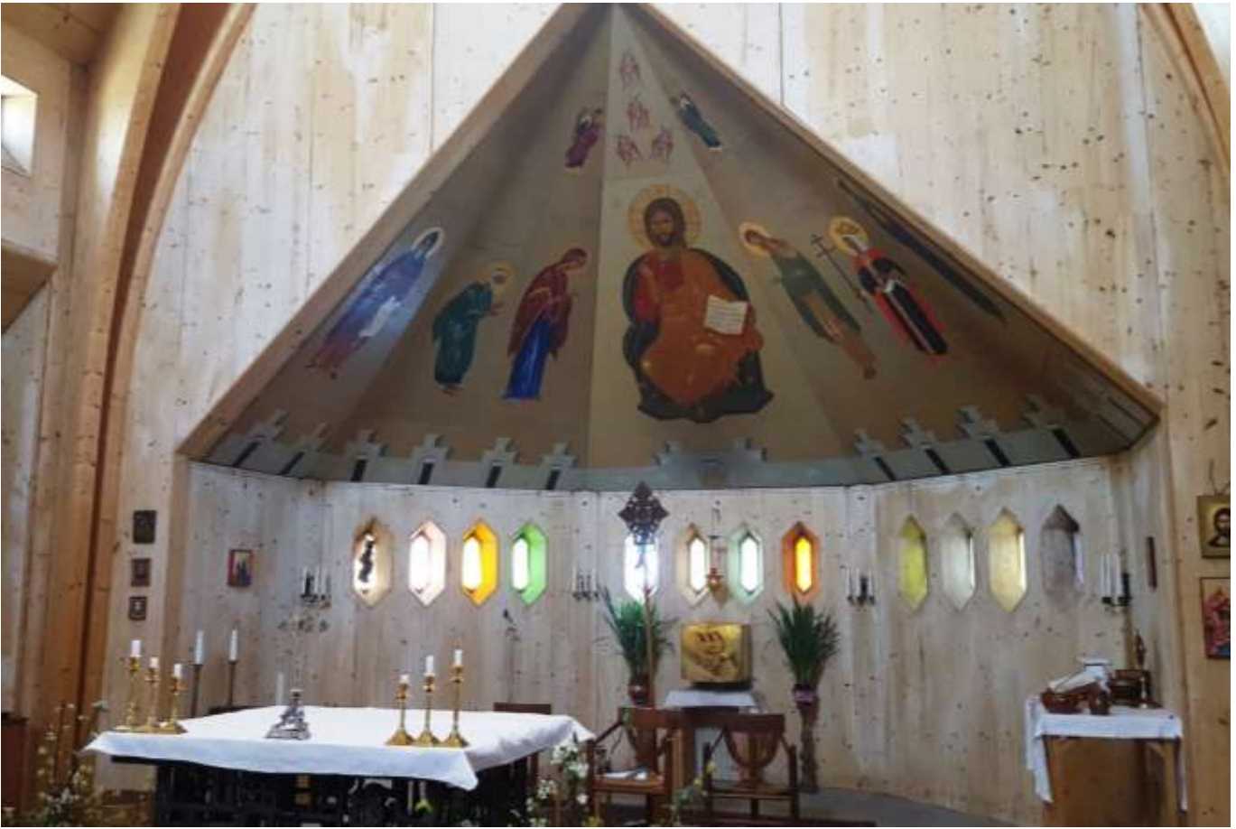
Absiden (halvrundad utbyggnad) i kyrkan.