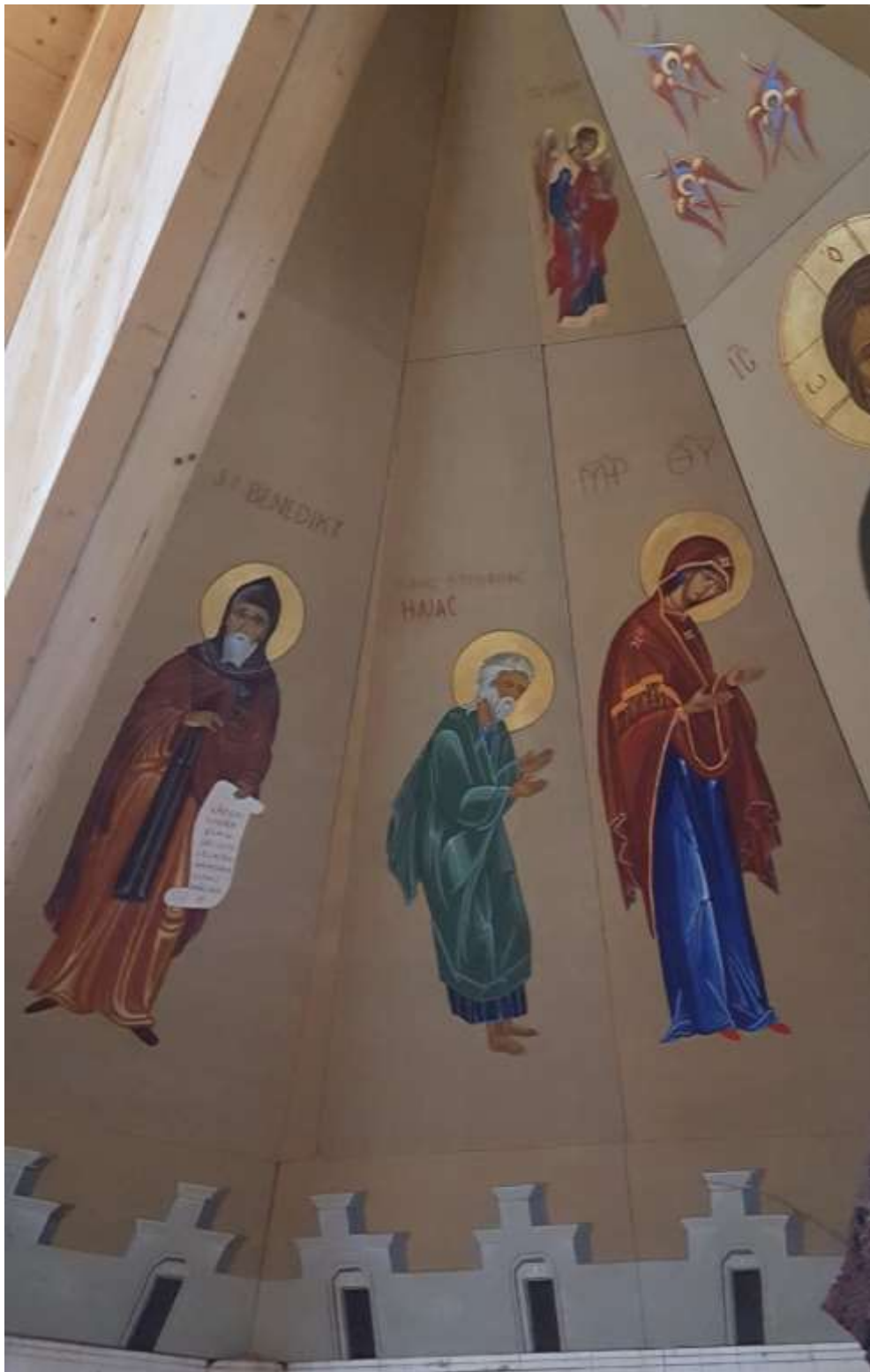
Vänstra delen av absiden. Fr.v. Den helige Benedikt , profeten Elia i mitten, sedan Guds moder Maria , överst två ärkeänglar – Gabriel och Mikael .