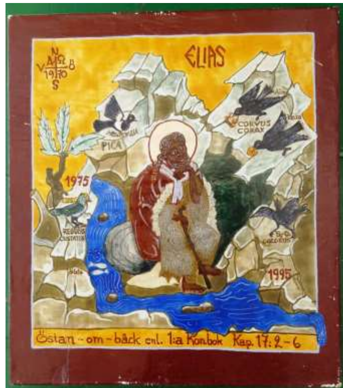
Ulla Hamsten, Ikonen med Elias, tempera på pannå, 29 x 26 cm. Tillhör Östanbäcks kloster.

Jag sa att jag möter er vid avtagsvägen i Gullvalla in till Östanbäck. När de då kommer in i en skola i Västmanland så satt en stor plansch på väggen med Visby domkyrka. Det borde ju ha varit Västerås domkyrka. Men tre av bröderna var prästvigda i Visby domkyrka, så de kände sig speciellt välkomna. Så man kan få svar.