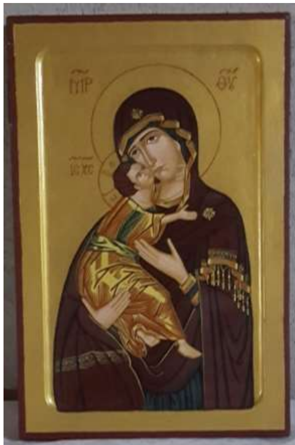
Guds moder. Ikon från Ukraina, gåva till Enhetens kyrka.