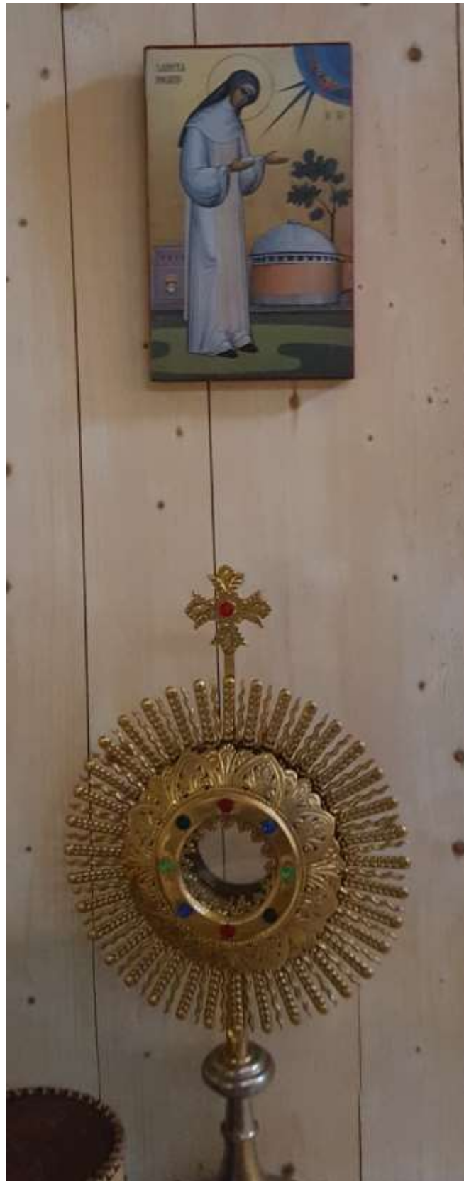
Replik av ikonen Den Helige Ingrid av Skänninge . Gåva från kriminalvården i Skänninge. T.v. på ikonen kriminalvårdens sigill. Kupolen är en bild av kapellet i anslutning till fängelset i Skänninge.