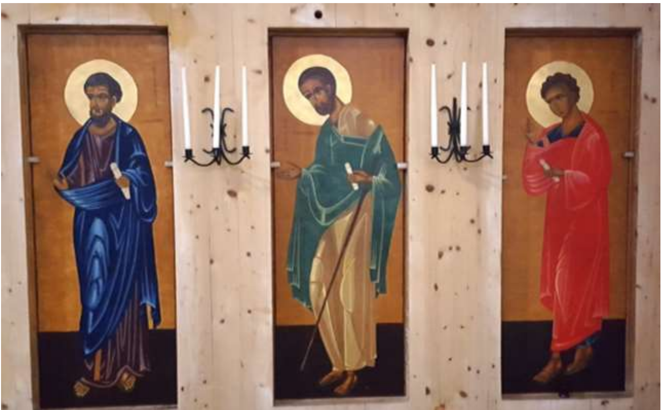
Bartolomeus, Judas Tadeus och Tomas.