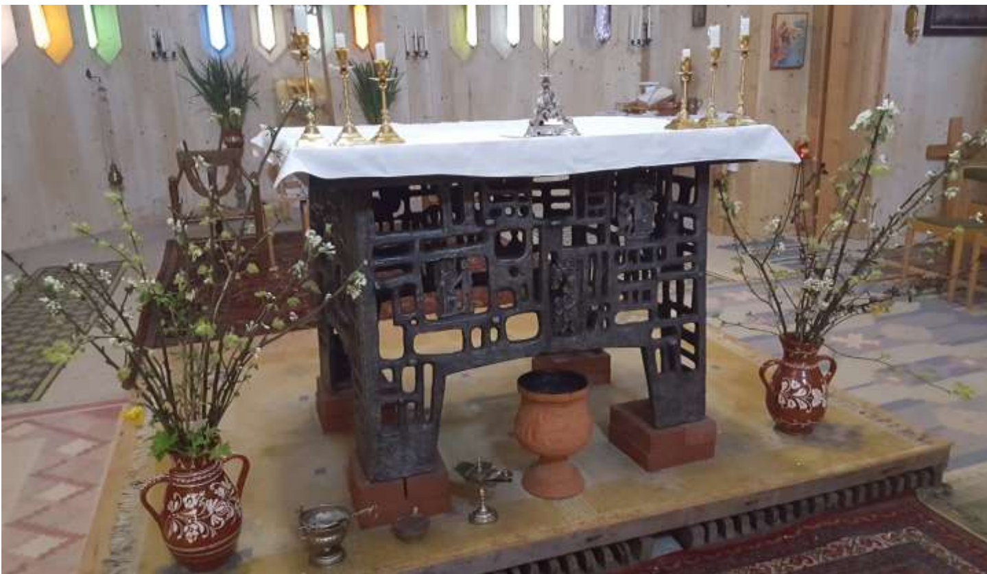
Altaret med scener ur Jesu liv.

Konstnär Eginio Weinert (1920-2012). Gåva från en katolsk församling i Ruhrdistriktet, Tyskland.