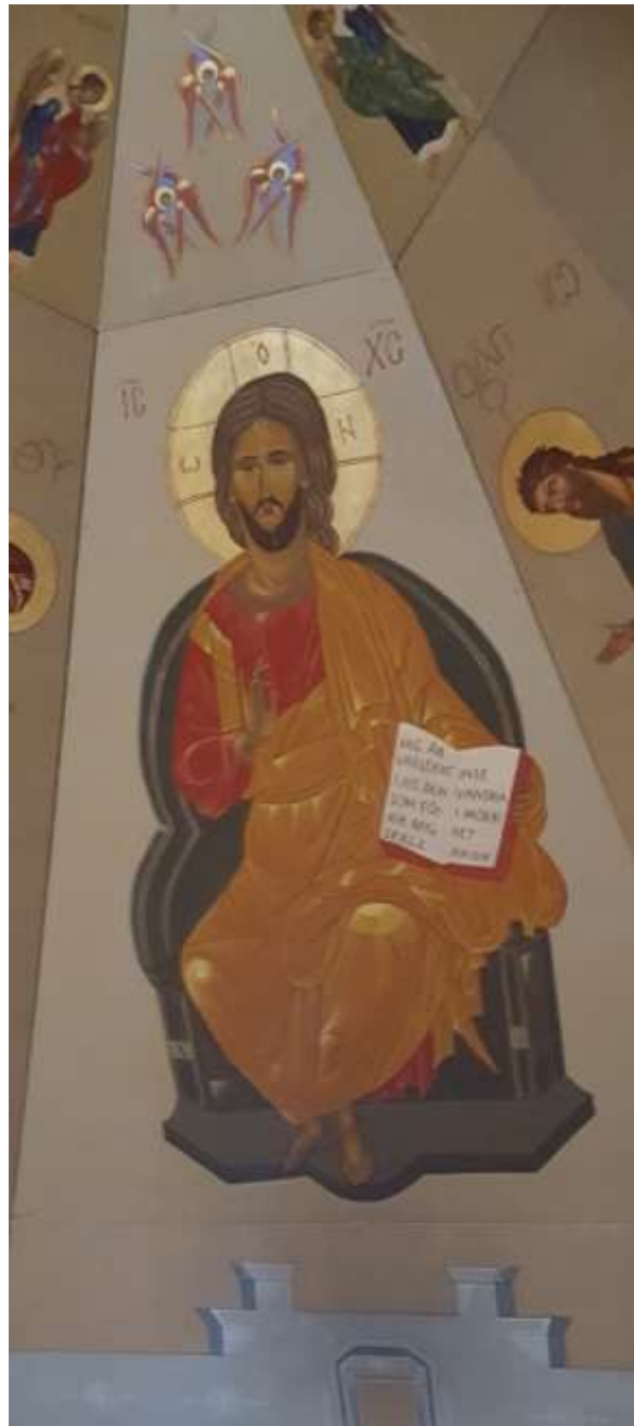
Mittdelen av absiden. Kristus Pantokrator.

Wikipedia: Pantokrator (grekiska 'den allsmäktige') kallas en bysantinsk bröstbilsframställning av Kristus som allsmäktig härskare, vanligen i en kyrkas kupol eller absid. Jesus framställs med stora ögon, liten mun, smal näsa och med långa fingrar. Jesus brukar avbildas med höger hand lyft för att välsigna, hållande en smyckad eller upplagen bok i vänster hand. Han har skägg och huvudet omges av en gloria.