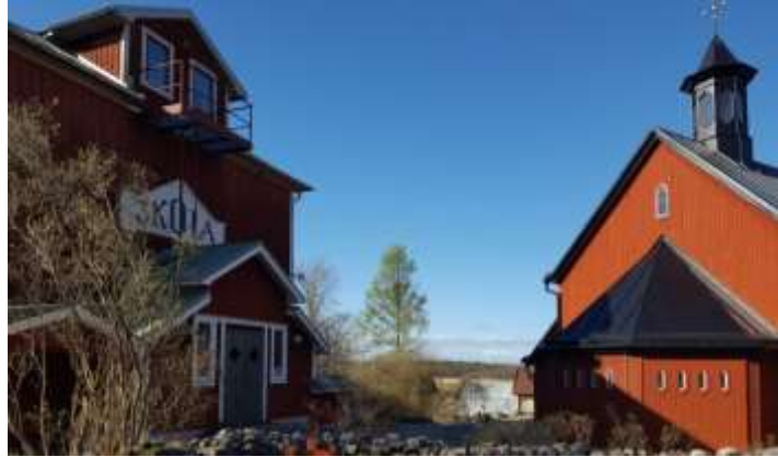
Klostret och Enhetens kyrka