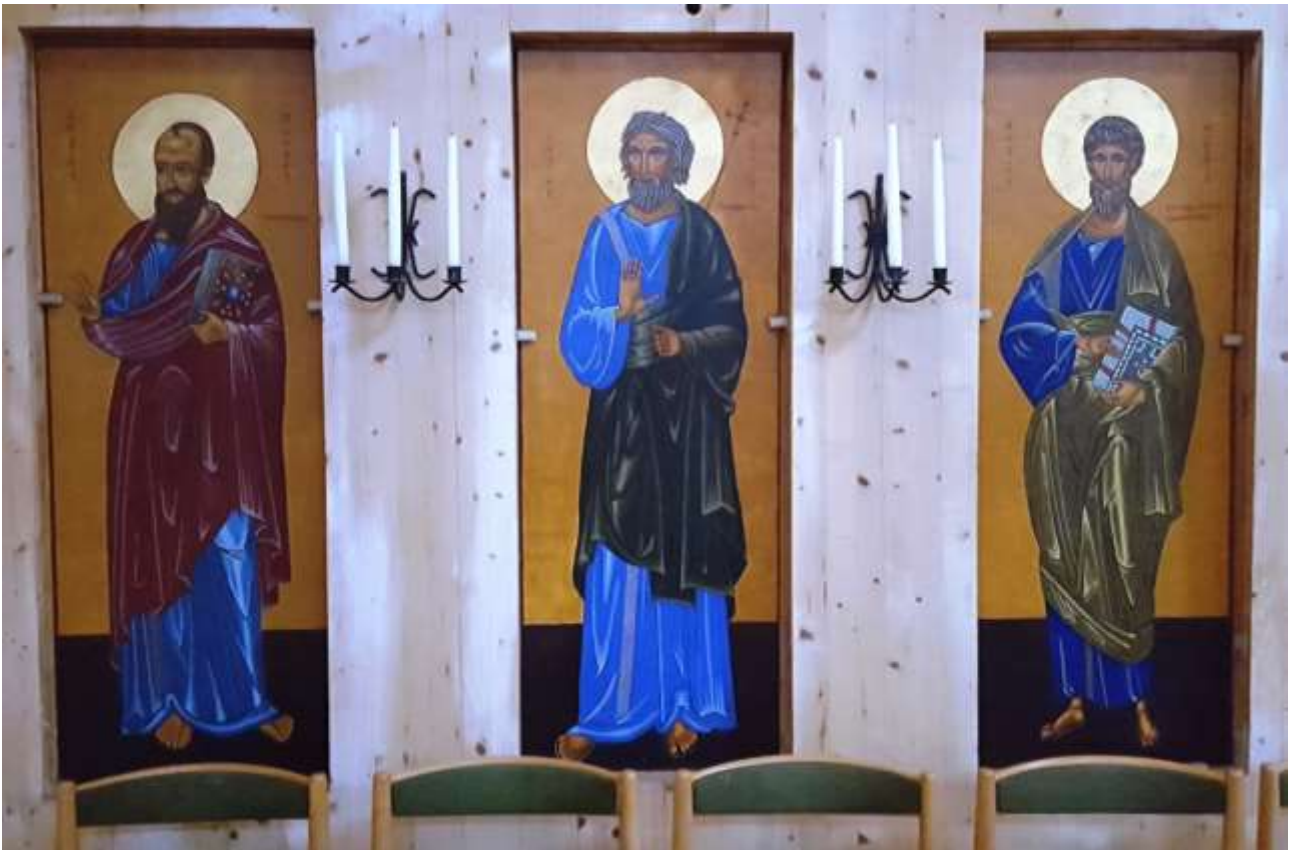
Paulus, Andreas och Matteus.