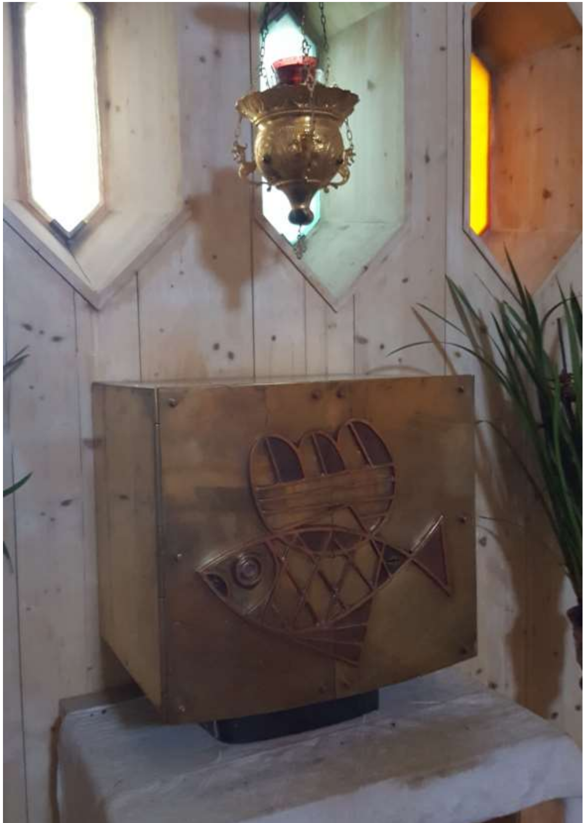
Tabernakel – sakramentskåp där man förvarar det överblivna från nattvarden. Gåva från katolska församlingen i Västerås.