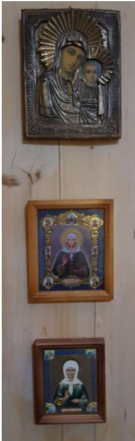
Överst: Mariaikon från St Petersburg, ca 1900.