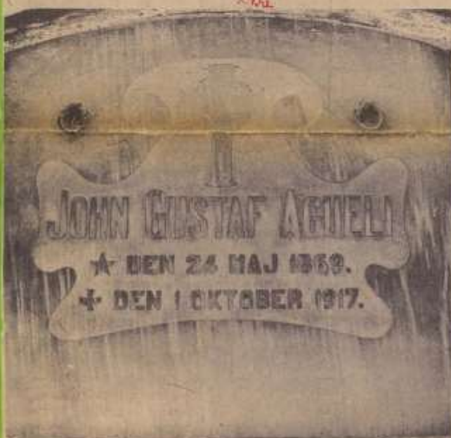
En namntavla utformad av konstnären Carl Wilhelmson utmärker Ivan Aguélis grav på Hospitalskyrkogården i Prat de Llobregat utanför Barcelona.

Den äldre sonen kom i handelslära i Sala men John Gustaf hade inte mycket till övers för dylikt. Han var intelligentare än brodern, därtill något av despot. Men i skolan gick det dåligt. Detta hade till följd, att fadern, som först avgudade sin son, omsider övergick i hat mot sin avkomma. Han blev hård mot sin son och hänsynslös mot sin hustru, som ”skämde bort sonen till en slarver”. I läroverket gick han ett år i andra och två år i tredje klass, varefter han gick tre terminer i Västerås, IV och V klass i h.a.l. Det slöt med misslyckande och förflyttning till läroverket i Falun, där det inte gick stort bättre, och därför sändes han till Visby. Här läste han visserligen flitigt, särskilt botanik och naturvetenskap, men här fick han också drömmen om att bli konstnär, vilket kom hatet hos fadern att flammas upp än vildare. Bönen om att få bli konstnär möttes av oförsonligt avslag. I Visby tröttnade man på hans ”studier”. John Gustaf Agelii blir Ivan Gustave Aguéli definitivt.