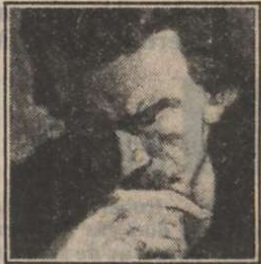
Aguéli – hemma till slut.