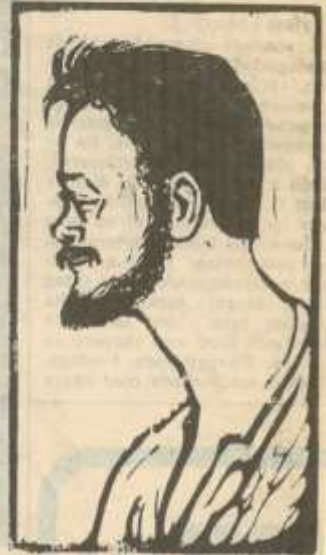
Ivan Aguéli — han får sin viloplats Sala.

För eftervärlden har Aguéli mer och mer kommit att framstå som en av det svenska måleriets föregångsmän, en av de finaste koloristiska begåvningarna. Hans namn är i hög grad knutet till Visby där han började sin konstnärskarriär i unga år. Både Frankrike och Egypten var hans egentliga målarrevir. Under Parisåren kom han även att intressera sig för anarkism. Han arresterades vid ett tillfälle men