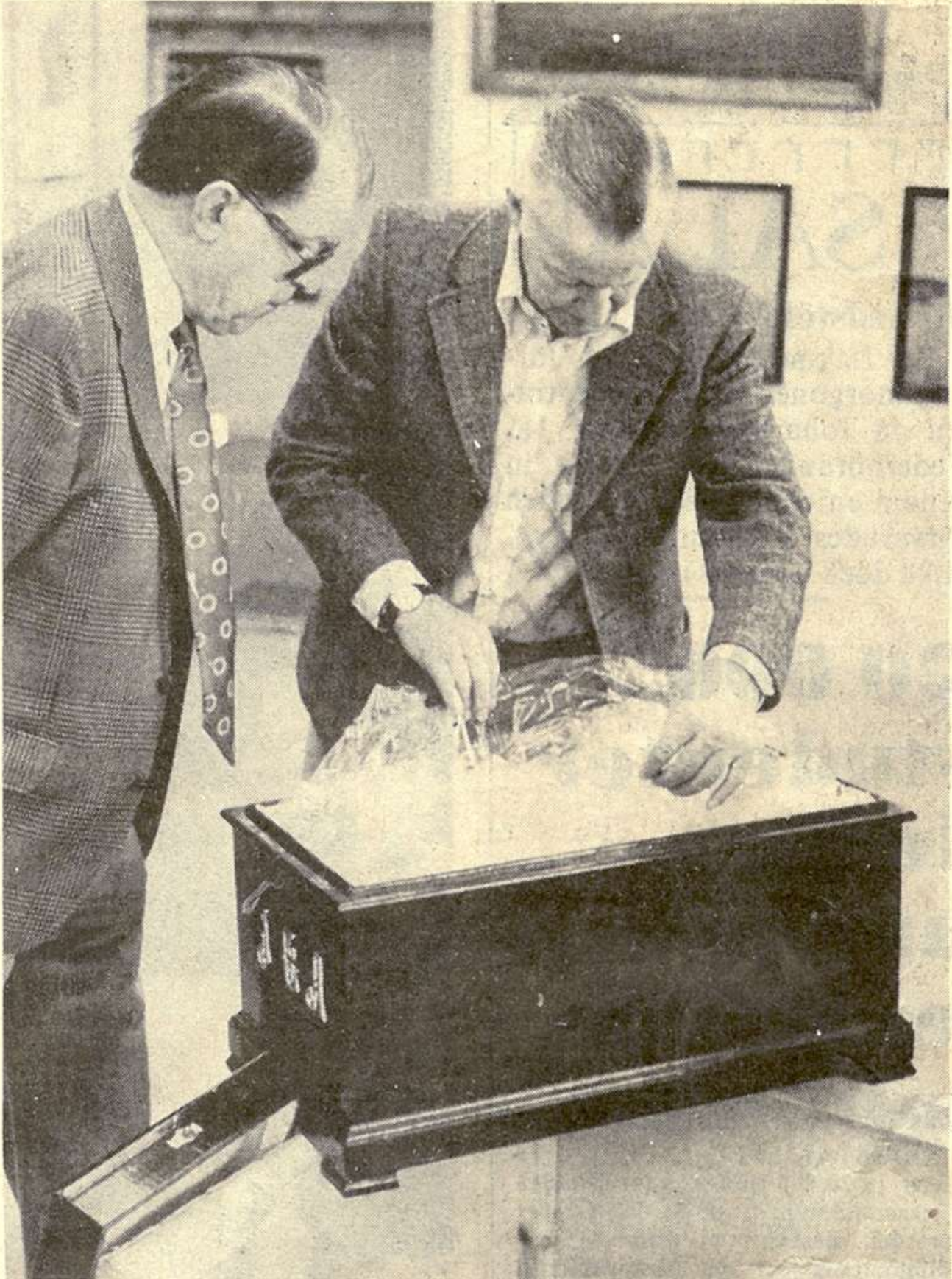
Men vad är detta? Det fanns varken urna eller stoft i kistan.