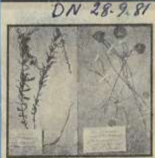
Strimsporre, Linaria repens , pressade 1880 av Ivan Aguéli.

Den stämmingsfulla stunden i kyrkan avslutades så med flöjt och orgelmusik, varefter de drygt hundra församlade tågade förbi konstnären Ivan Aguéelis nya gravvård utanför Kristina vackra kyrka.