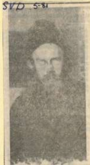
Ett ofullbordat porträtt av Ivan Aguéli, utfört 1898 av Fritz Lindström.

2 Denna gravvård har man inte kunnat föra hem, men en kopia har gjorts och placerats på kyrkogården i Sala.