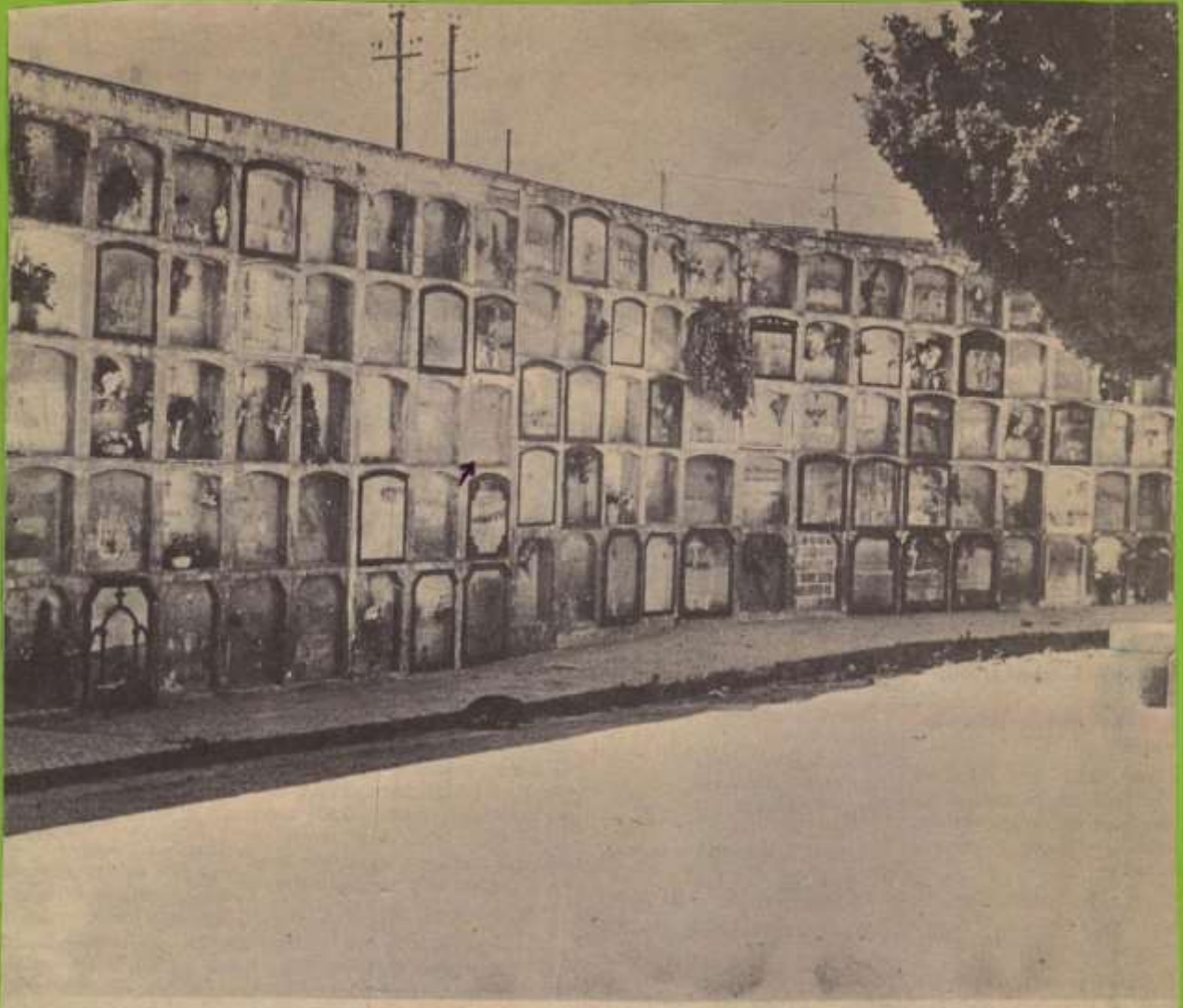
I den åttonde gravnischen från vänster i mittraden av denna enkla mur har Ivan Aguéli fått sitt sista vilorum.