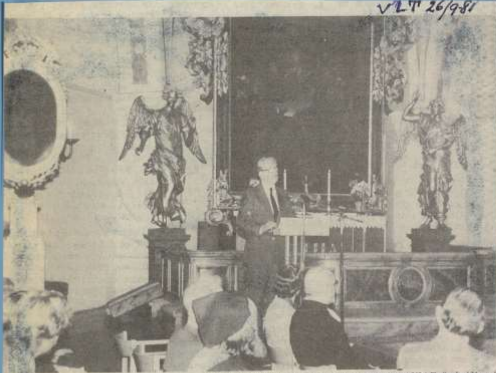
Poeten Bo Setterlind läser sin specialskrivna dikt Frände i ljuset.