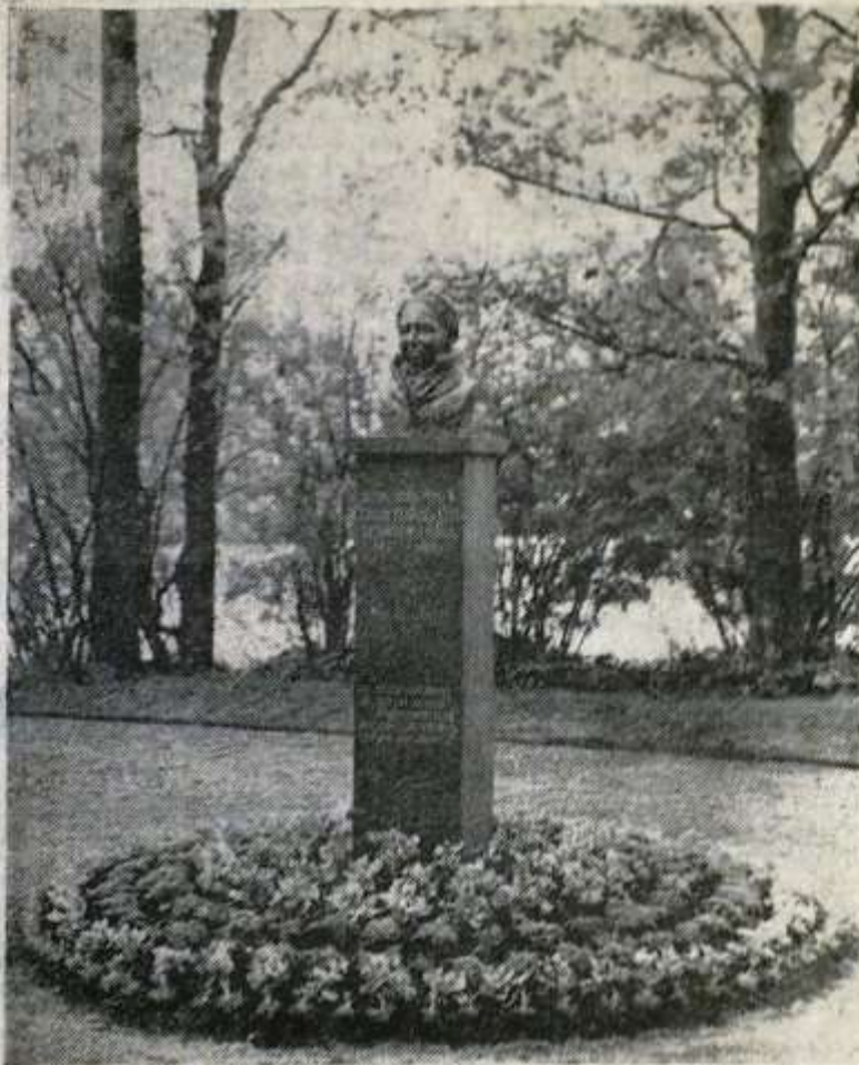
En bild av den vackra af Forselles-bysten efter avtäckningen.

Änslående högtidlighet på lördagskvällen. Tal av försköningsnämndens och stadsfullmäktiges ordf.