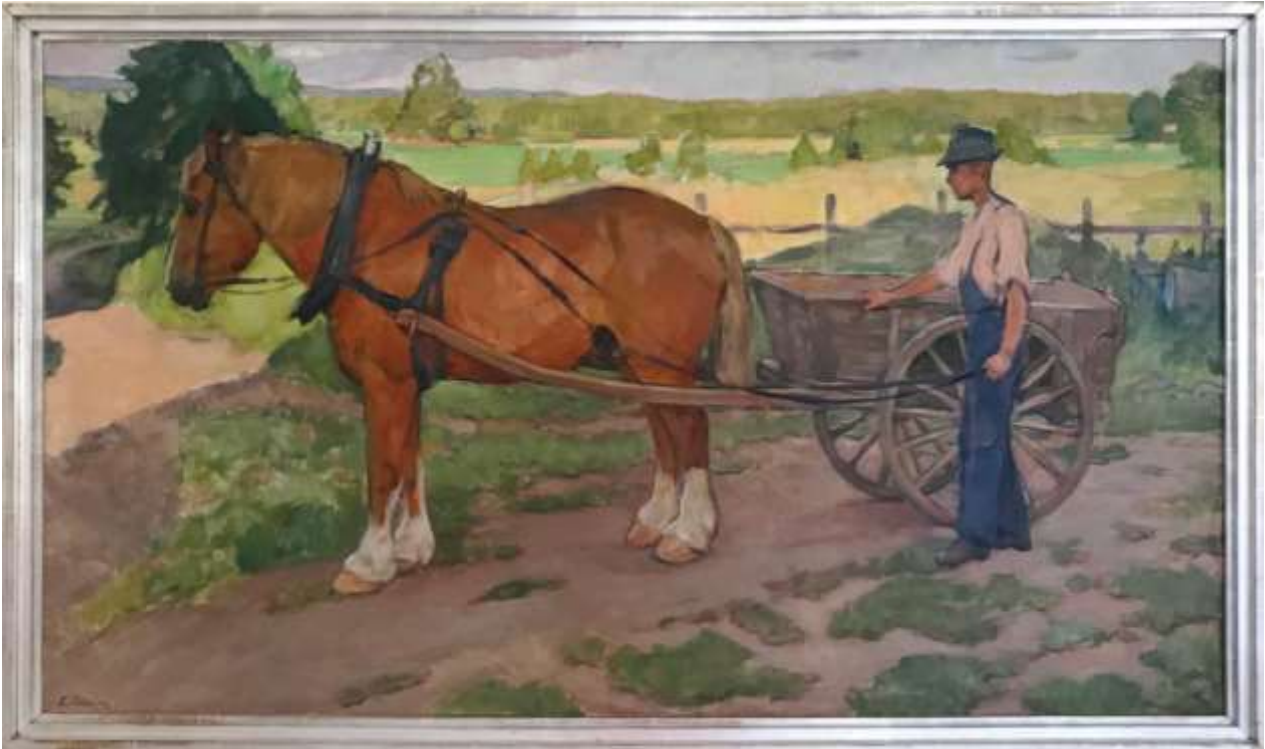
Elsa Celsing, Brunte , oljemålning, 84 x 149 cm.

Gåva av Jordbrukare-Ungdomens Förbund, JUF, vid invigningen av Möklintagården 25 oktober 1953.