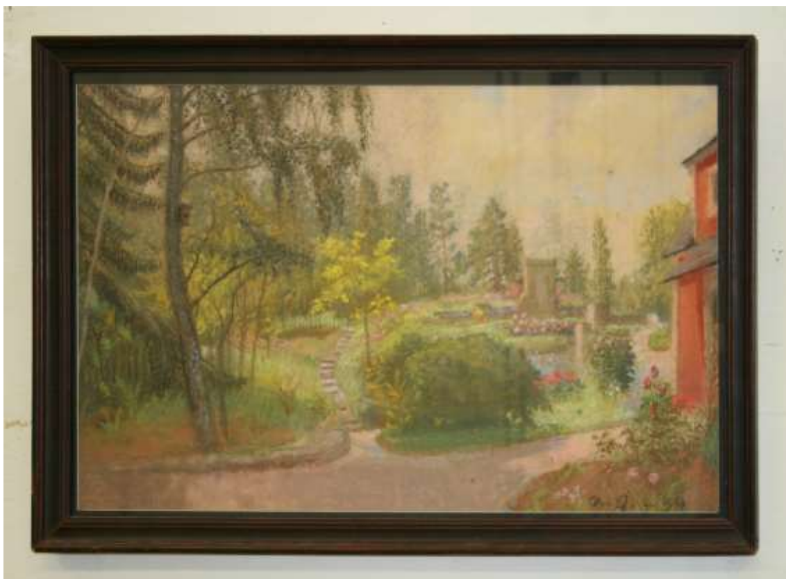
Aron Jerndahl, Trädgården vid Ateljén II , pastell 31 x 50 cm.