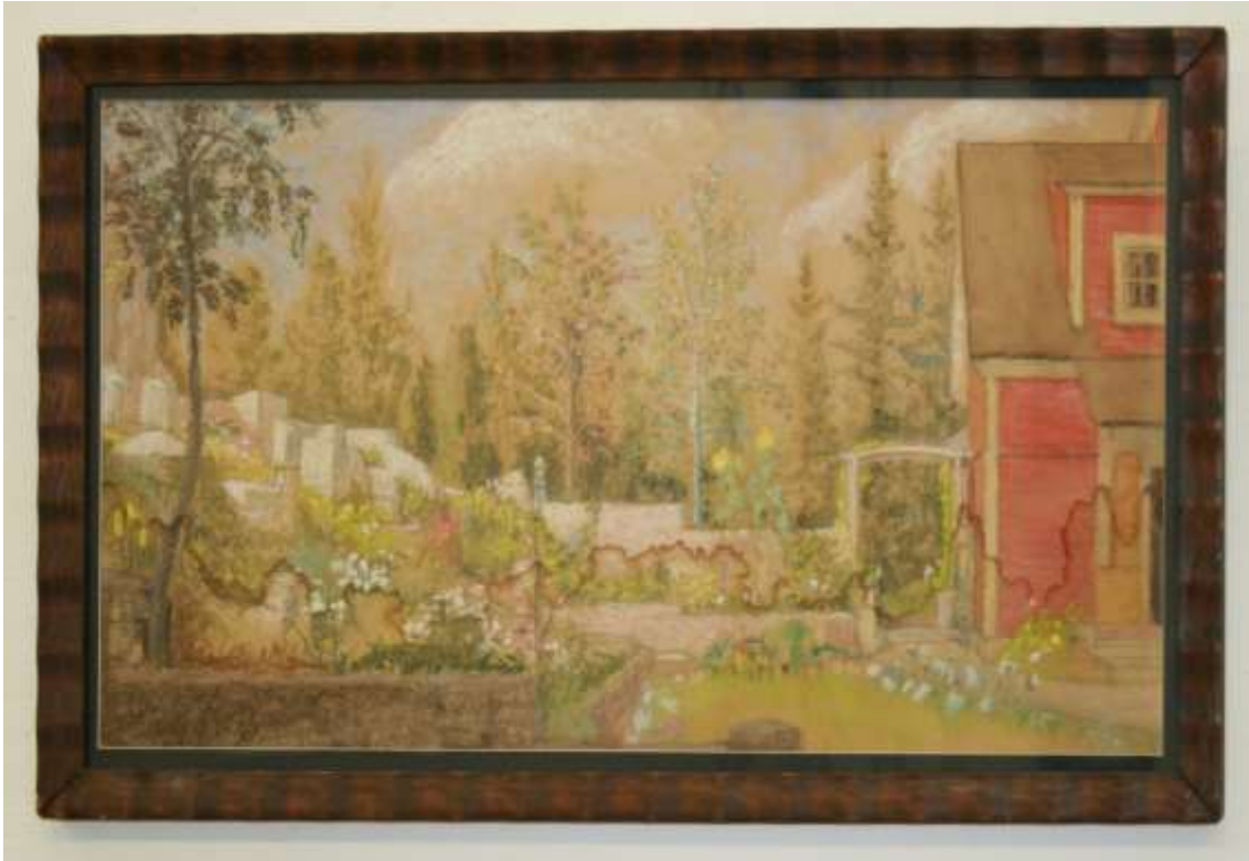
Aron Jerndahl, Trädgården vid Ateljén I , pastell 25 x 47 cm.