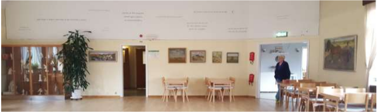
Interiör från Möklintagården.