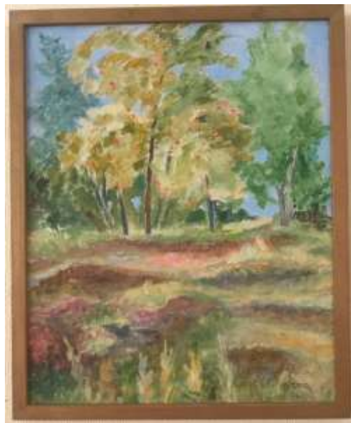
Ulla-Britt Jangö, oljemålning 2000, ca 35 x 28 cm.