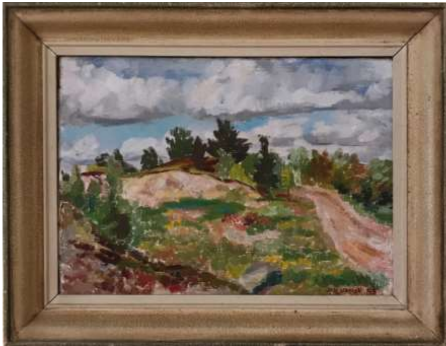
Jan Jangö, Grustaget utanför Ol-Ers , oljemålning 1943, 34 x 47 cm.