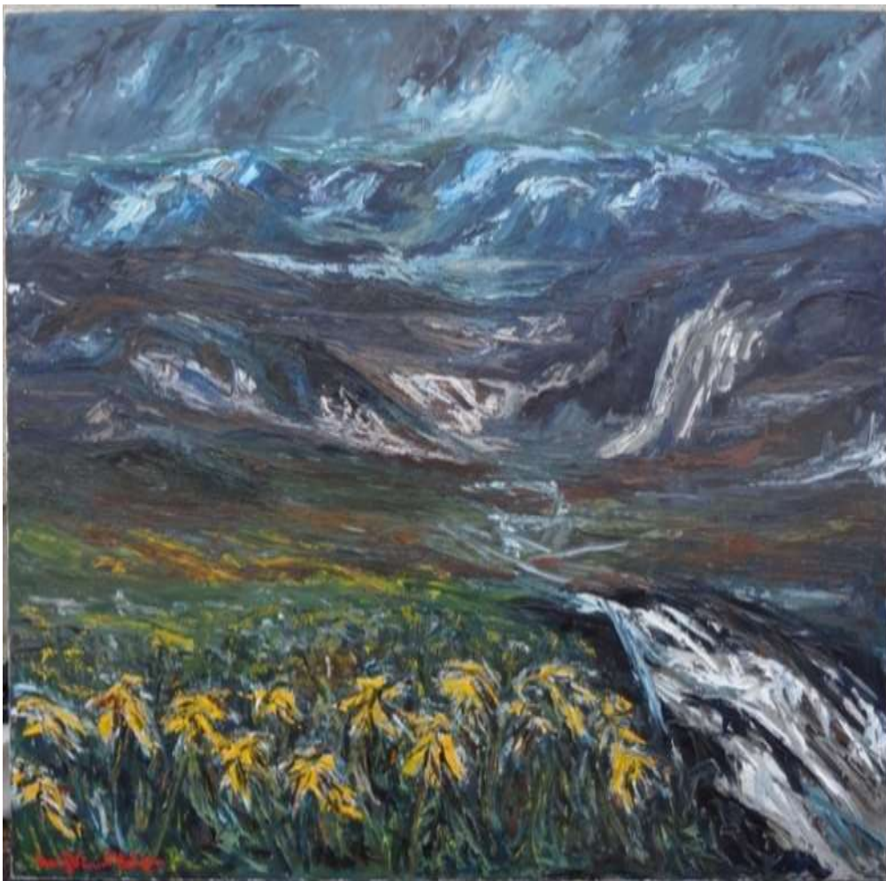
Harry Vincent Hellgren, oljemålning 100 x 100 cm.