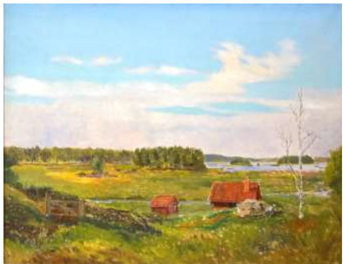
Edvard Jangö, Forneby, utsikt mot Storsjön , olja 1937, 34 x 40 cm resp. olja 1958, 62 x 80 cm