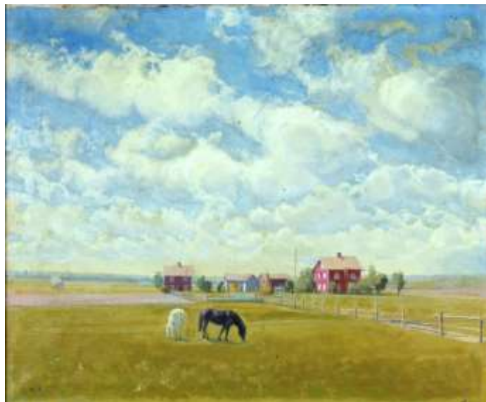
Aron Jerndahl, Gård med hästar , olja 49 x 59 cm.