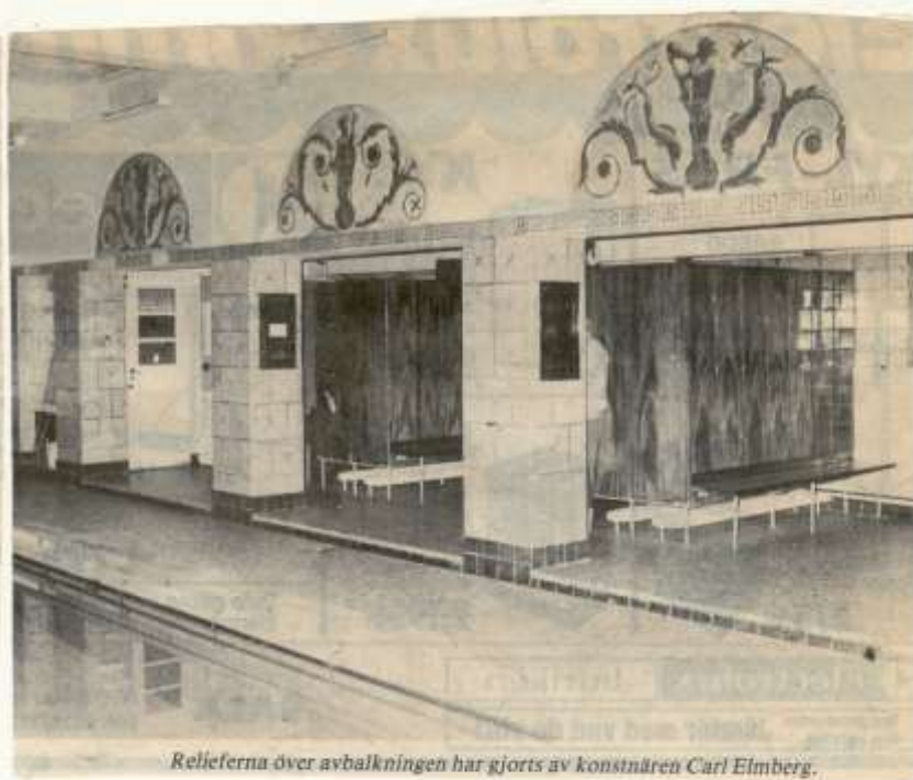
Relieferna över avbalkningen har gjorts av konstnären Carl Elmberg.