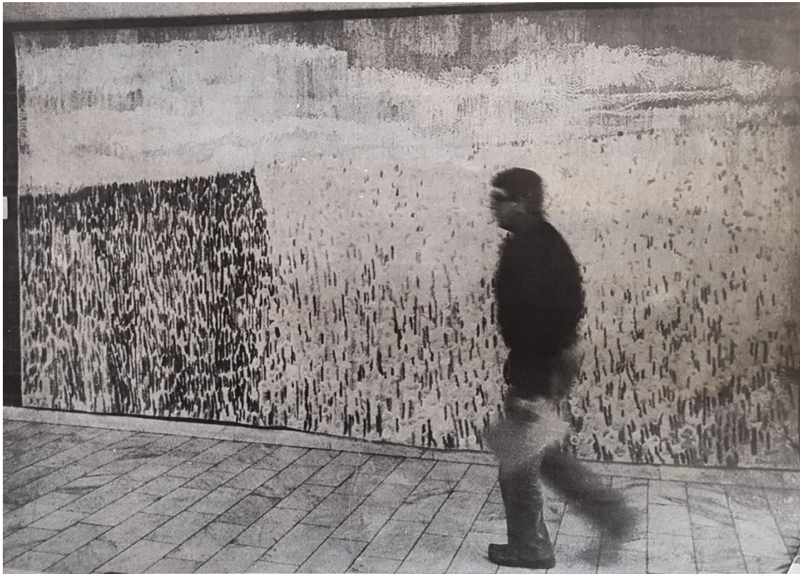
Ina Almegårds "Sommaräng" på Sala lasarett är ett konstverk, som de flesta salabor kommit i kontakt med.

Sala Allehanda 2 januari 1980, illustration i artikeln "Offentliga utsmyckningar":