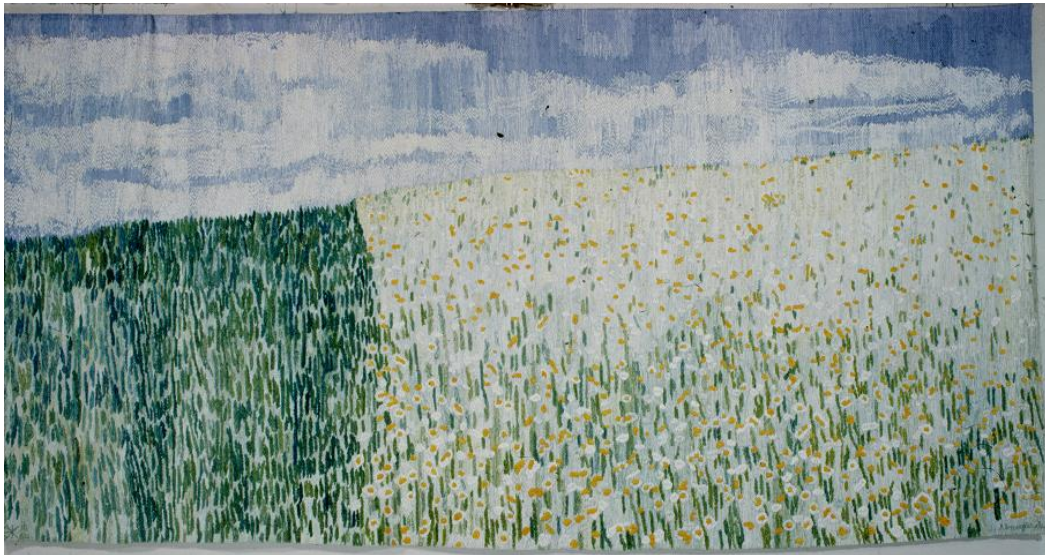
Ina Almegård, Sommaräng , textil 1969-70, 240 x 500 cm.

Den här textilen är f.n. nedtagen efter tillfälliga ombyggnationen av "gamla" lasarettets foajé. Vi får se om den kommer upp igen. Utdrag ur artikel i Sala Allehanda 20 maj 2020: