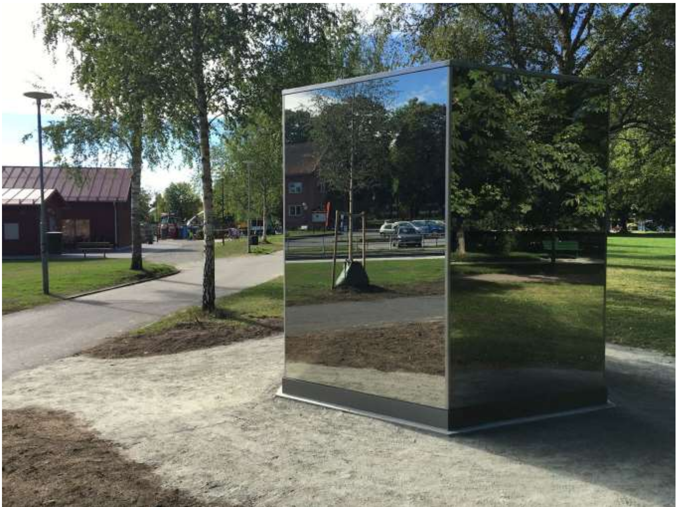
Vara vatten av konstnären Catrin Andersson.

Nyligen invigdes konstverket "Vara vatten" i Sala stadspark. Verket är en del av den ansiktslyftning som stadsparken fått under 2016 med ny entré, nybyggd kafébyggnad och nyanlagd parkering i direkt anslutning till parkområdet.