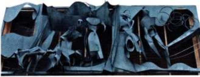
Bo Åke Adamsson: Galleriahuset (Sala kommun).