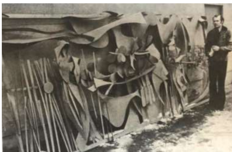
Del av väggskulpturen.