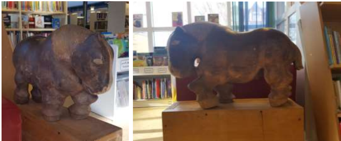
Arne Fälth, Häst , träskulptur

Lasse & Inger. I konsthallen finns verk av Lasse och även lite av Lasses fru Inger Åberg. - - - Inger arbetar med textil och gör både bildvävar och broderier, ofta i starka färger med naivistiska motiv.