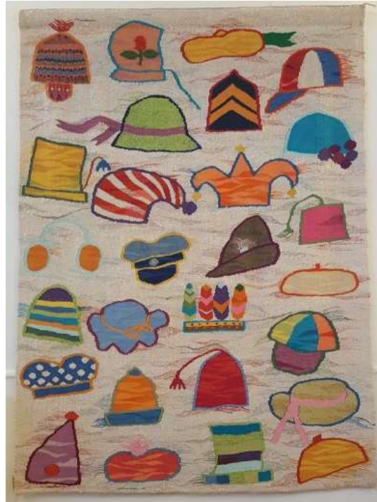
Inger Åberg, Hattar och mössor , textil 1980