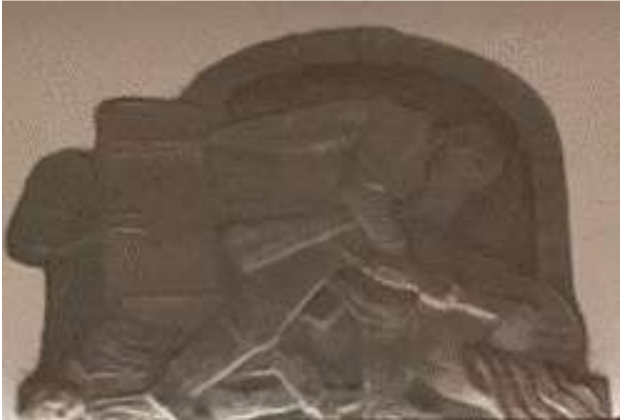
Carl Elmerg, Gruvhanteringen