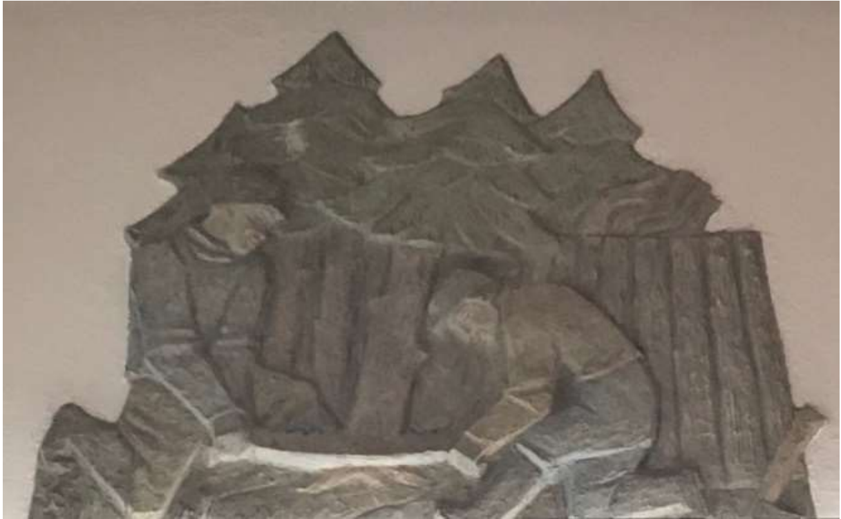
Carl Elmerg, Skogshanteringen