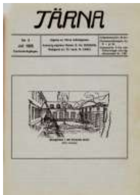
Ur tidningen Tärna nr 3 1928: