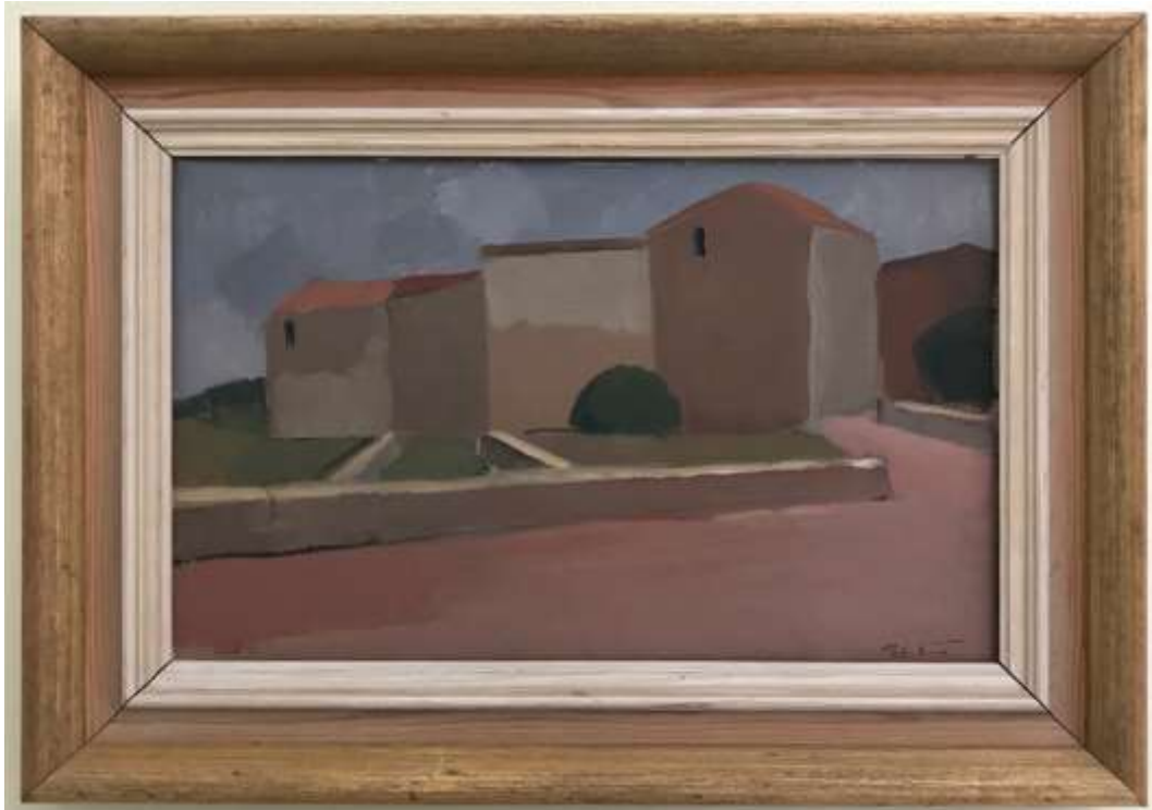
Rolf N-n (Rolf Norrman?), oljemålning