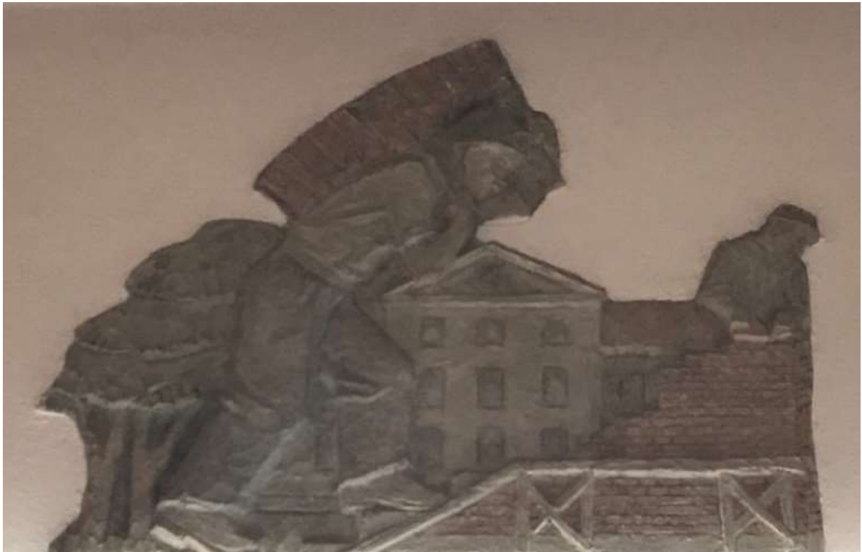
Carl Elmerg, Påbyggnaden av tredje våningen på Tärna Folkhögskola