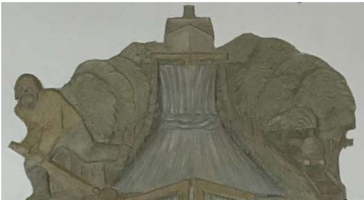
Carl Elmerg, Strömsholms kanal