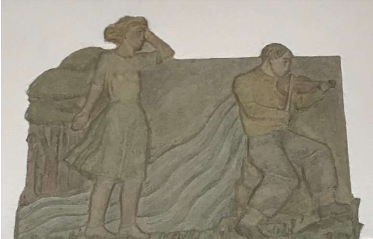
Carl Elmerg, Folkmusiken