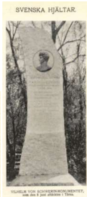
Monumentet avtäcktes den 8 juni 1908.

Vid Tärna folkhögskola af- täcktes under ett ungdomsmöte där den 8 juni ett monument öfver Vilhelm von Schwerin, den unge hjälten från finska kri- get, tillkommet genom direktör T. Holmbergs och fru Cecilia Bååth-Holmbergs åtgöranden. Högtidstalet hölls af landshöf- ding Wersäll. Aftäckningen försiggick under tillslutning af omkring 1800 personer. * * *