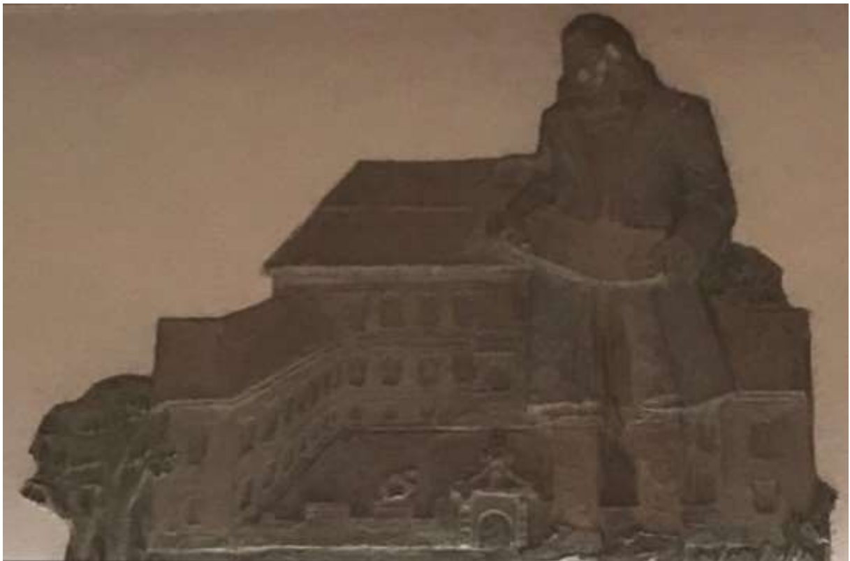
Carl Elmerg, Tidö slott med Axel Oxentierna