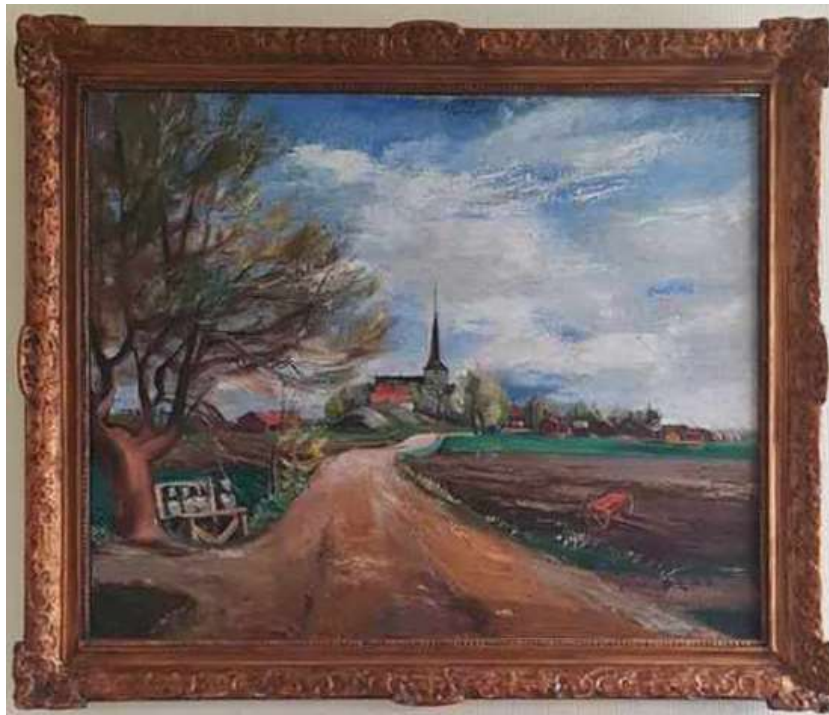
Gunnar Pers, Romfartuna kyrka , oljemålning

En del av övriga konsten på Tärna Folkhögskola: