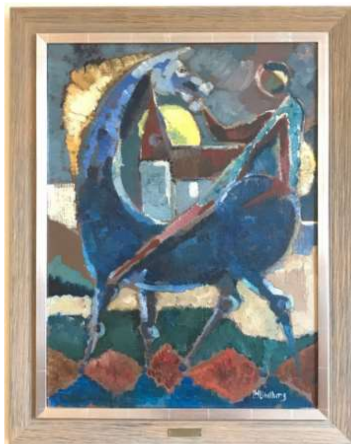
Lennart H Lindberg, oljemålning