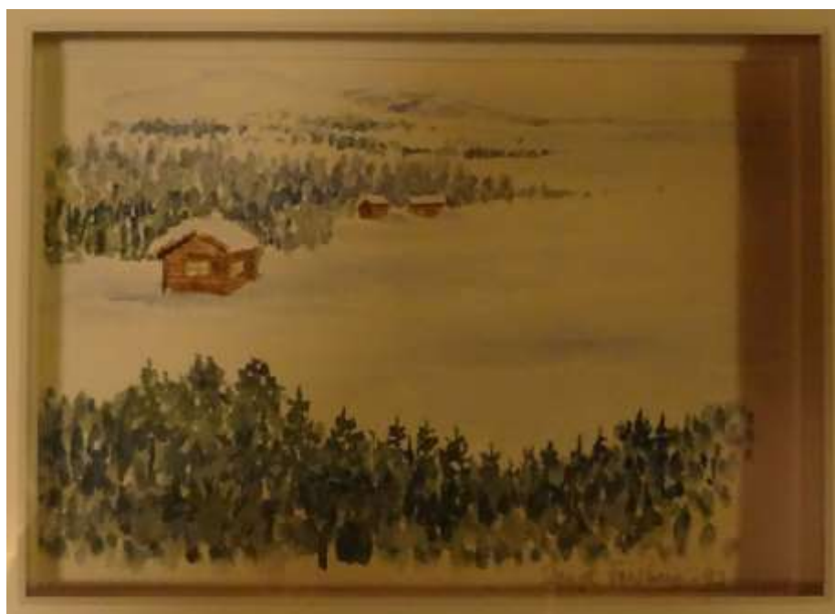
Bengt Forsberg, akvarell 1993, 10 x 15 cm.