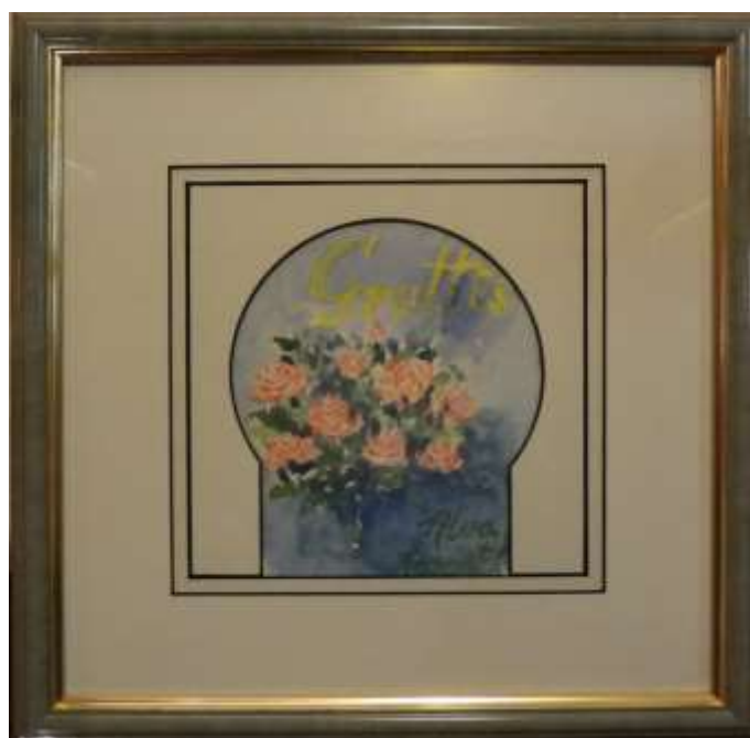
Bengt Forsberg, akvarell, 22,5 x 22,5 cm inkl. passepartout.