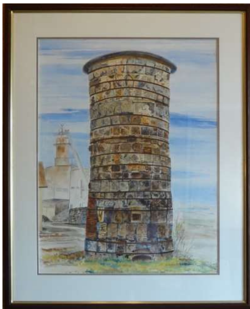
Bengt Forsberg, akvarell 1993, 80 x 60 cm.