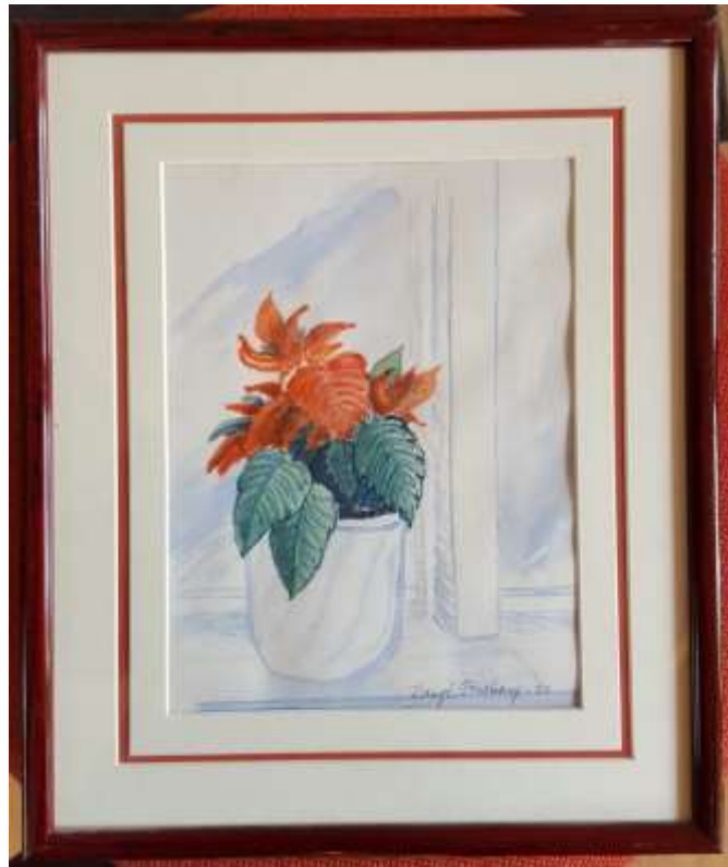
Bengt Forsberg, akvarell 23 x 17 cm. Tillhör Avlidna Salakonstnärers Sällskap