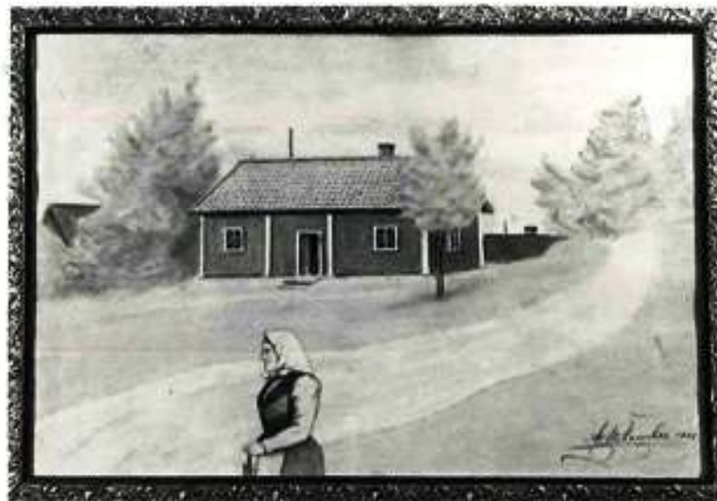
B- 6645 Gruvstugan vid Stampen, Sala