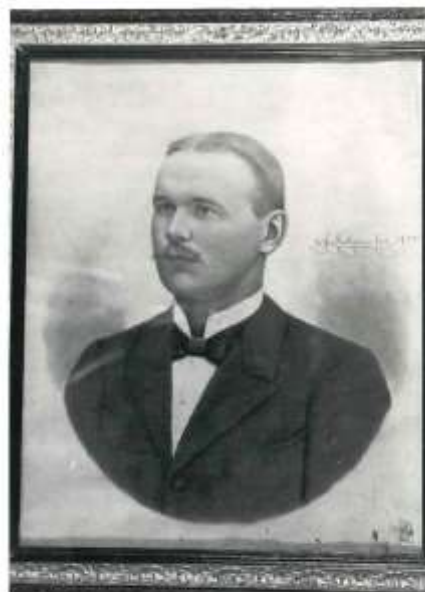
B- 6644 Porträtt Konstnär: Axel Kilander