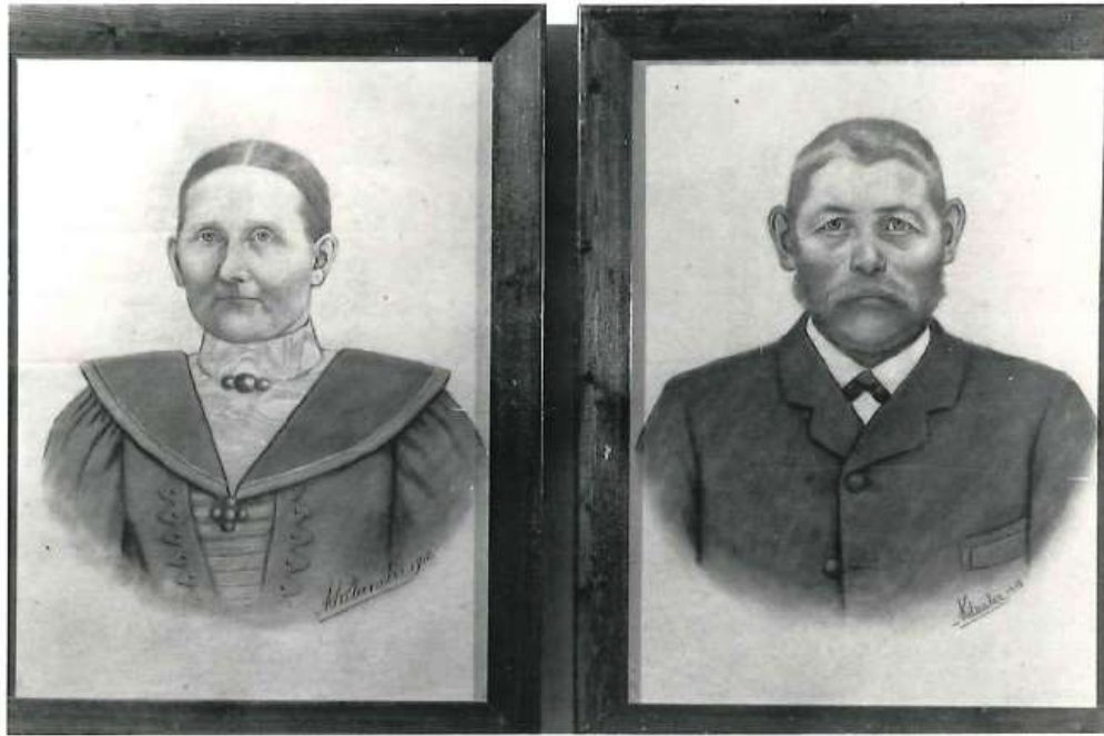
B- 6640 Porträtt Konstnär: Axel Kilander