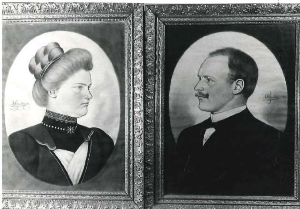
B- 6641 Porträtt Konstnär: Axel Kilander