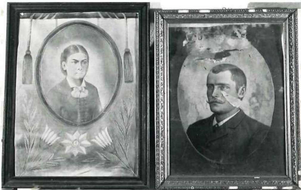
B- 6643 Porträtt Konstnär: Axel Kilander