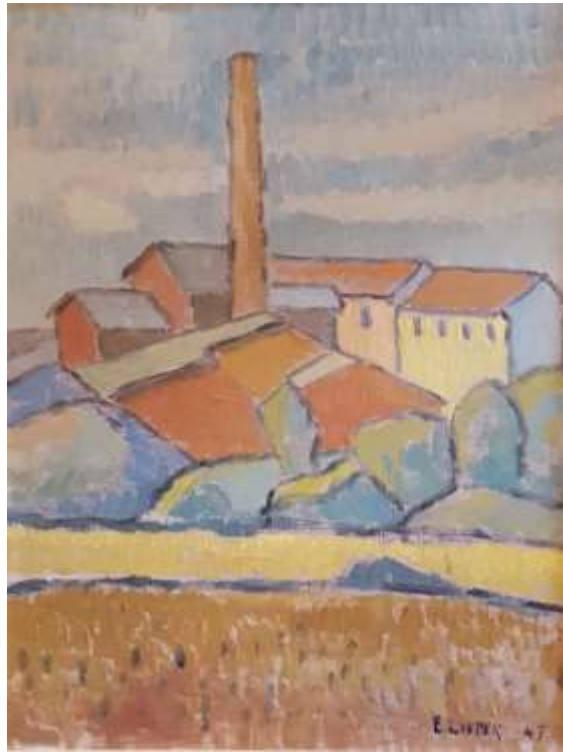
Erik Lisper, Olja 1947, 35 x 27 cm.

Salamotiv? Kan vara skorstenen till Anrikningsverket vid gruvan, enligt Bo Svärd. Någon som vet – maila eller ring i så fall info@salakunst.se eller 076-106 82 20.