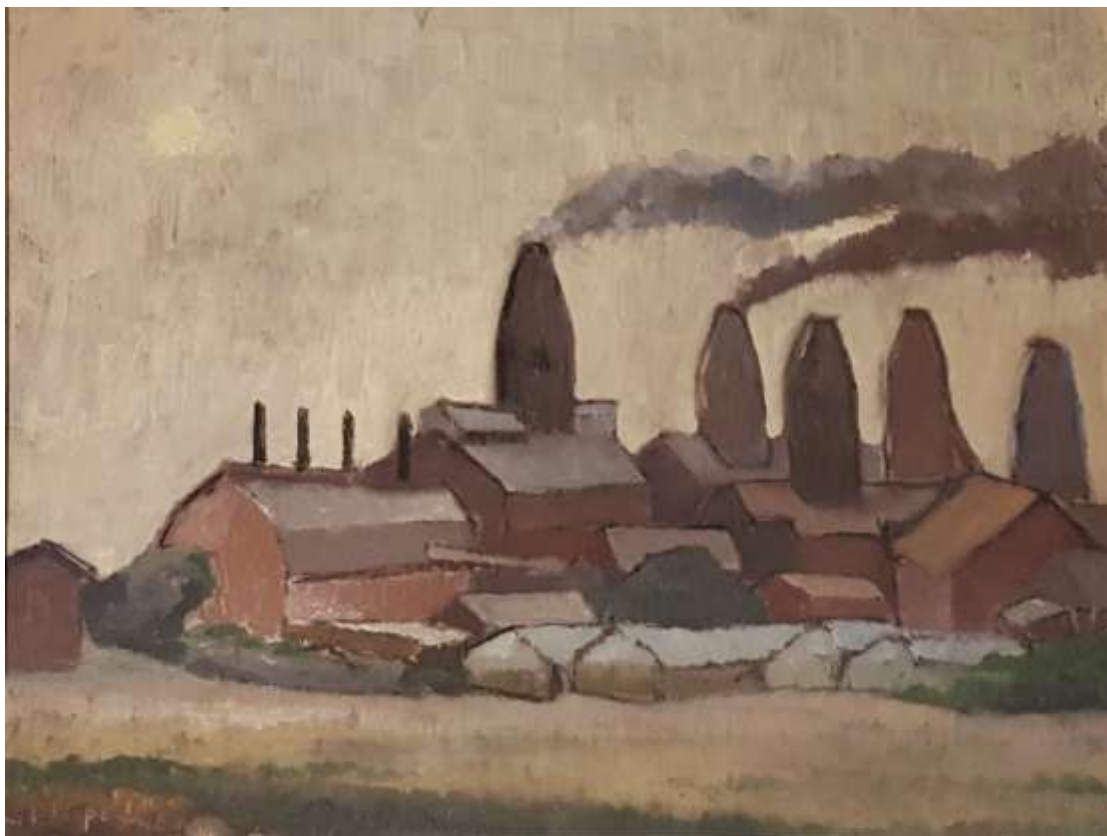
Erik Lisper, Strå kalkbruk . Olja, 27 x 35 cm.

Ingvar Gustavsson: Strå med dolomitugnarna till vänster. Sedan ugnarna nr 3, 4, 5, 6 och 2.