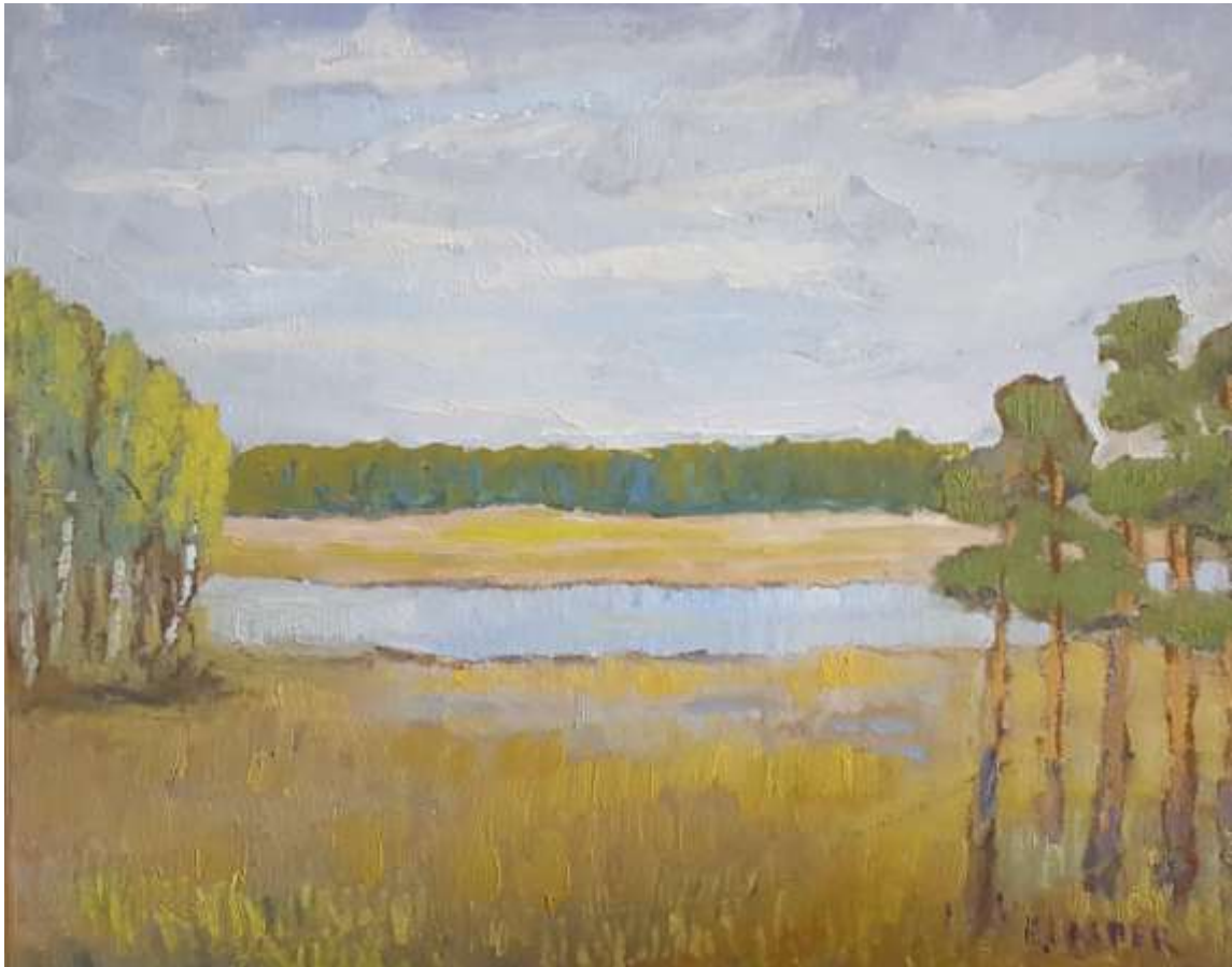
Erik Lisper, Motiv från Ekebyäng Olja, 33 x 41 cm.

Kan möjligen vara Mossviken vid Ekebyäng.