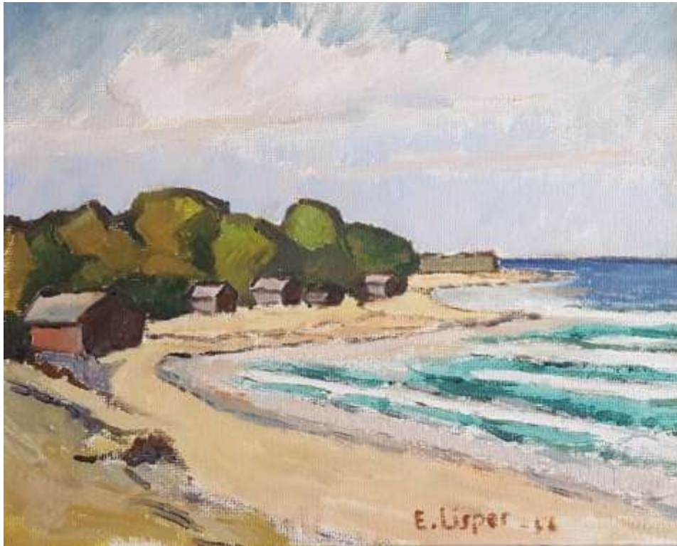
Erik Lisper, Ekeviken Fårö Olja 1956, 33 x 41 cm.

Text på baksidan: Motiv från Ekeviken, Fårön. Gåva till Ungernhjälpen nov. 1956