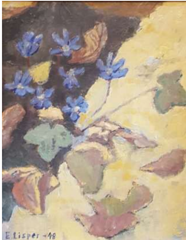
Erik Lisper, Blåsippor Olja 1948, 24 x 19 cm.