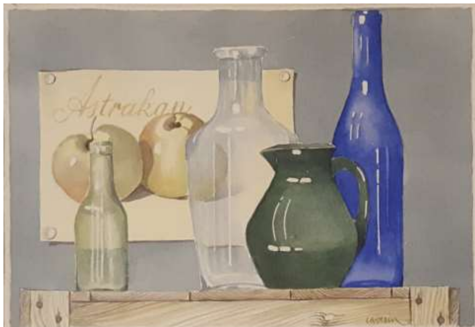
Bengt Caverin, akvarell 22 x 31 cm

Kan möjligen vara Mossviken vid Ekebyäng.