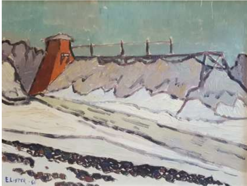
Erik Lisper, Bronäsgruvan Olja 1956, 27 x 35 cm.