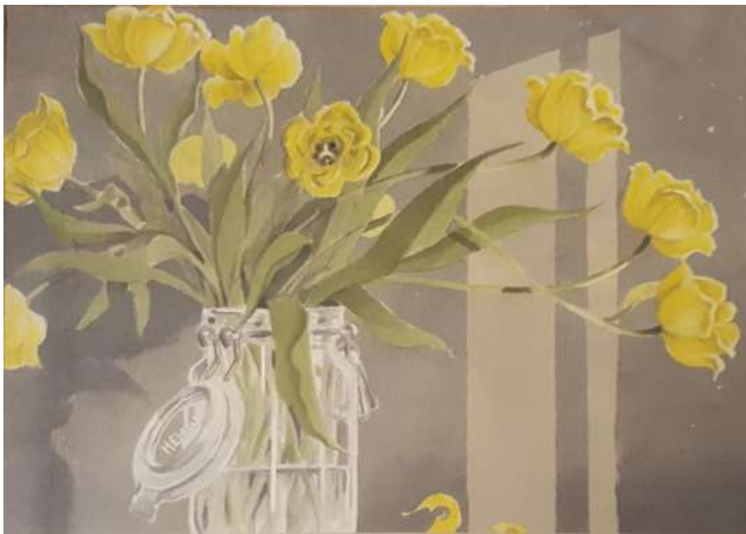
Bengt Caverin, akvarell 29 x 41 cm

Bronäsgruvan var belägen mellan nuvarande uppfarten till gruvan och 'vita stolpen', intill Västeråsvägen.