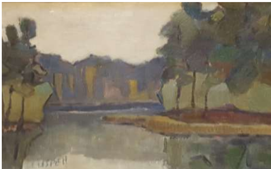
Erik Lisper, Mellandammen Olja, 27 x 33 cm.