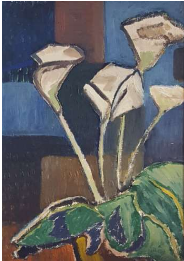
Erik Lisper, Rosenkalla . Olja 1956, 33 x 24 cm.