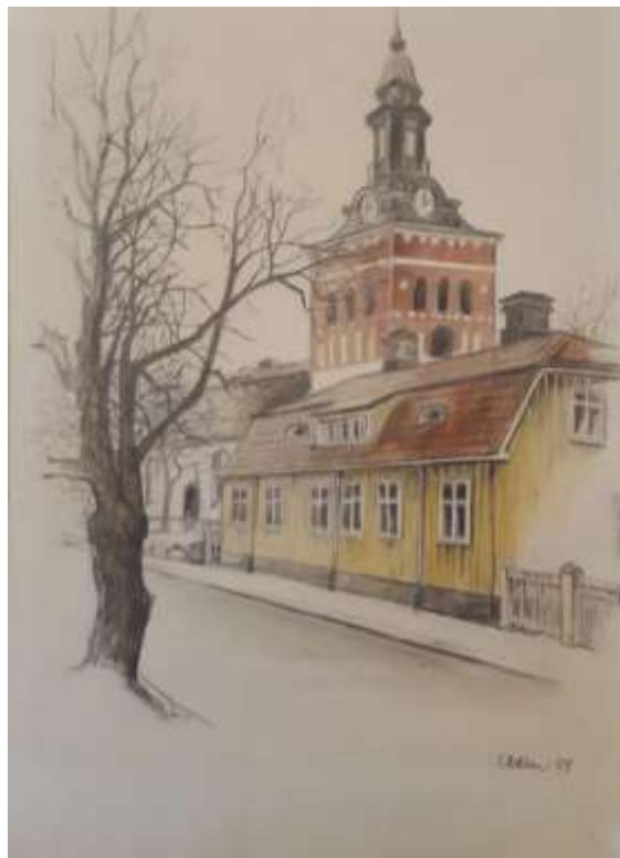
Bengt Caverin, Kristina kyrka , krita 1974, 35 x 25 cm

Gåva 2019 till Avlidna Salakonstnärers Sällskap.