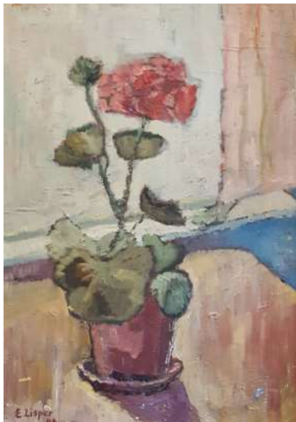
Erik Lisper, Pelargon . Olja 1948, 33 x 24 cm.