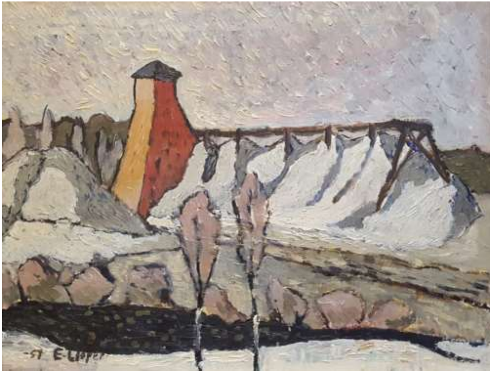
Erik Lisper, Bronäsgruvan Olja 1957, 27 x 35 cm.

Bronäsgruvan var belägen mellan nuvarande uppfarten till gruvan och 'vita stolpen', intill Västeråsvägen.