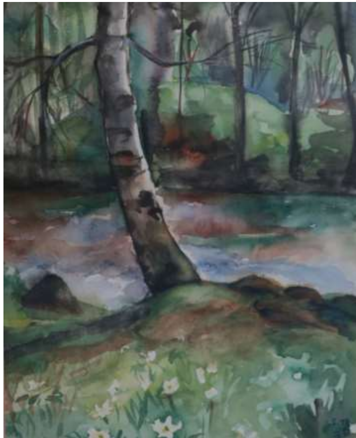
Akvarell 1 maj 1949.