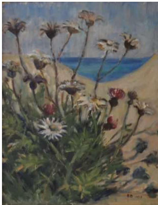
Brita Davidson, olja 1950, 34 x 26 cm.