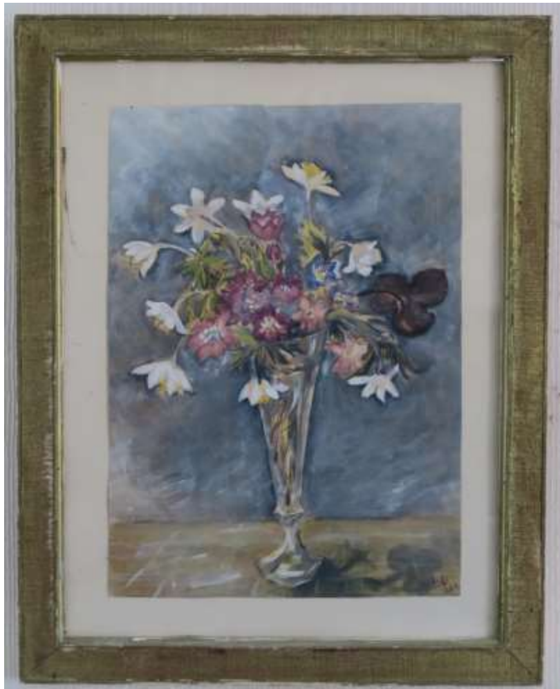
Akvarell 28 april 19??