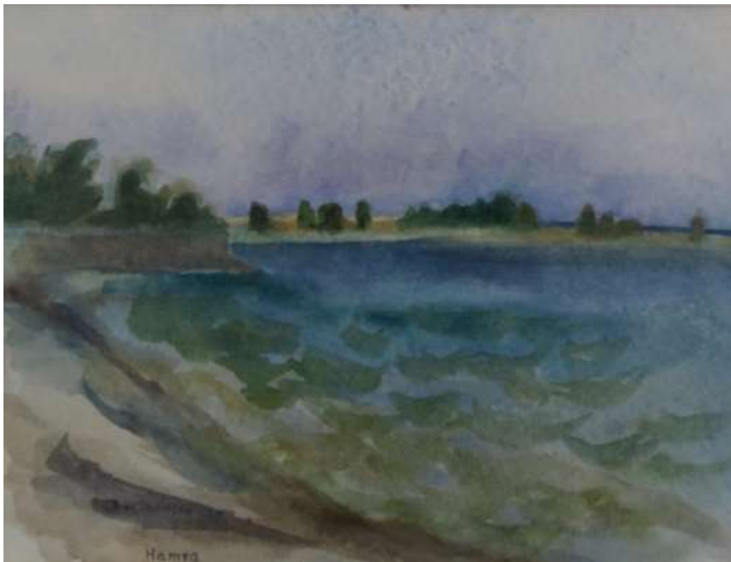
Hamra, akvarell 1969