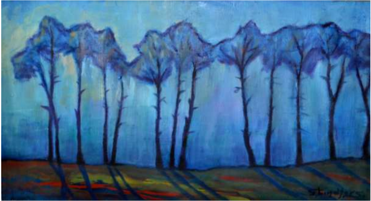
Gustaf Lindfors, Skog i blått , olja 30 x 72 cm.

Målningen finns återgiven under april i vår Konstalmanacka 2022