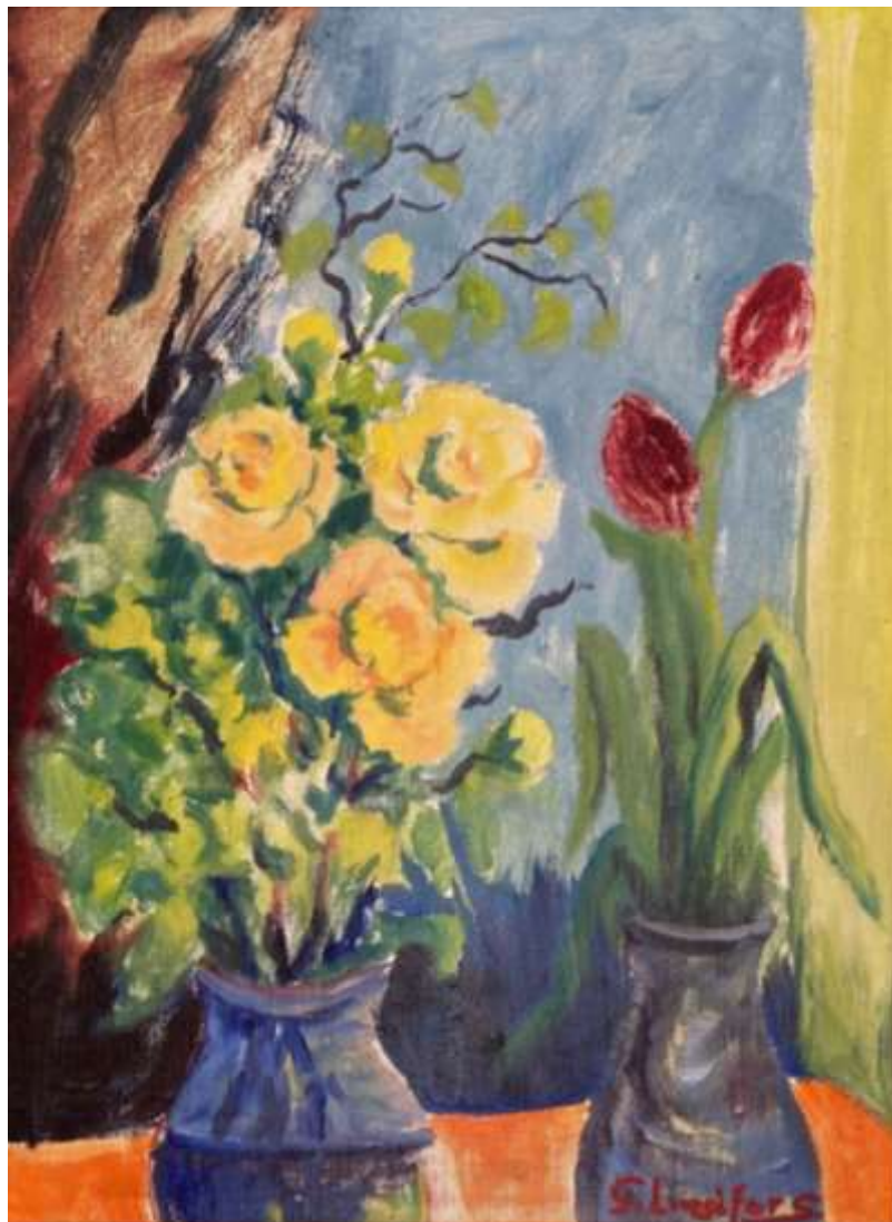
Gustaf Lindfors, oljemålning 75 x 60 cm.