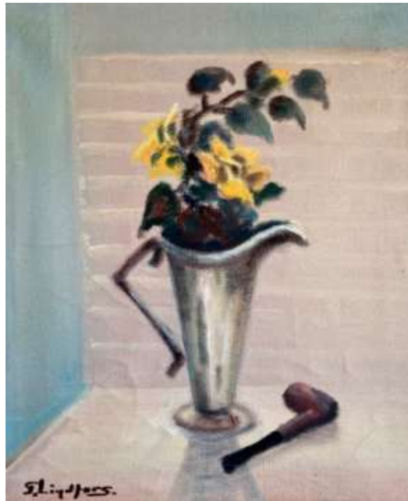
Gustaf Lindfors, oljemålning 70 x 60 cm.