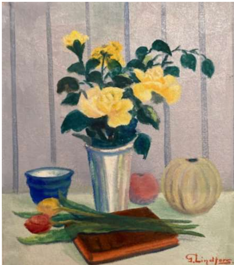
Gustaf Lindfors, oljemålning 60 x 53 cm.