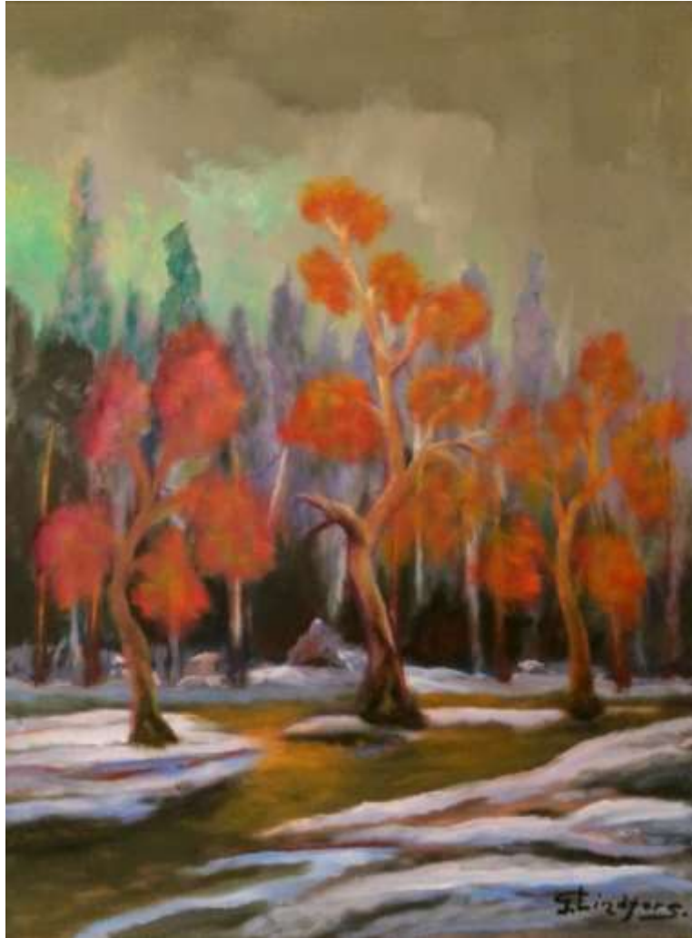
Gustaf Lindfors, oljemålning, 80 x 50 cm.