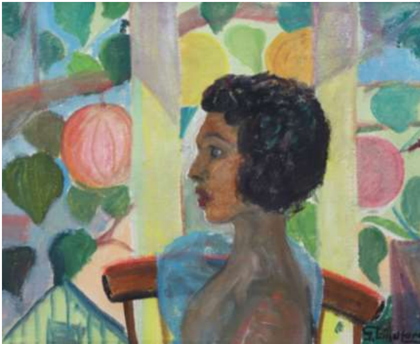
Gustaf Lindfors, oljemålning 50 x 55 cm, Ekenbergs Auktioner.