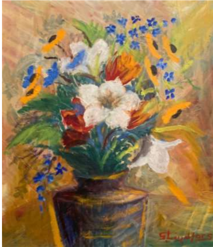
Gustaf Lindfors, oljemålning 52 x 45 cm.