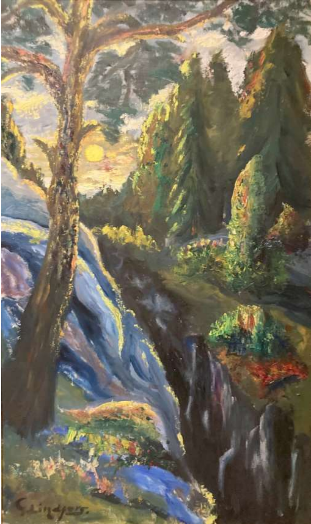
Gustaf Lindfors, oljemålning 100 x 60 cm.