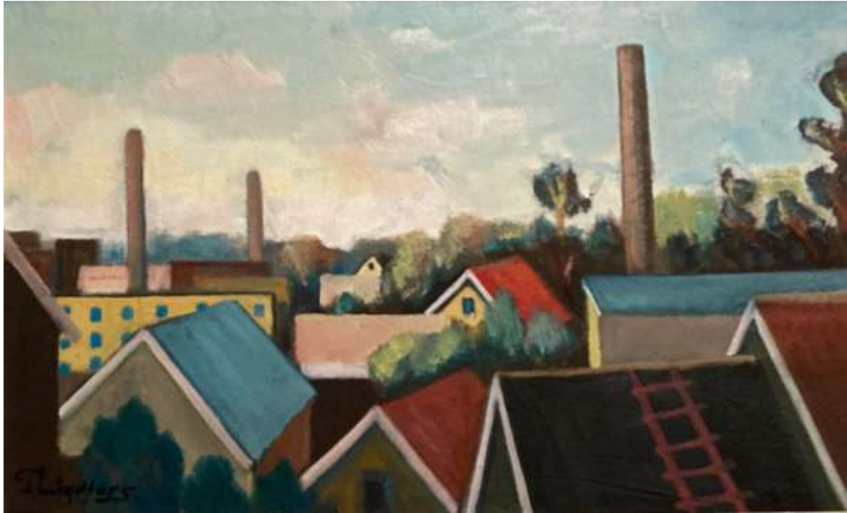
Gustaf Lindfors, oljemålning 37 x 62 cm.