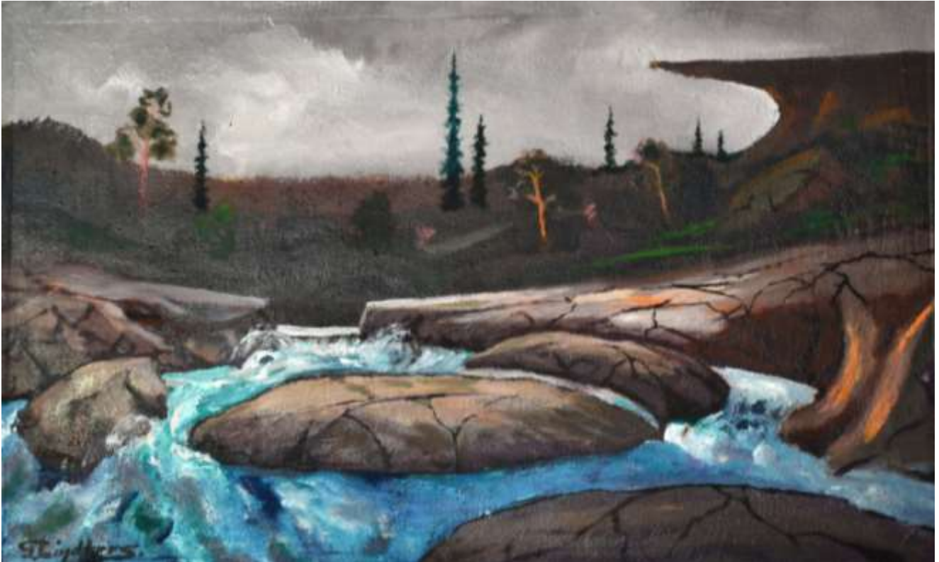
Gustaf Lindfors, Älvmotiv , olja 42 x 70 cm.