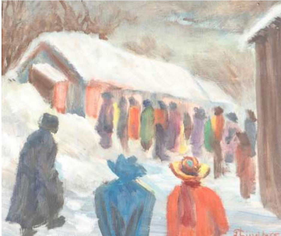
Gustaf Lindfors, oljemålning 42 x 52 cm, Södermanlands Auktionsverk.