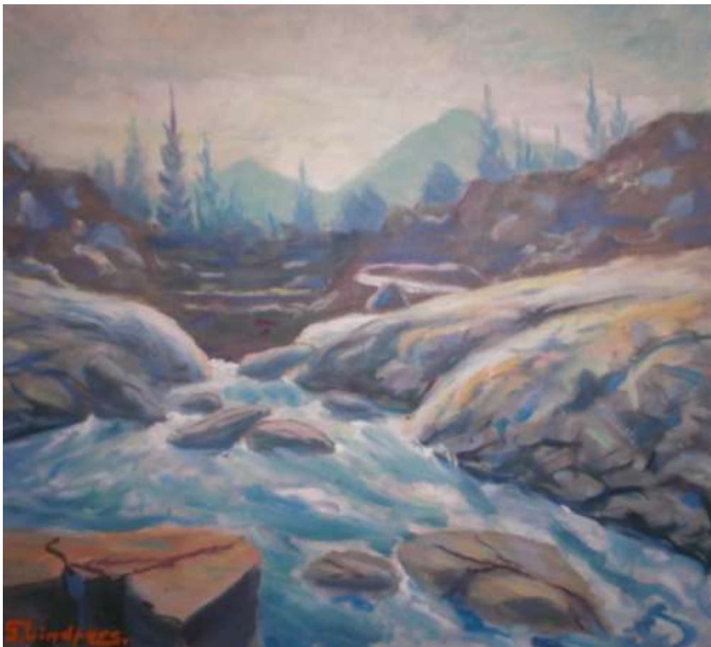
Gustaf Lindfors, oljemålning 53 x 60 cm, Tradera.