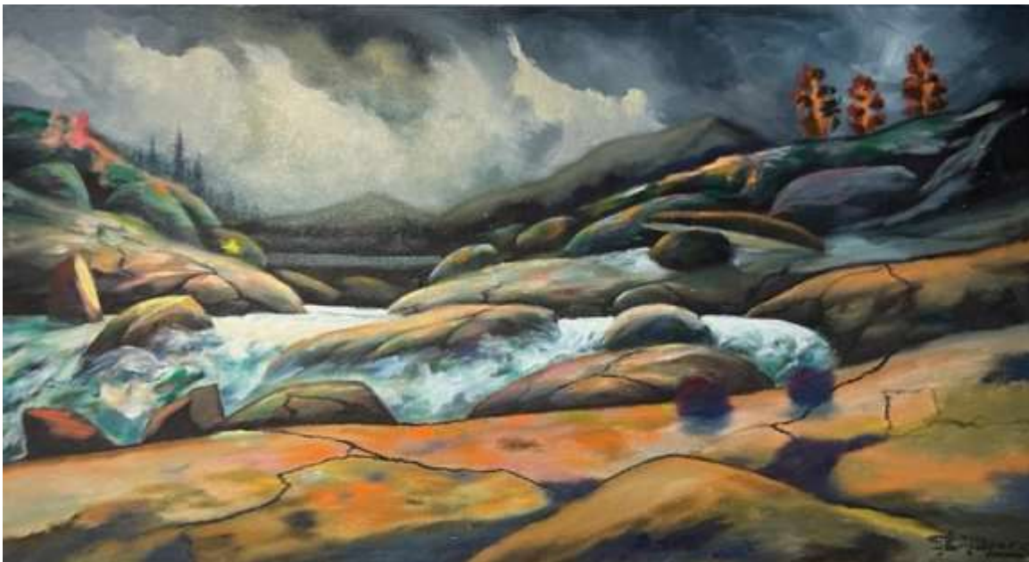
Gustaf Lindfors, oljemålning 70 x 100 cm.