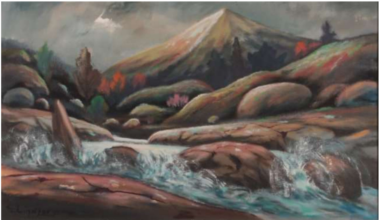
Gustaf Lindfors, oljemålning 42 x 74 cm, Södermanlands Auktionsverk.