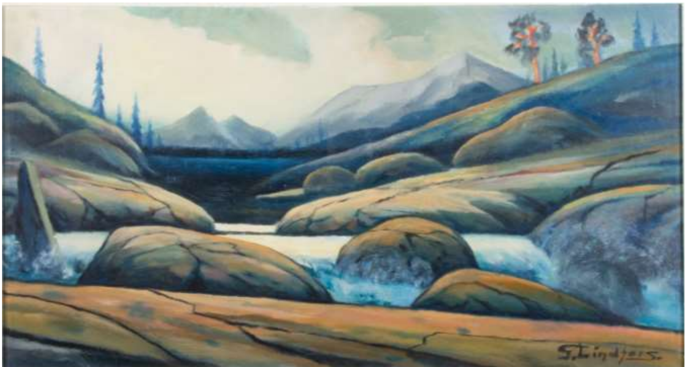
Gustaf Lindfors, Landskap med vattendrag , olja 42 x 78 cm, Auctionet.se.