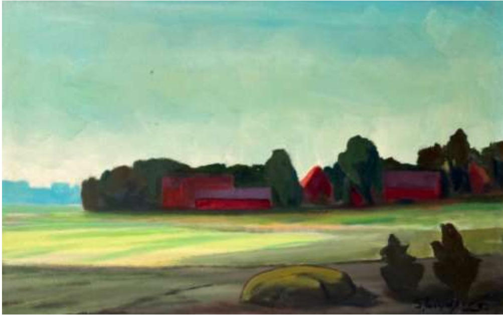
Gustaf Lindfors, oljemålning 40 x 70 cm.