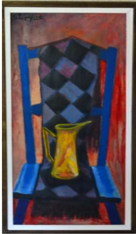
Gustaf Lindfors, Blå stol , olja 71 x 40 cm.