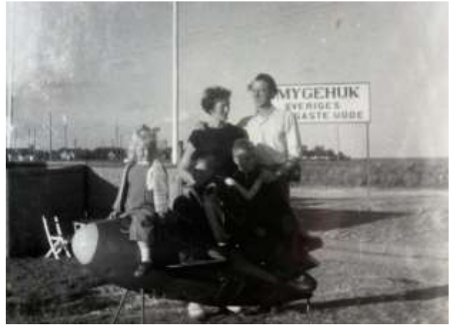
Försäljningsresa i Skåne.

Utställningar hade han och broschyrer om dessa fanns, men dessvärre har jag inga kvar och var utställningarna hölls minns jag inte heller. Kanske var broschyrerna en bra marknadsföringsinsats. (CL)