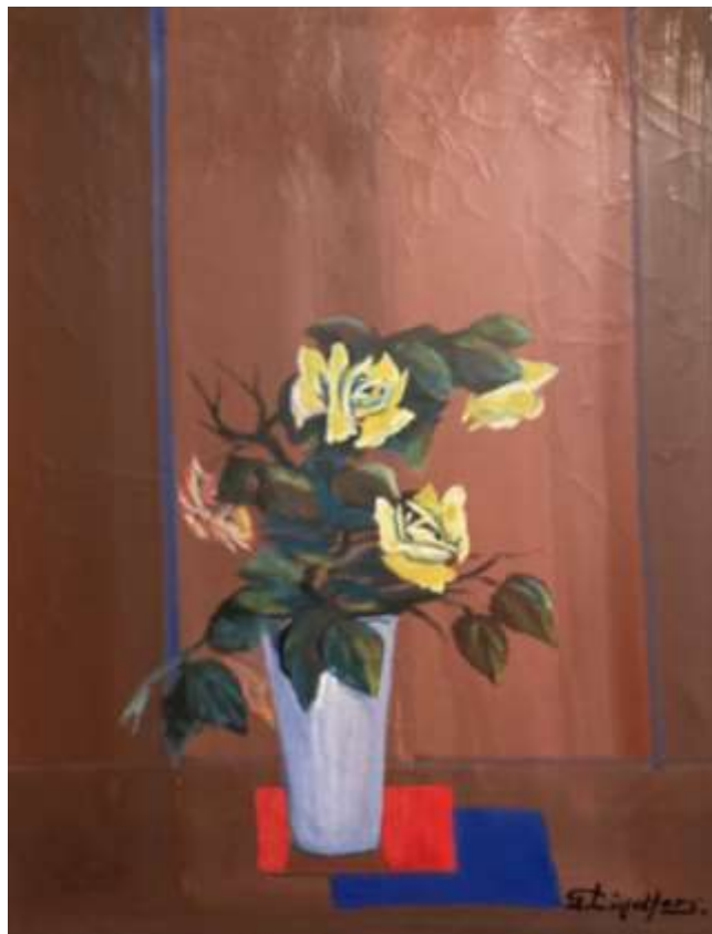
Gustaf Lindfors, oljemålning 62 x 46 cm.