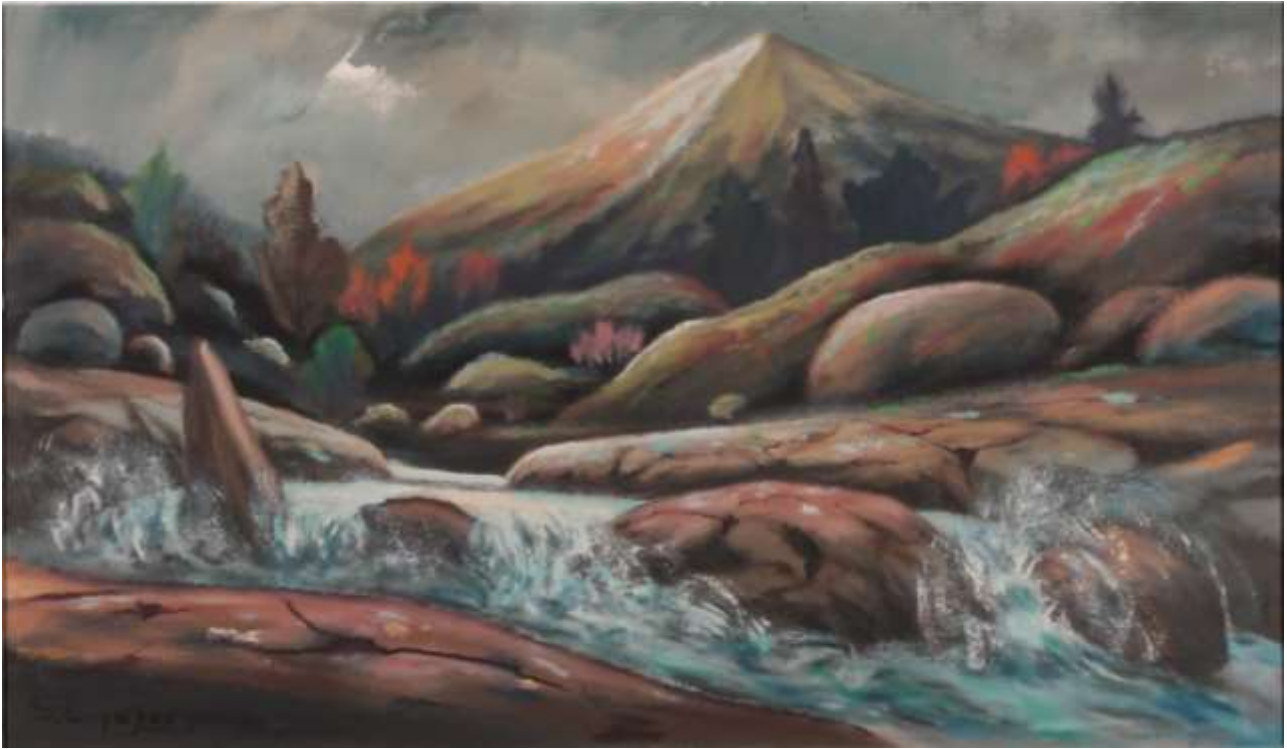
Gustaf Lindfors, olja 43 x 74 cm, Auctionet.se.