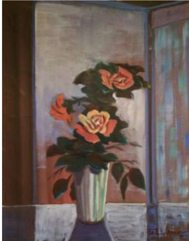
Gustaf Lindfors, oljemålning 58 x 46 cm.