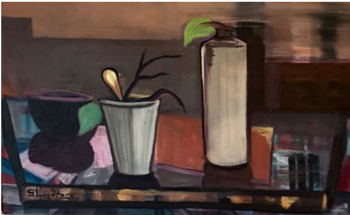
Gustaf Lindfors, oljemålning.