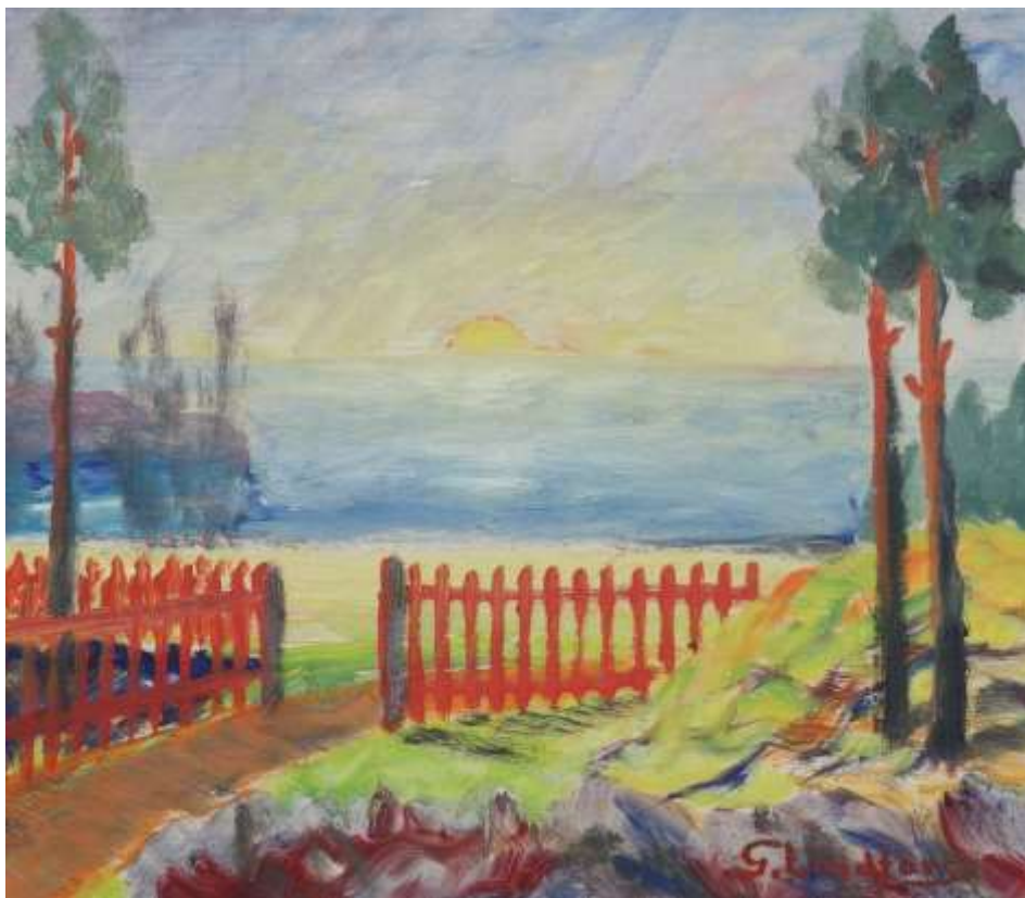
Gustaf Lindfors, oljemålning 39 x 45 cm, Ekenbergs Auktioner.