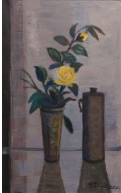
Gustaf Lindfors, Stilleben , olja ca 68 x 43 cm, Auctionet.se.