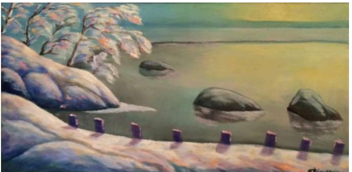
Gustaf Lindfors, oljemålning 35 x 71 cm.