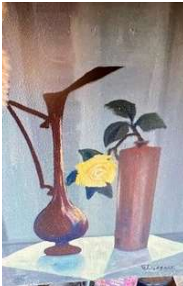
Gustaf Lindfors, oljemålning, 75 x 60 cm.