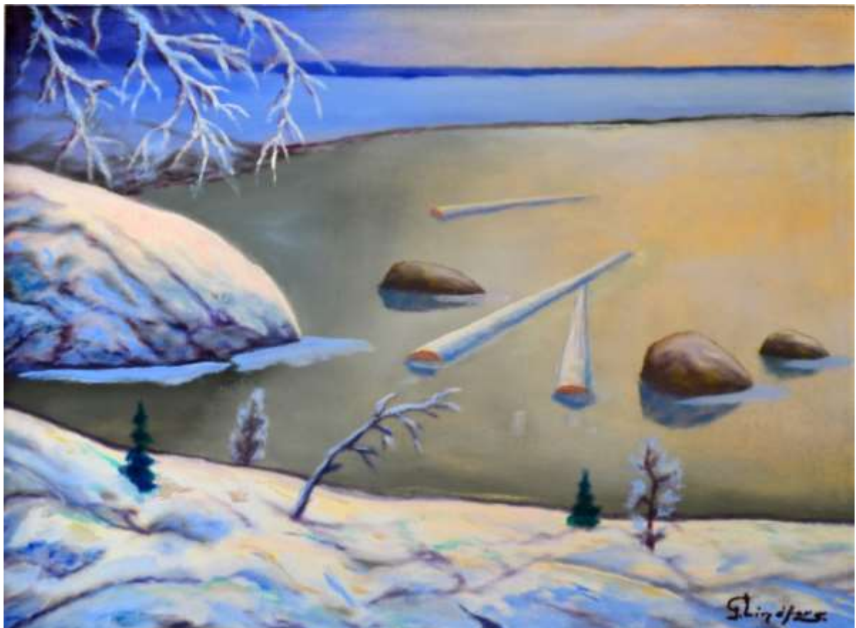
Gustaf Lindfors, Vintermotiv , olja 60 x 80 cm.