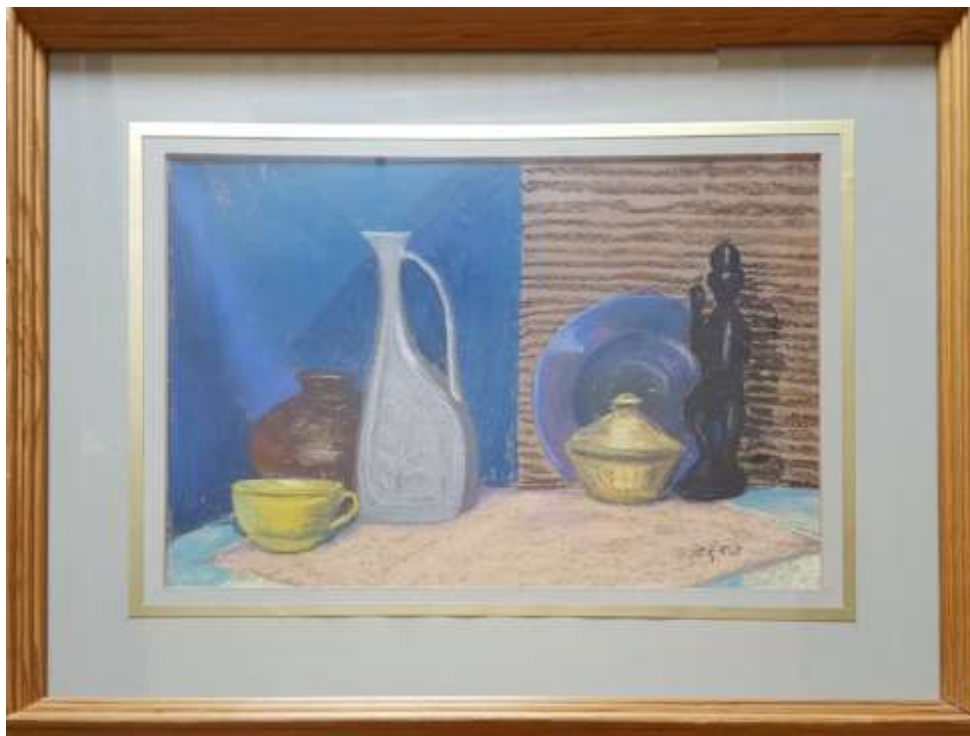
Greta Ringström, pastell 1953, 28 x 39 cm. Gåva till Avlidna Salakonstnärers Sällskap.