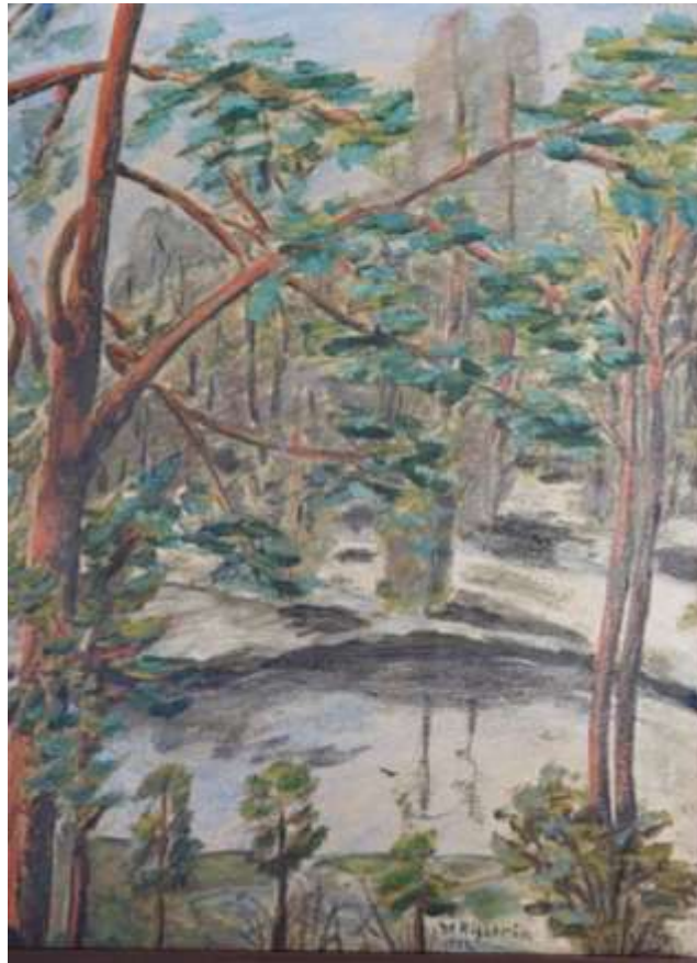
Greta Ringström, oljemålning 1942.