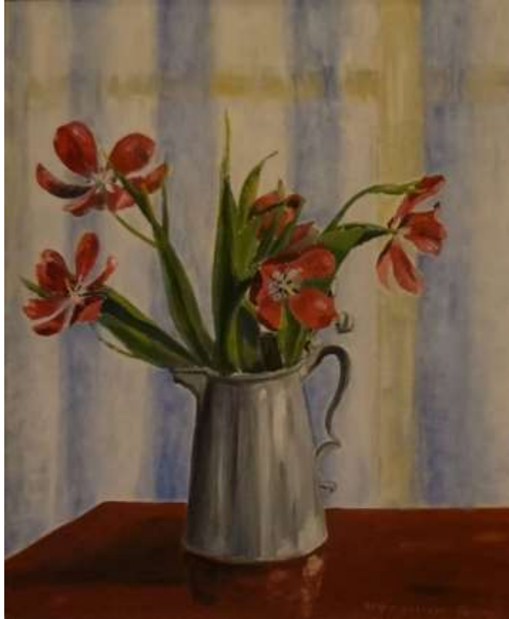
Greta Ringström, oljemålning på pannå 1943, 54 x 45 cm.