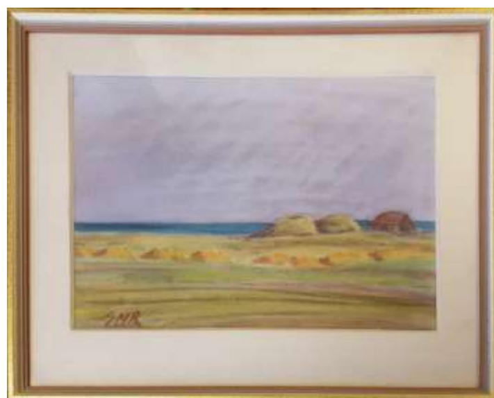
Greta Ringström, pastell 23 x 31 cm.