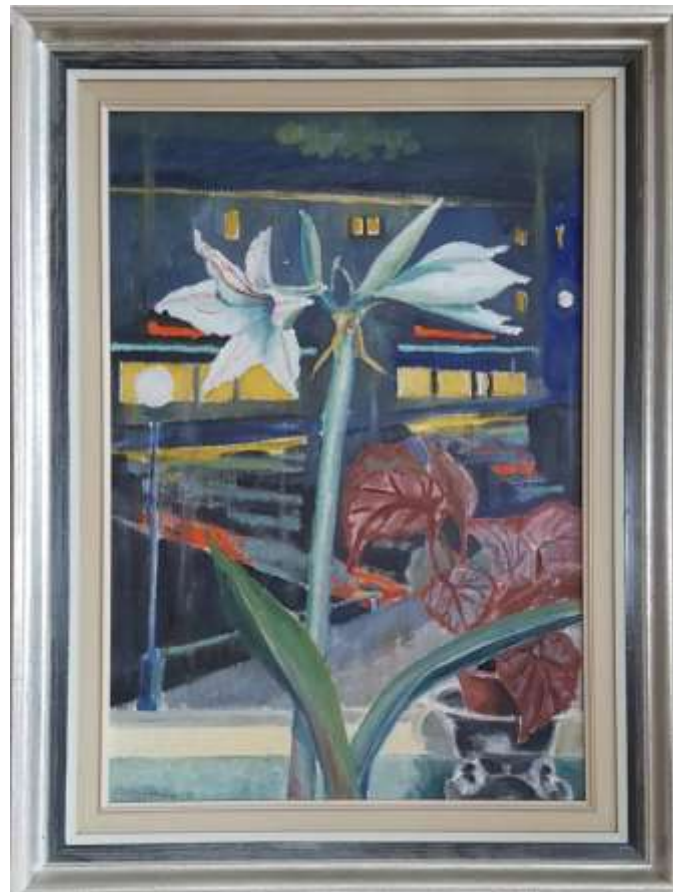
Greta Ringström, Lilja i fönster , olja på pannå 1946, 55 x 38 cm.