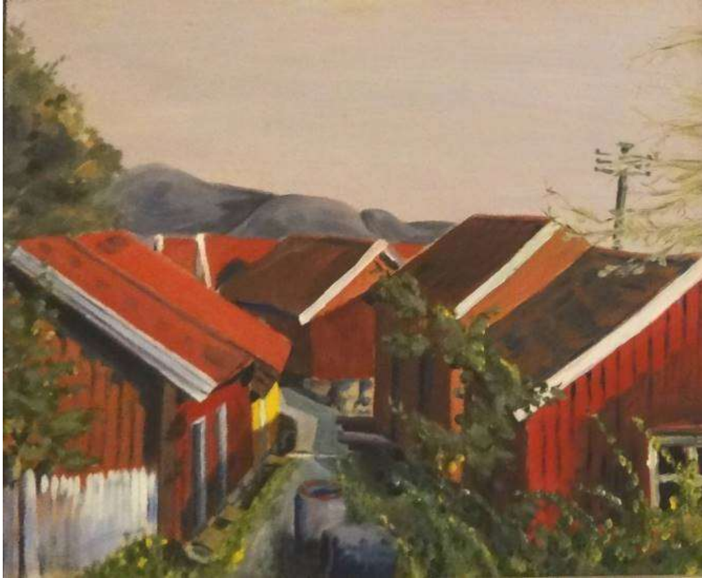
Greta Ringström, Fiskebodas i eftermiddagsbelysning , oljemålning på pannå, 33 x 41 cm.