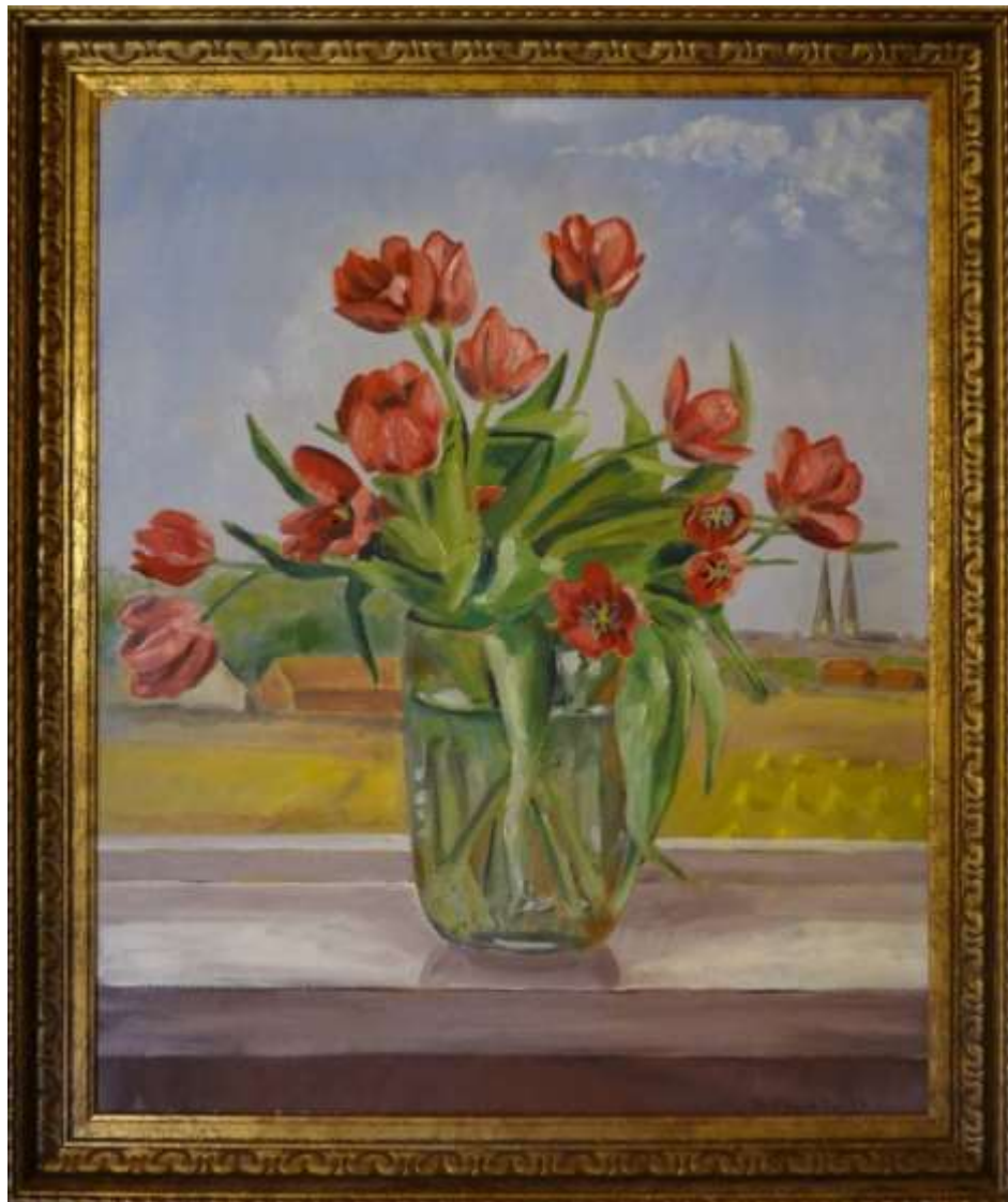
Greta Ringström, oljemålning på pannå 1974, 64 x 53 cm. Sala kommuns samlingar, Jakobsbergsgården.