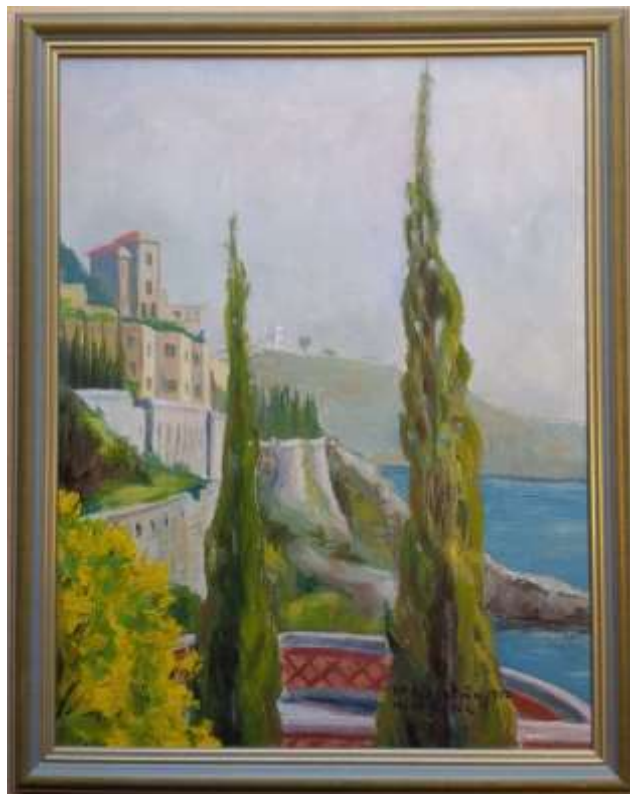
Greta Ringström, olja på pannå 1950, 35x27 cm.