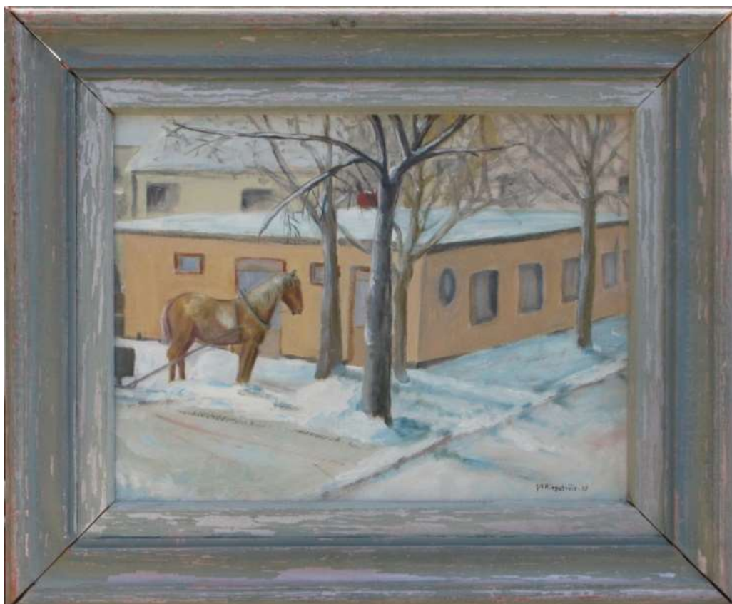
Greta Ringström, Busstationen , oljemålning på pannå 1943, 30 x 40 cm. Utsikt från Ringströms lägenhet.