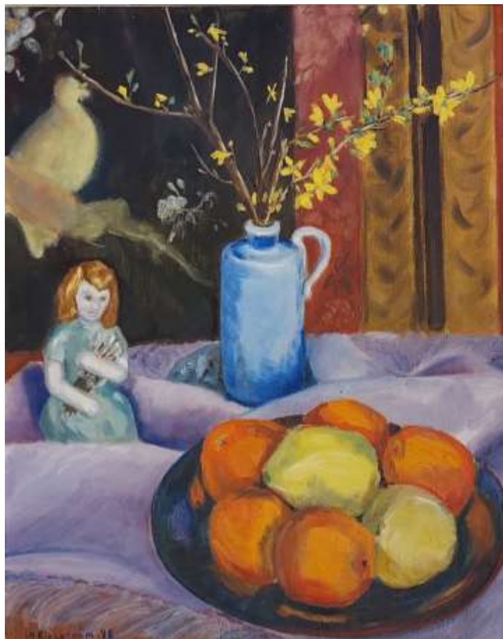
Greta Ringström, oljemålning 1948, 41 x 34 cm. Tillhör Avlidna Salakonstnärers Sällskap.