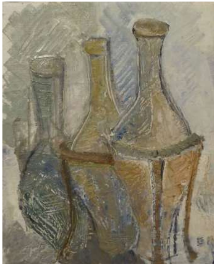
Greta Ringström, oljemålning på duk, 36 x 29 cm.