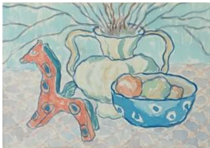
Henry Johag, Röd häst , akvarell 23 x 33 cm.