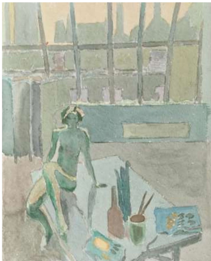
Henry Johag, akvarell 41 x 33 cm.

Akvarellen fortfarande (2022) kvar i ett block. Troligtvis en studie/kopiering av en målning av en mera känd konstnär.