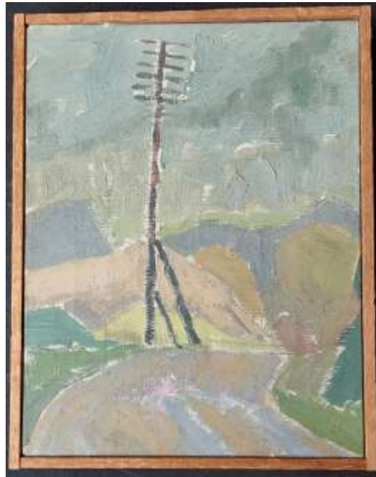
Henry Johag, oljemålning 35 x 27 cm.