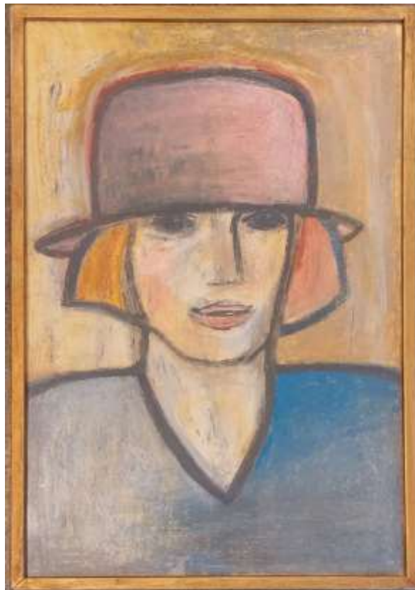
Lilian Ericson, Dam med rosa hatt , oljepastellkrita 1992, 58 x 38 cm.