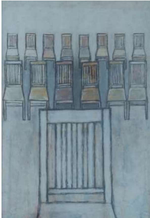
Lilian Ericson, Instolation , oljepastellkrita 57 x 37 cm.