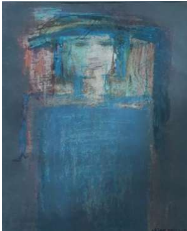
Lilian Ericson, oljepastellkrita 48 x 37 cm.