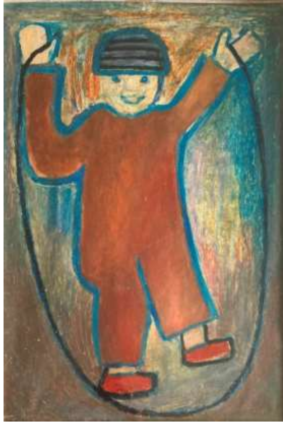
Lilian Ericson, Framtidshopp , oljepastellkrita.