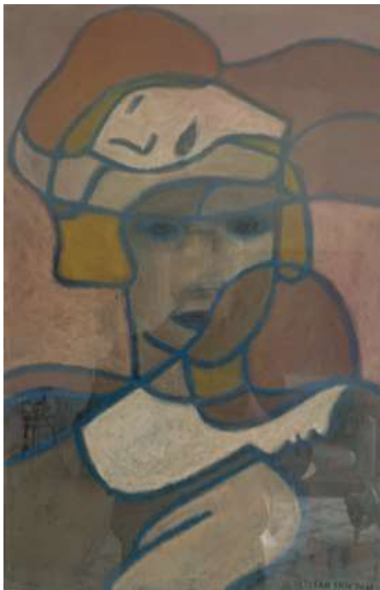
(reflexer i glaset)