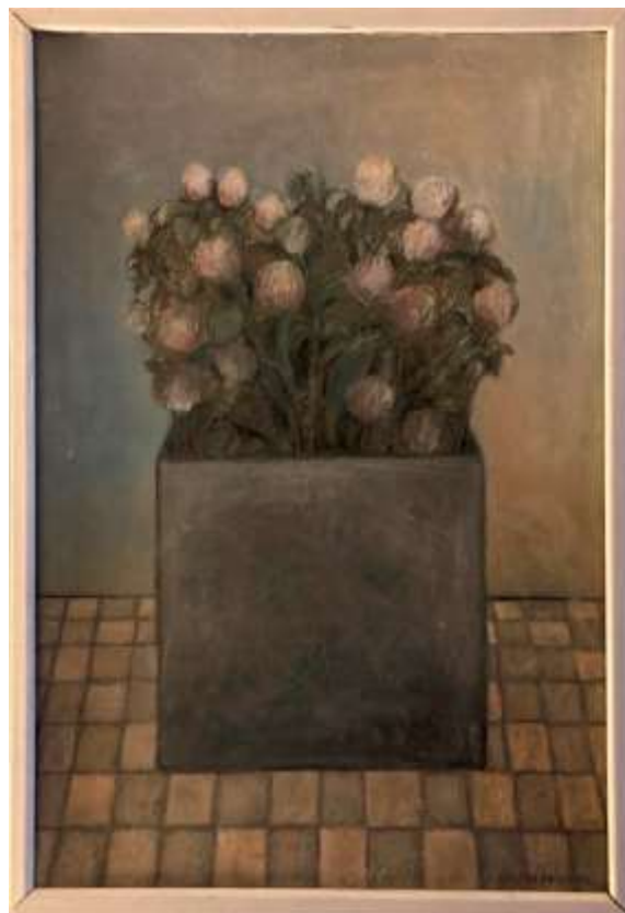
Lilian Ericson, Rödklöver i en plåtask , oljepastellkrita.