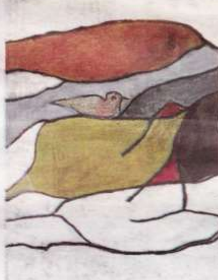
"Hon sa ofta att hon inte ångrade sitt yrkesval även om hon ibland fick välja mellan att köpa ost eller färg".