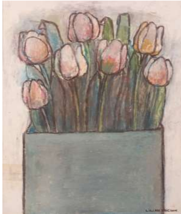
Lilian Ericson, Tulpaner , oljepastellkrita 1997, 50 x 40 cm.