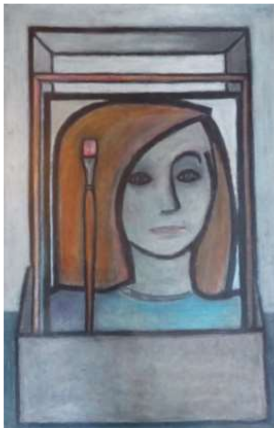
Lilian Ericson, Målarlådan , oljepastellkrita 1990, 57 x 37 cm.