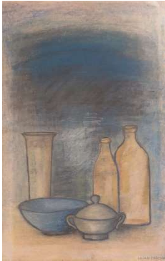
Lilian Ericson, Samling , oljepastellkrita 1987, 58 x 38 cm.