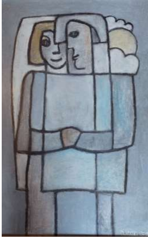
Lilian Ericson, Nära relation , oljepastellkrita 1990, 57 x 37 cm.