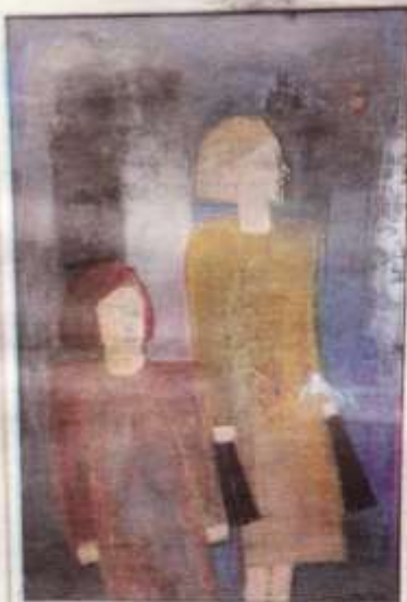
Tavla målad av Lilian Ericson. Oljekrita var en ofta använd metod.