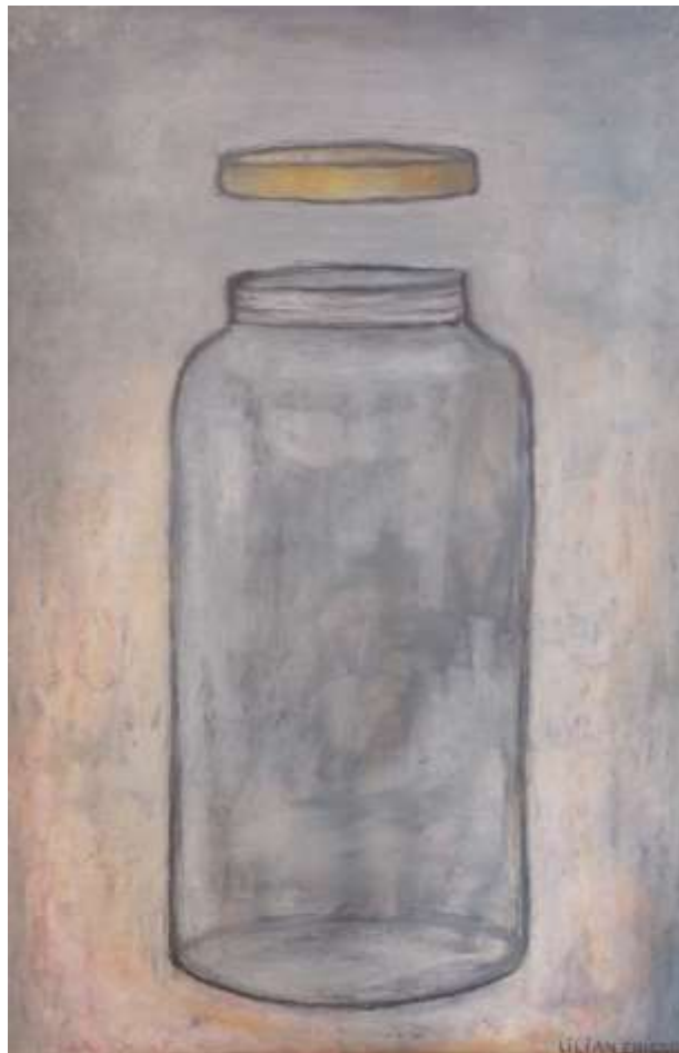
Lilian Ericson, Locket en gloria , oljepastellkrita 58 x 38 cm.