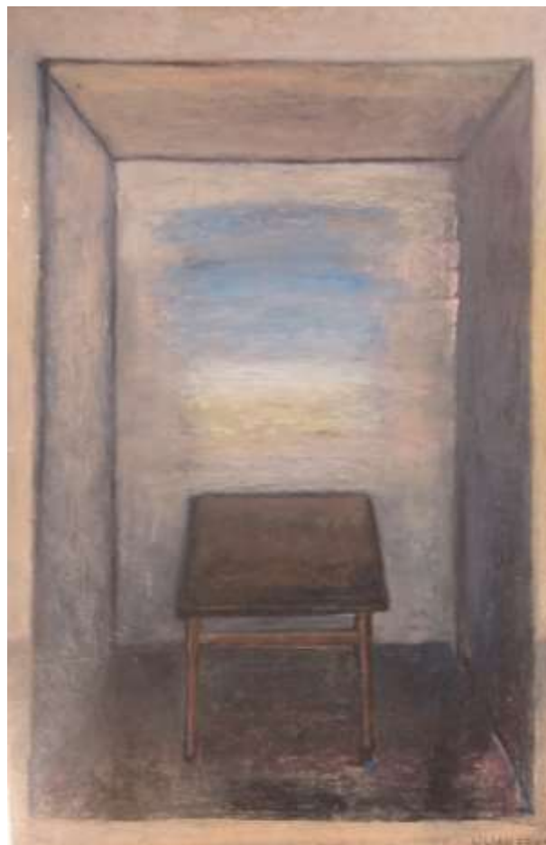
Lilian Ericson, Utan titel , oljepastellkrita 58 x 38 cm.