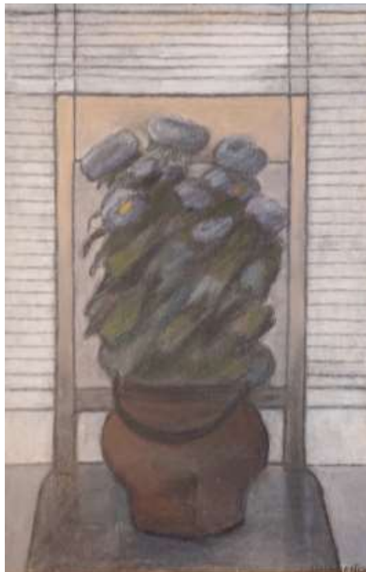
Lilian Ericson, Höst , oljepastellkrita 1989, 58 x 38 cm.