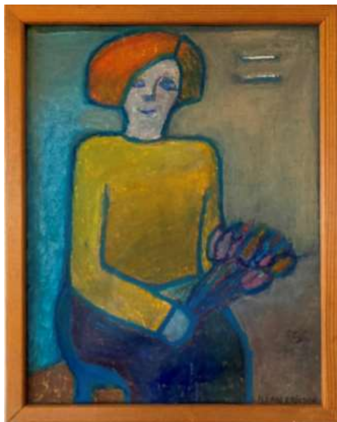
Lilian Ericson, Uppvakningen , oljepastellkrita.