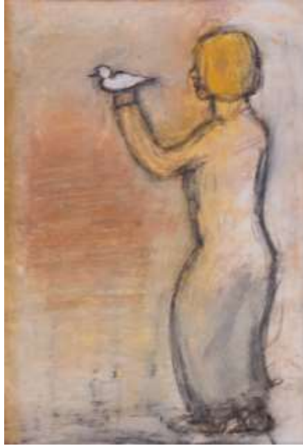
Lilian Ericson, Fri såsom en fågel , oljepastellkrita.