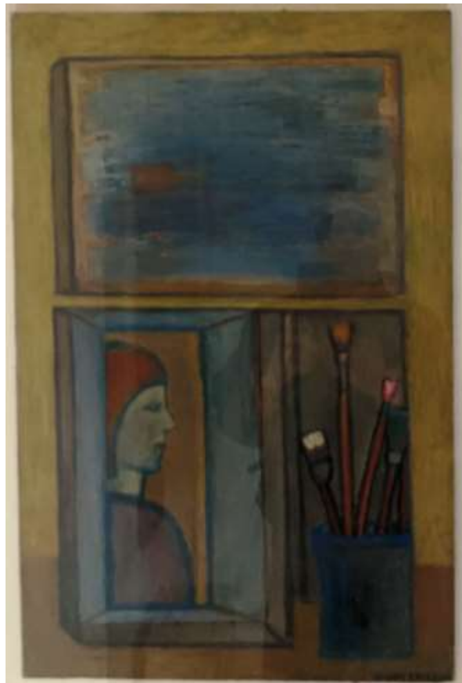
(reflexer i glaset)