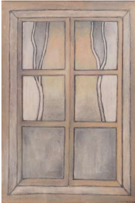
Lilian Ericson, Att våga eller inte våga se , oljepastellkrita 1990, 58 x 38 cm.