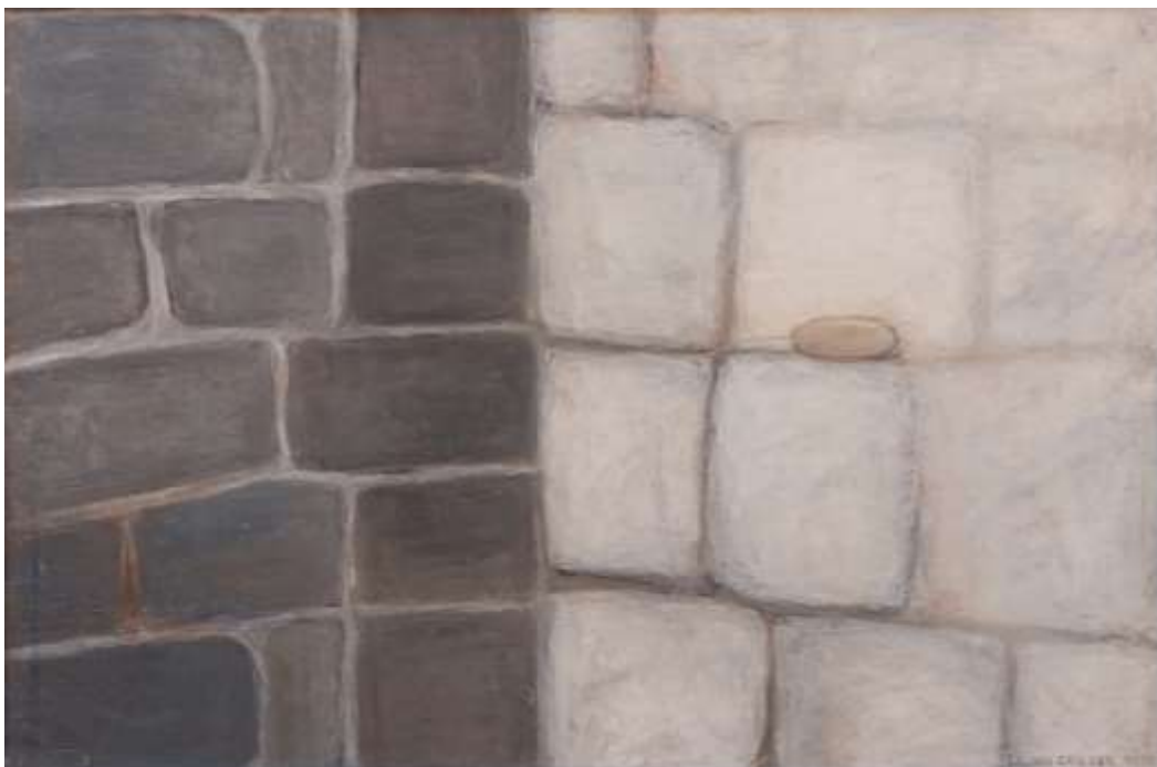
Lilian Ericson, Liten fri , oljepastellkrita 1997, 38 x 58 cm.