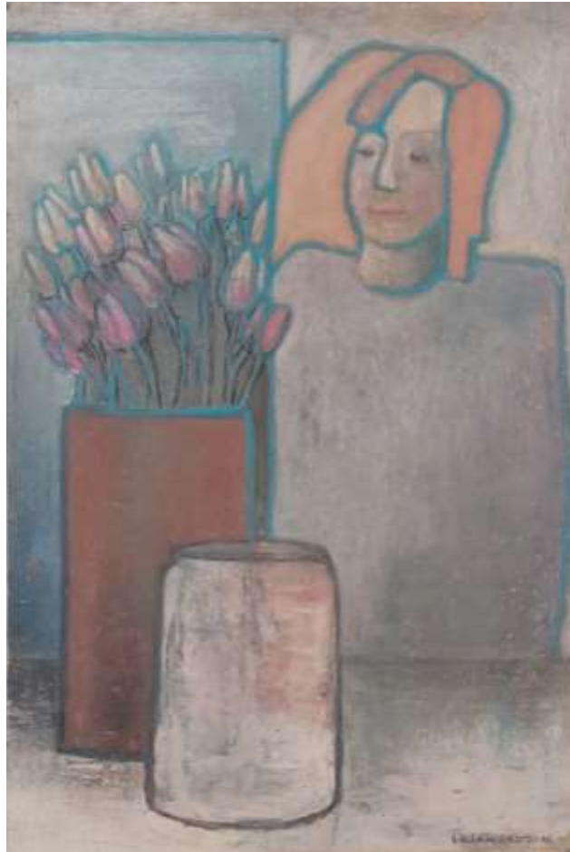
Lilian Ericson, Uppvaktning , oljepastellkrita 1993, 58 x 38 cm.