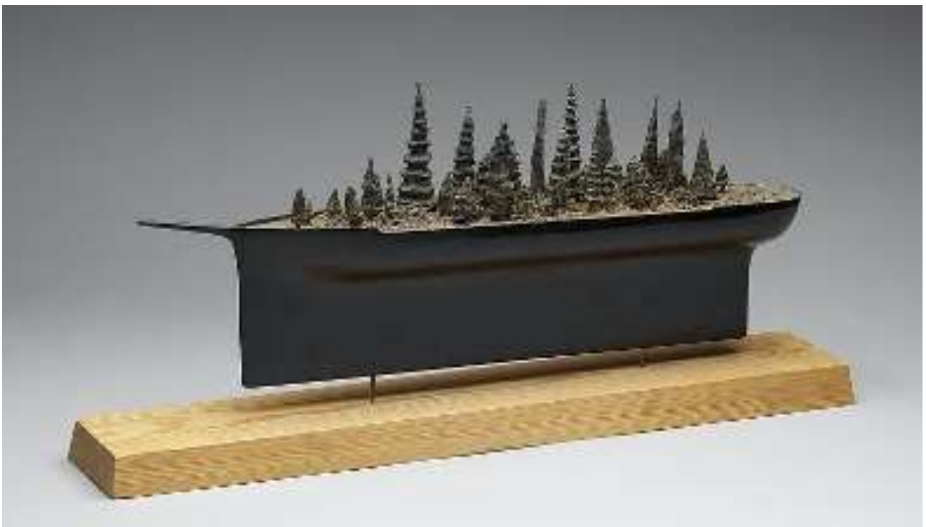
Ronny Aldehag, Båten , blandteknik 1974, 4 x 12 x 69 cm. Moderna Museet (NMSK 2186)