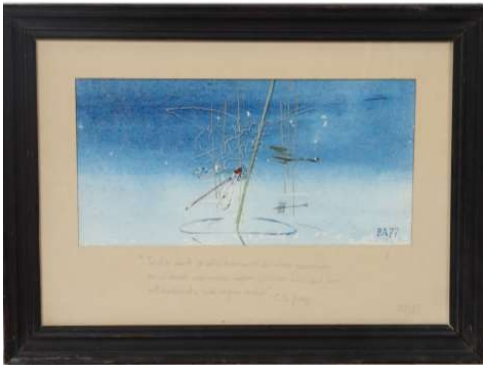
Ronny Aldehag, Komposition , blandteknik 1977, 30 x 40 cm inkl ram.