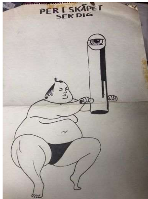
Kerstin Segerfeldt: På 1970-talet illustrerade han en tid kåserier och texter i Hemmets Journal, med bl.a. den här teckningen av Per i Skåpet.