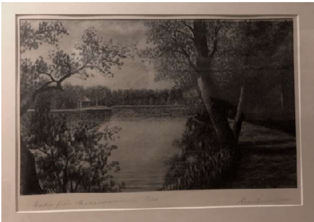
Arvid Andersson, Motiv från Xxxxdammen , teckning.