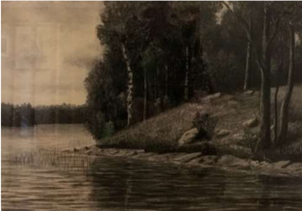
Arvid Andersson, Granudden vid Sandviksbadet , teckning 21 x 30 cm. (reflexer i glaset)