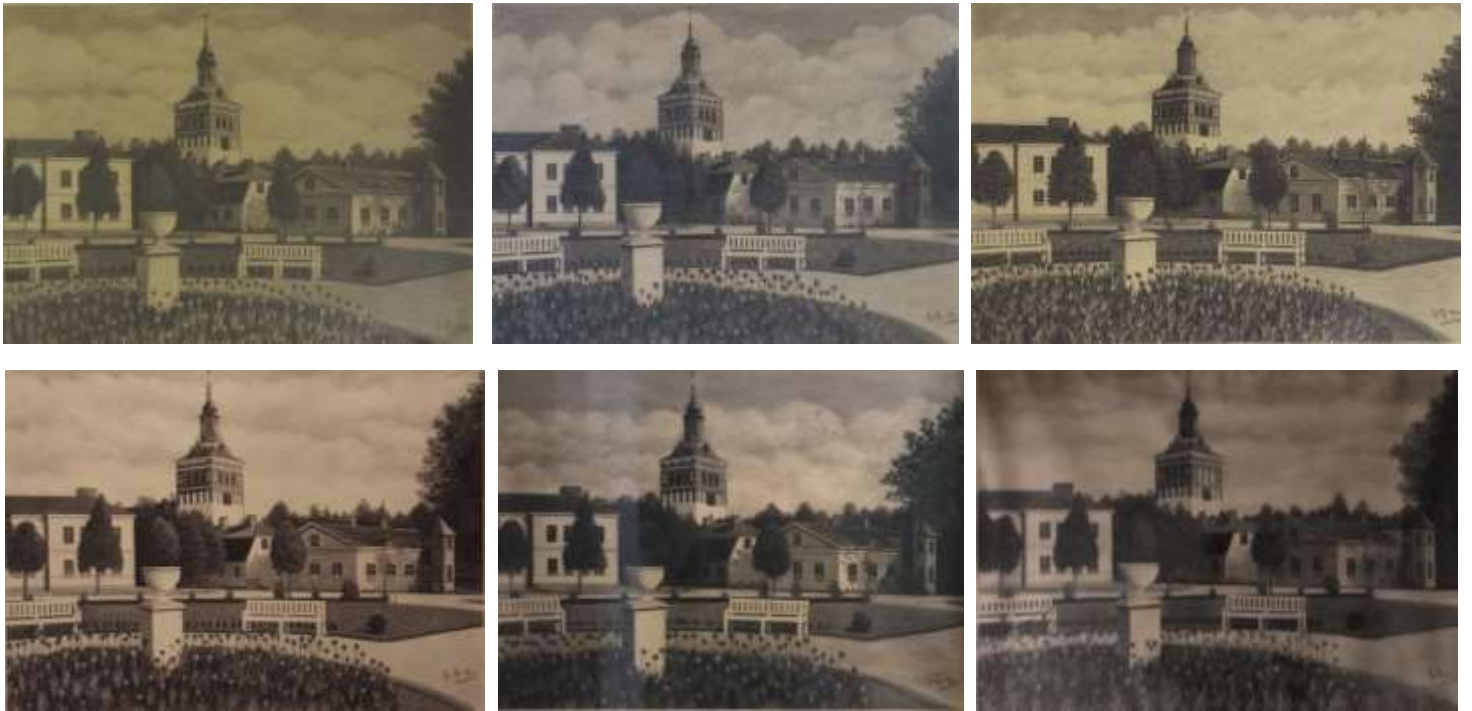
Arvid Andersson, teckningar ca 37 x 51 cm.

De sex nästan identiska teckningarna föreställande läroverket, Kristina kyrka och Västra småskolan. De skiljer sig åt bland annat i moln, lövverk, tulpaner och skuggningar, så det är inte fråga om några tryck. Storleken och inramningen är lika för alla sex: