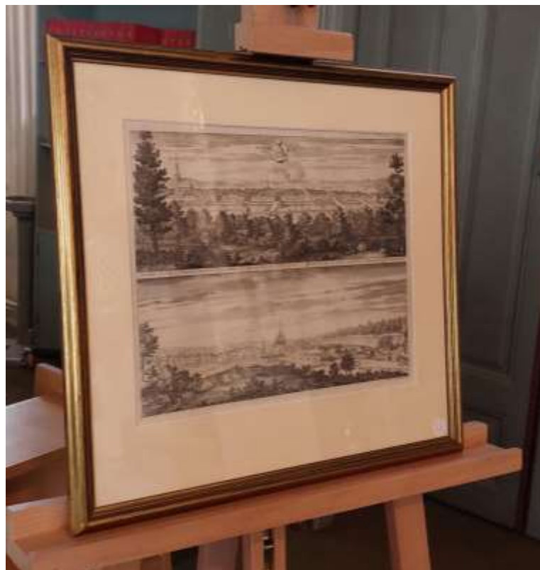
11. Sala stad (den översta bilden). Konstnär: Erik Dahlberg. Daterat ca 1702. Inköpt av Bo Svärd. Inlämnad av Mats G Beckman.