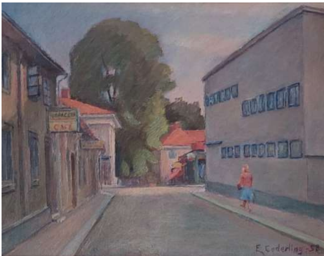
9. Titel saknas. Föreställer vy över Borgmästaregatan, bort mot Kungsgatan. konstnär: Edvard Cederling. Köpt i antikhandel. Utlånad av Mats G Beckman