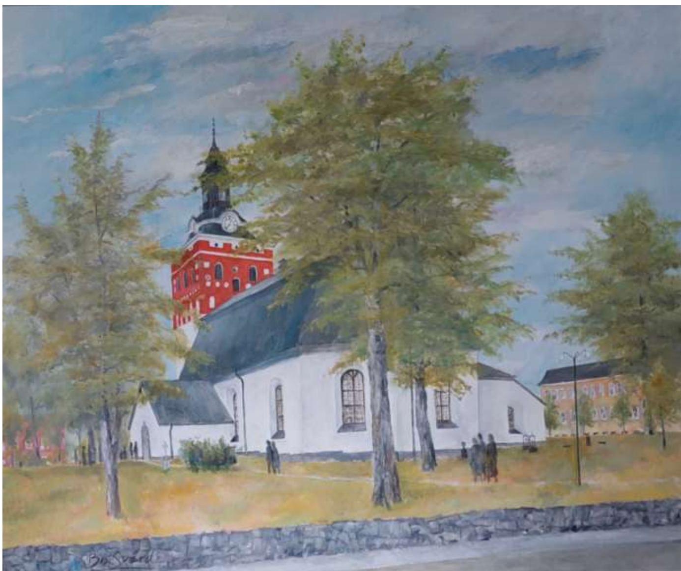
19. Kristina kyrka. Konstnär Bo Svärd. Ägs av Sala församling och är en gåva till församlingen från konstnären. Hänger permanent här i kyrkan.