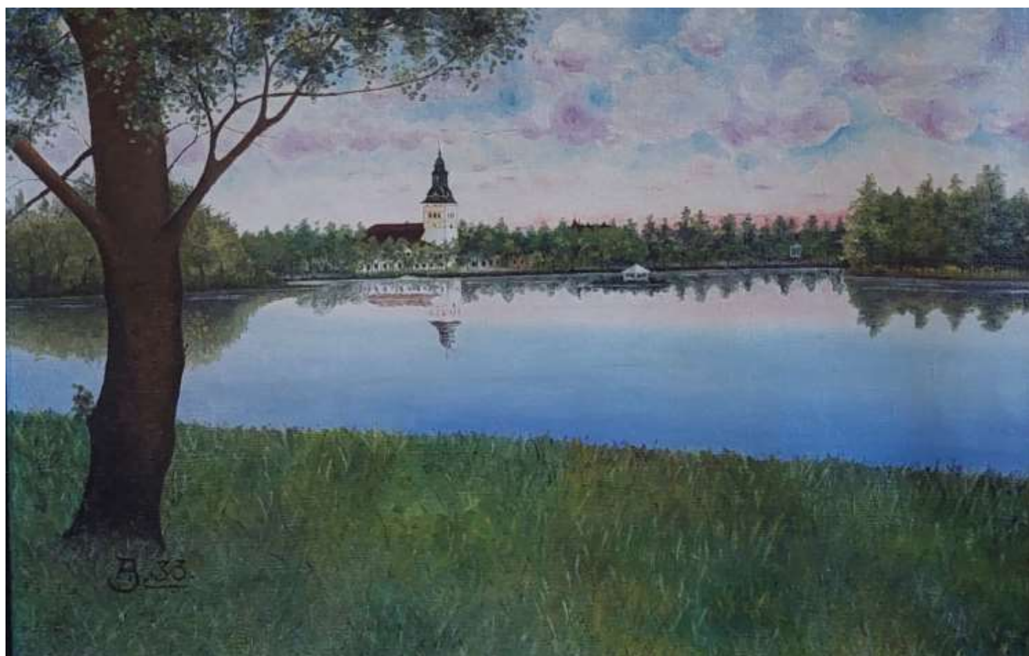
15. Dammarna och Kristina kyrka. Konstnär: Allan Jansson. Daterat 1933. Utsikt från Övre Ekeby damm. Man kan, förutom Kristina kyrka, se Ekebyskolan (dåvarande Sala Samrealskola), Västra småskolan, taket på Vallaskolan, musikpaviljongen i stadsparken och i dammen den s.k. Fågelön. Inlämnad av Avlidna Salakonstnärers sällskap.