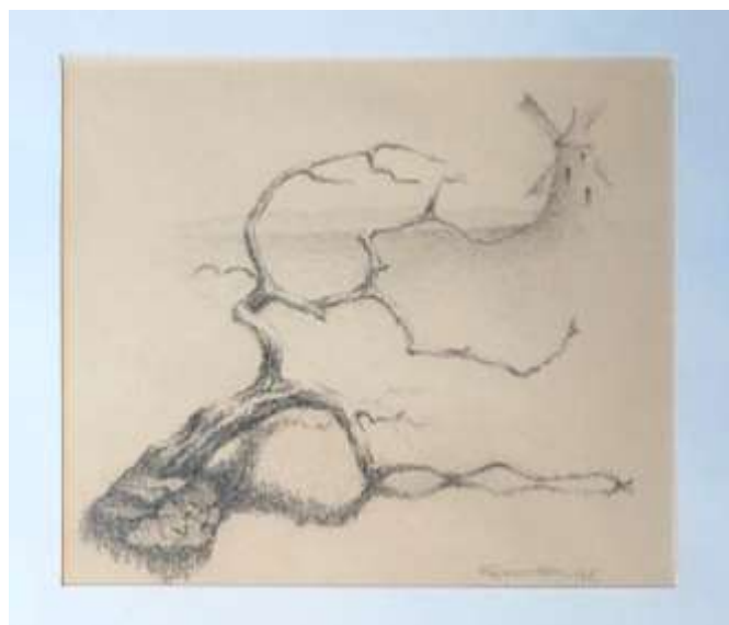
Hans Fagerström, Grenen , blyerts 10 x 12 cm.

Hans återkom också gärna till klotet som form. I olika utförande och material, ibland släta klippklot, ibland anfrätta klot eller skrovliga stenklot.