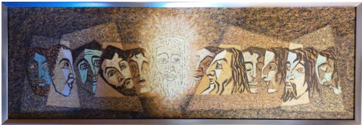
Hans Fagerström, Den sista måltiden , pastell 30 x 90 cm.

Text på passepartouten: "SKAPELSEN" FÖRSLAG TILL UTSMYCKNING AV LÄKTARBRÖSTET I STENINGE KYRKA. HANS FAGERSTRÖM, SEPT. 1991. SKALA 1:10.