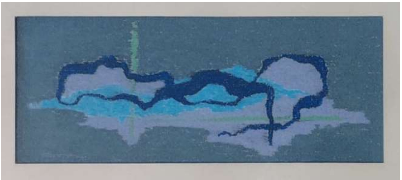
Hans Fagerström, Blå form , pastell 9 x 22 cm.

Julkort med typiskt Hallandsmotiv är ett i raden av julkort som Hans under en följd av år tecknade och skickade till sina närmaste vänner.