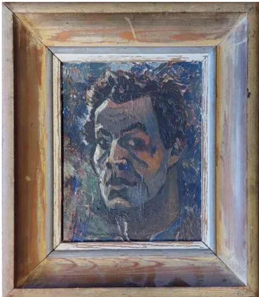
Hans Fagerström 1948, Självporträtt , olja 1948, 24 x 19 cm.

Ofta förekommande är klippformationer och stenblock med tydliga sprickor och bergsstrukturer.