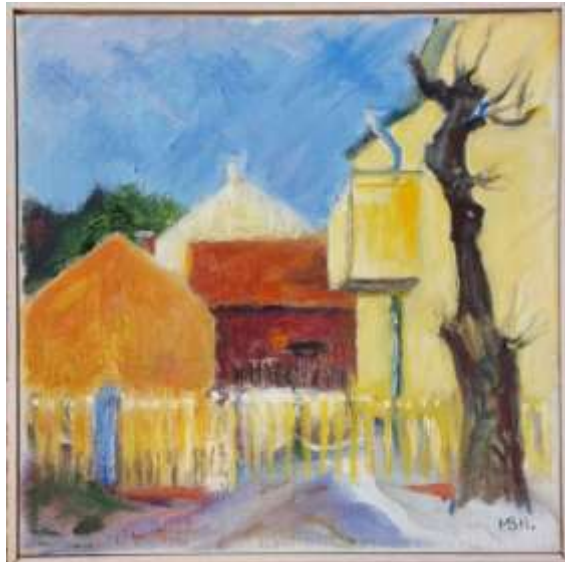
Maj-Britt Norman, Hyttgatan-Bergsmansgatan , olja 30 x 30 cm.

Adressen är Hyttgatan 22. Huset till höger är numera målad i rött. På plats kan man känna igen husen i bakgrunden, men trädet står inte där det ska! Konstnärlig frihet?