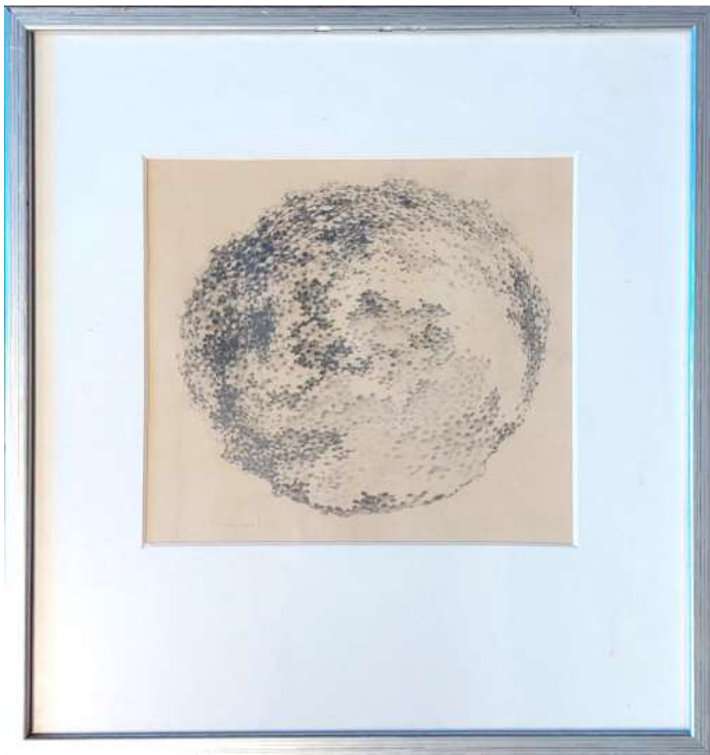
Hans Fagerström, Anfrätt klot , blyerts 20 x 22 cm.

Hans återkom också gärna till klotet som form. I olika utförande och material, ibland släta klippklot, ibland anfrätta klot eller skrovliga stenklot.