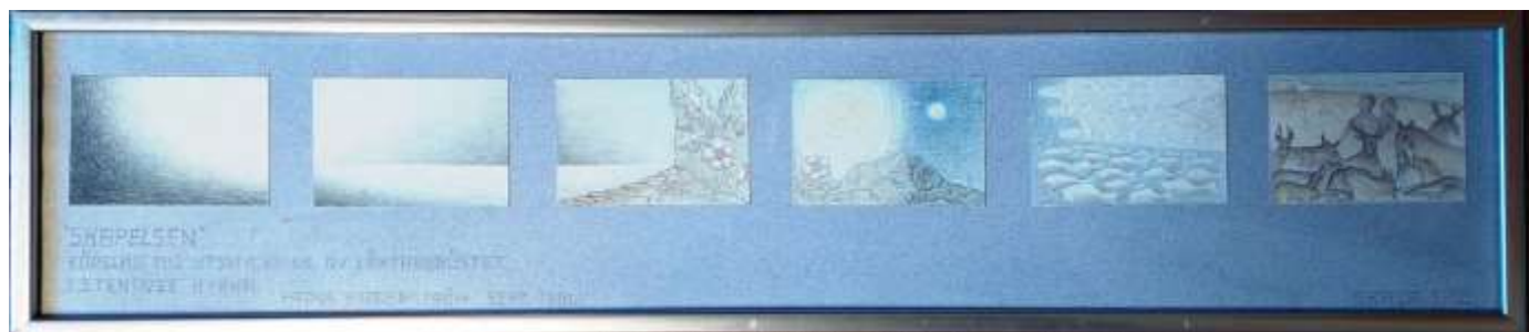
Hans Fagerström, Skapelsen , Steninge kyrka , skiss, blyerts-pastell 1991, 12 x 64 cm

Text på passepartouten: "SKAPELSEN" FÖRSLAG TILL UTSMYCKNING AV LÄKTARBRÖSTET I STENINGE KYRKA. HANS FAGERSTRÖM, SEPT. 1991. SKALA 1:10.