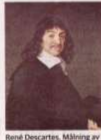
René Descartes. Målning av Frans Hals från andra halvan av 1600-talet.