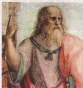
Platon. Porträtt i Rafaels fresk "Skolan i Aten" (1511).

I åtta essäer ringas genom olika perspektiv det konstnärliga och religiönsfilosofiska fenomenet Ivan Aguéli i samtidigt som Guds ljus klarar.