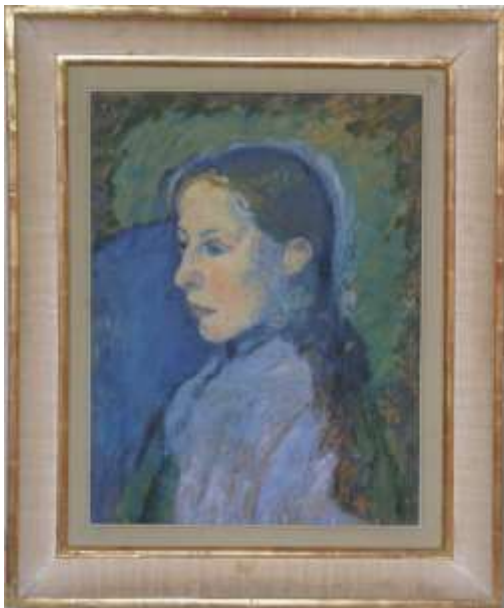
Flicka i blått, 50 x 38,5 cm, NM 4995