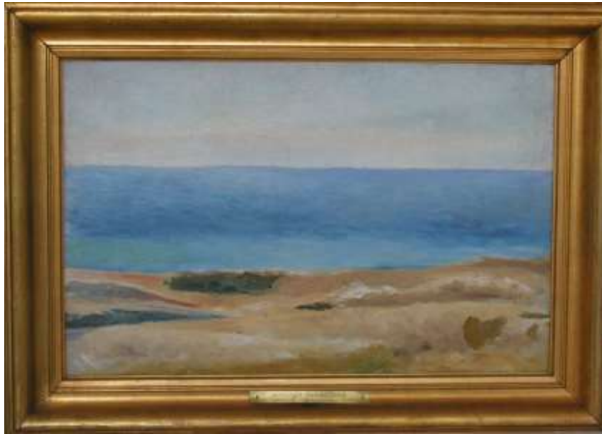
Havsstrand, Gotland, 41 x 63,5 cm, NM4980