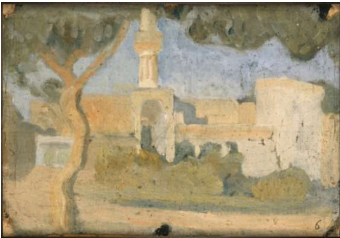
Ivan Aguéli, Moské , oljemålning på duk uppfodrad på papp, 21 x 30 cm. Tillhör prins Eugens Waldemarsudde. Målningen var med i Nationalmuséums utställning maj - juni 1939, John Gustaf Agelii med konstnärsnamnet Ivan Aguéli.