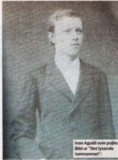
Ivan Aguéli som pojke. Bild ur "Det lysande tomrummet".

När Aguéli gick bort 48 år gammal 1917 så speglade hans liv ständiga förändringar och rörelser kring en och samma strävan att förstå tillvaron och rota sig i