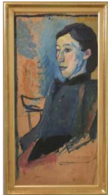
Ung flicka, 76 x 36,5 cm, MOM 302