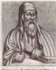
Origenes. Fantasiporträtt av Andre Thévet.