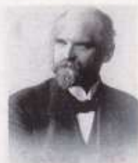
Ferdinand Tönnies 1915.

rar vi mycket högre grad än vi själva förstår utifrån en slags symbolbilder och schabloner som vi ser omkring oss, den sinnliga världen är i platonisk mening mest bara en avspiegling av de idéer vi har om den.