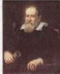
Galileo Galilei 1636. Målning av Justus Sustermans.