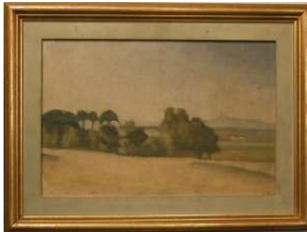
Egyptiskt slättlandskap, 19,5 x 29 cm, NM4990