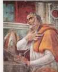
Kyrkofadern Augustinus. Målning av Sandro Botticelli från 1480.