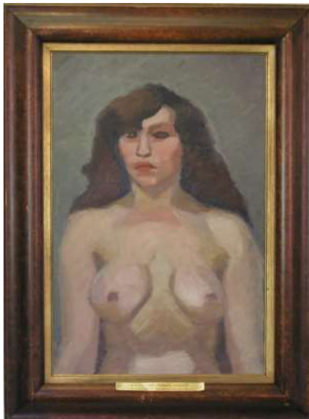
Aktstudie, 54 x 36 cm, NM 5001