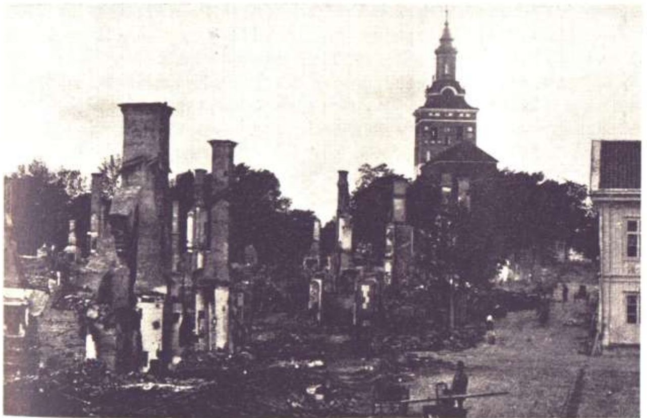
Västra kvarteret. Fotografi tagen dagen efter branden den 13 september 1880.