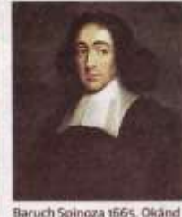
Baruch Spinoza 1665. Okänd konstnär.