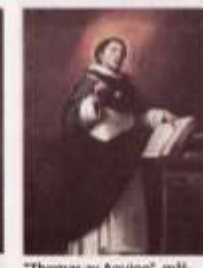
"Thomas av Aquino", målning av Bartolomé Esteban Murillo från 1650.