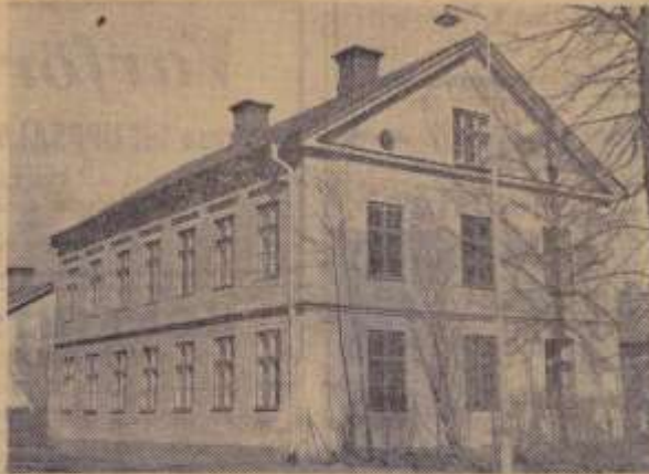
Den gård vid Bergmästargatan 29 i Sala, där konstnären Ivan Aguéli föddes år 1869.