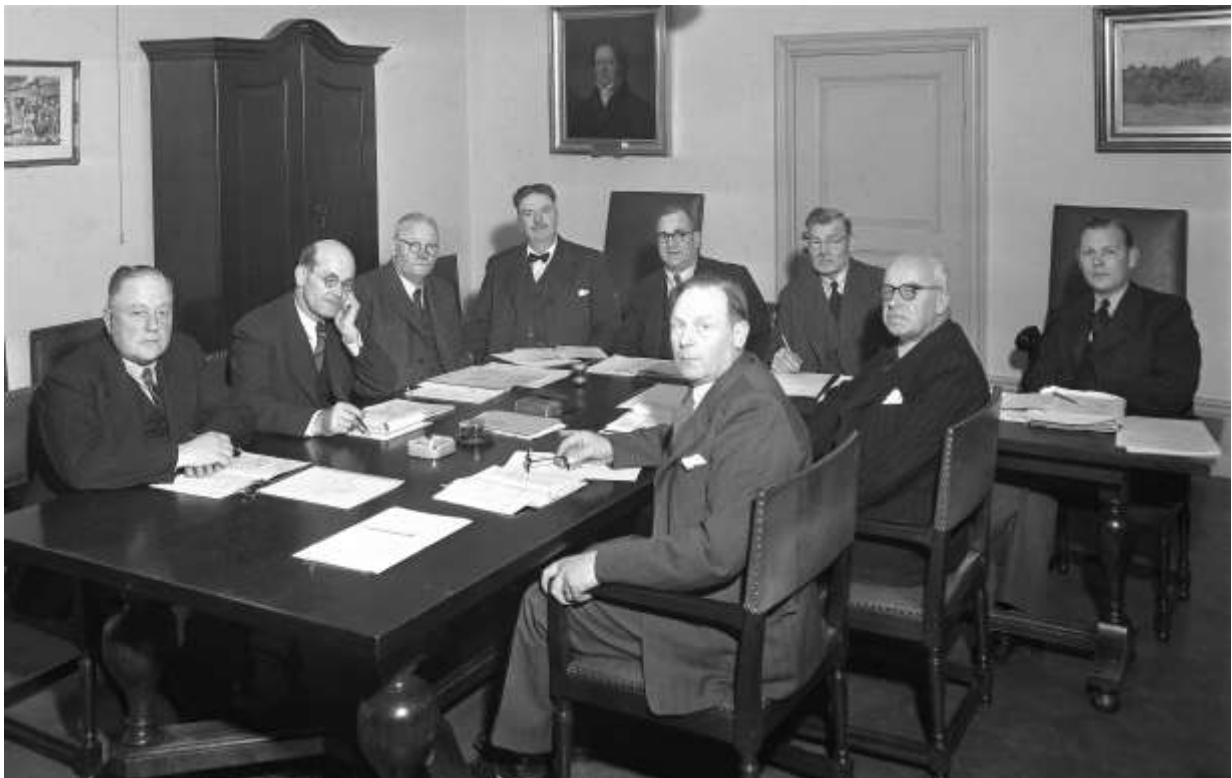
Drätselkammaren i Sala 1942.

I övre högra hörnet syns Franskt landskap av Ivan Aguéli. Målningen finns numera på Aguélimuseet.