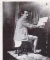
Paul Gauguin 1895. FOTO: ALPHONSE MUCHA