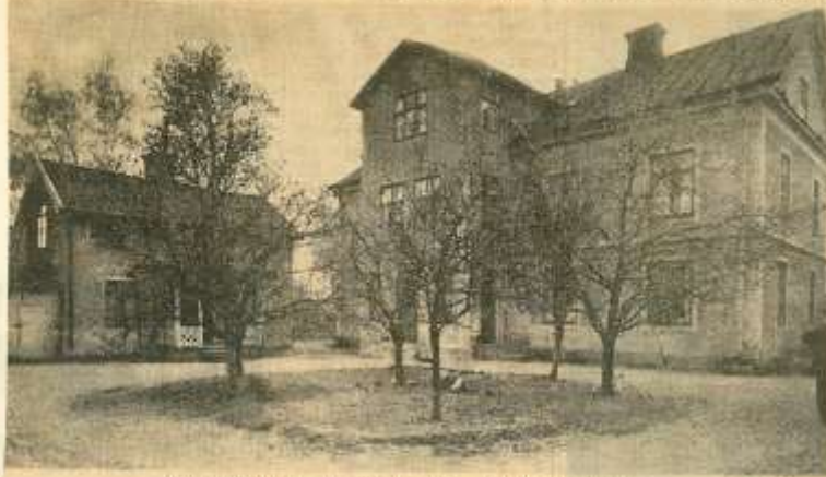
Bergmästargatan 23 i Sala är Ivan Aguéli bostadshuset.