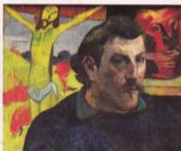
Självporträtt av Paul Gauguin från 1890.