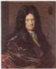
Gottfried Wilhelm Leibniz 1729. Målning av Bernhard Christoph Francke.