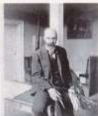
Richard Bergh 1904.