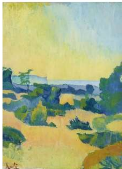
Ivan Aguéli, Gotländskt landskap

Det tidigare auktionsrekordet för mystikern Ivan Aguéli slogs idag, då hans Gotländskt landskap såldes för 7 miljoner kr. Tre miljonnoteringar uppnåddes totalt på dagens auktion - två av dem för Aguéli och en för den alltid älskade Jenny Nyström. Köpkraften är stark då det gäller högklassigt svenskt måleri!