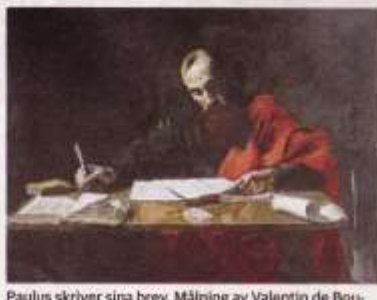
Paulus skriver sina brev. Målning av Valentin de Boulogne från 1620.