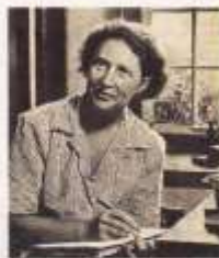
Susanne K. Langer 1945.