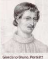
Giordano Bruno. Porträtt från 1578.