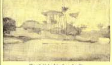
'Eggenstret landskap' av Aguéli.

De som är mest uppmärksamma på en utställning för konstutställning, som denna kända för Friberg huset. Den fanns för i. a. i Sala stads råd 22 i relativt högsta omfattning har man på flera förtroende uttryckt på ett Aguelimuseum. Har man över huvud taget tänkt så långt som att detta skulle bli en fullständig konstutställning.