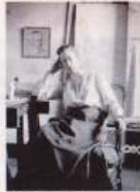
Hilma af Klint 1895.

Hos Swedenborg finner vi solmetaforen, att Guds andliga ljus genomströmmar Skapelsen. Just solens starka sken återkommer i hela Aguéli konstnärskap, hans bilder fullkomligen badar i ljus. Det soliga monoteistiska landskapet blir på så vis i både Swedenborgs och Ibn Arabis mening en kontrastrik spegelbild av Gud, det andliga reflekteras i det materiella. Åter-