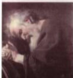
Filosofen Herakleitos. Målning av Johannes Moreelse från 1630.

För den kristna enhetskulturen som strävat efter att förstå hela tillvaron enligt ett mönster utgjorde de nya upptäckterna snart en kris. Den katolske franske matematikern och filosofen René Descartes försökte på 1600-talet rädda världsbilden genom kritiskt tänkande, likt Augustinus kom han fram till att hans eget tvivel utgjorde en självklar existenspunkt, "jag tänker, alltså är jag", och återskapade sedan både Gud och Skapelsen mindre kritiskt.