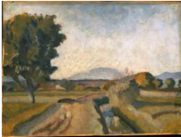
Ivan Aguéli, Spanskt landskap med väg , 1916-17, olja på papper monterad på masonit, 16,5x23 (MOM 517)