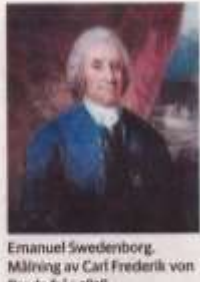
Emanuel Swedenborg. Målning av Carl Frederik von Breda från 1818.