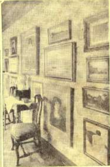
En vägg med Agueli-teckningar i det fribergska huset på Smedbrogården i Sala.

En teckning, som skildrar verk. Det var också ett stort glädje har genom den utställningens utställning. Det är också ett stort glädje har genom den utställningens utställning.