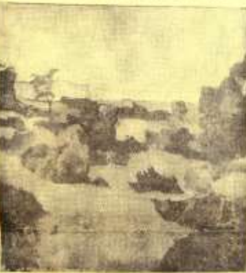
'Svartskårets landskap' av Aguéli, i privat ägo.