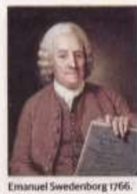
Emanuel Swedenborg 1766. Målning av Per Krafft den äldre.