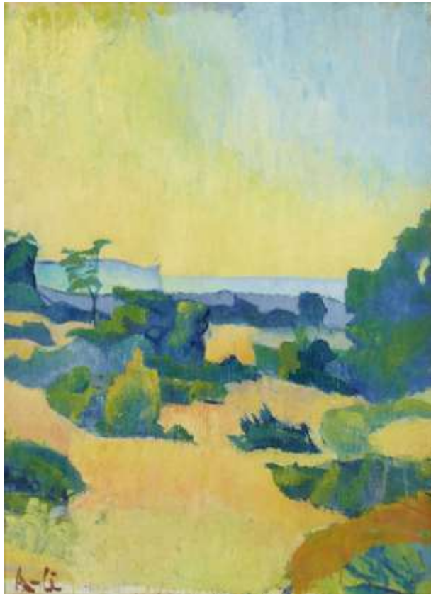
Ivan Aguéli, Gotländskt landskap , 1892, olja 76 x 55 cm Auktionsverket nr 2039 i juni 2015