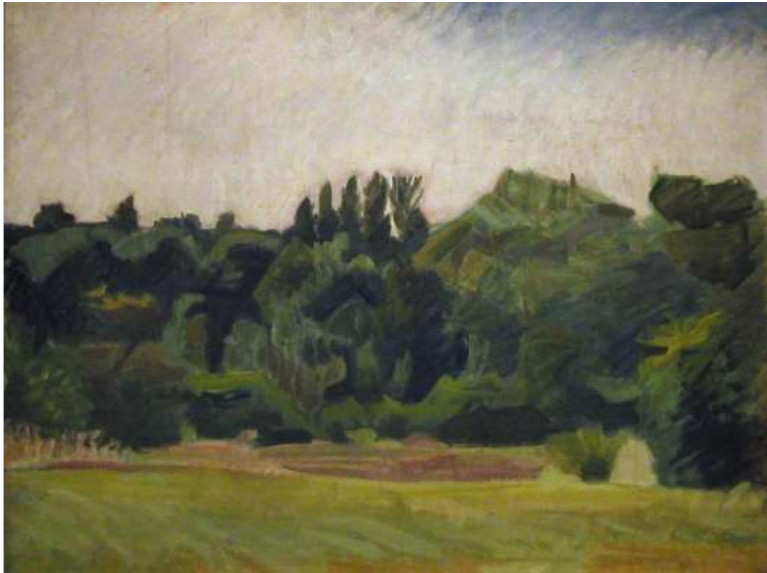
Ivan Aguéli, Franskt landskap , olja 1913, 43 x 58 cm. Gåva till Sala Stad 1928 från prins Eugen.