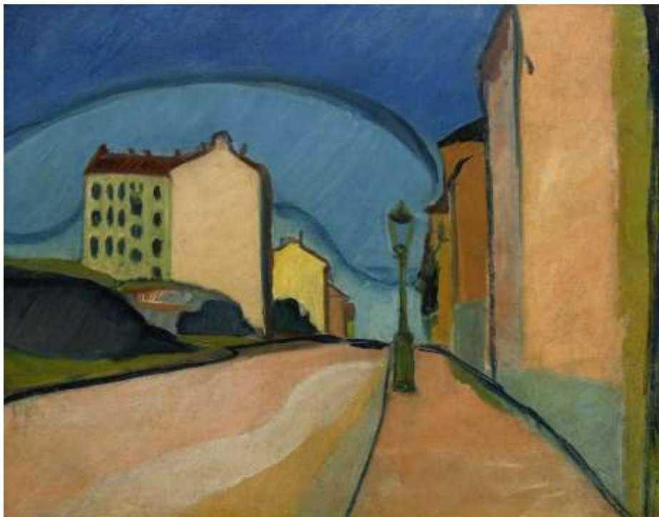
Ivan Aguéli, Stockholmsutsikt , 1892, olja 46 x 58 cm. Klubbat pris 5 400 000 kr, Auktionsverket nr 2080 i december 2013