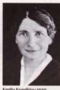
Emilia Fogelklou 1930.