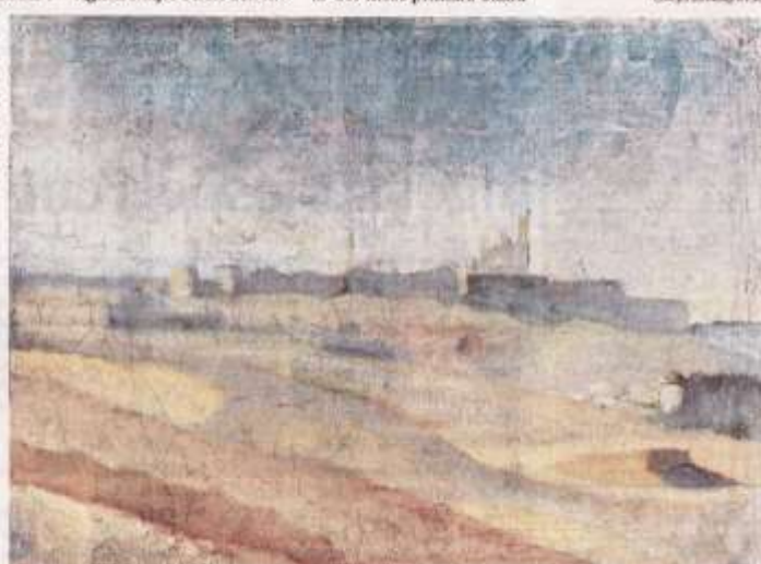
"Staden bland kullarna (Landskap från Egypten)" från 1895.