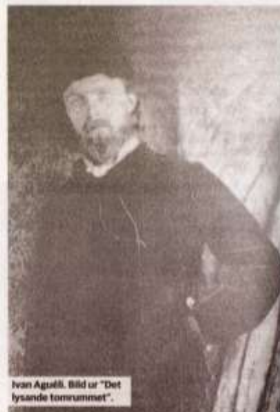
Ivan Aguéli. Bild ur "Det lysande tomrummet".