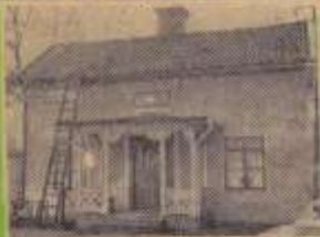
Det mindre huset på gårdstomten.

Aguéli föddes år 1869. Den egentliga impulsen till måleriet gav honom gotlandsnaturen. Större delen av sitt liv vistades han i utlandet. Han emigrerade till Barcelona 1917. Tack vare prins Eugens aktiva intresse räddades hans kvarlämnad till Sverige.