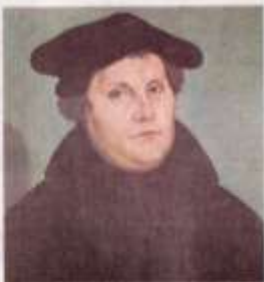
Martin Luther 1529. Målning av Lucas Cranach den äldre.