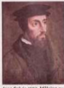
Jean Calvin 1550. Målning av okänd konstnär.