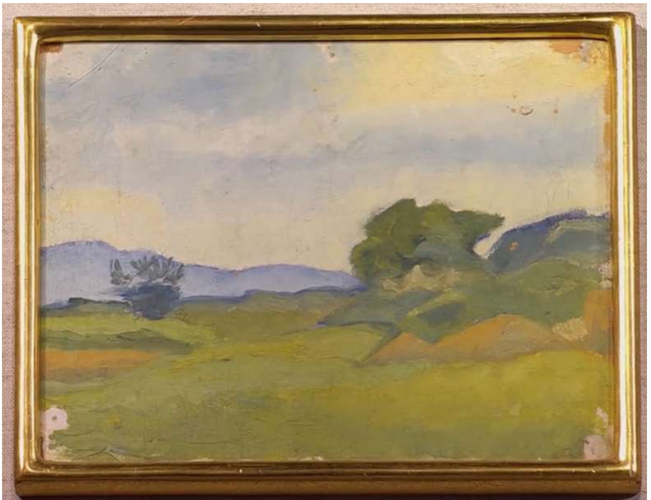
Li Pamp: En landskapsmålning från trakten utanför Barcelona.