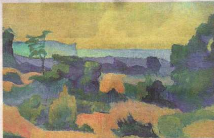
REKORD. Ivan Aguélis tavla "Gotländskt landskap" såldes för 5.7 miljoner kronor.

- Bägge tavlorna är målade på Gotland år 1892 och är väldigt lika varandra. Det året tillbringade Aguéli väldigt mycket tid på Gotland och han var väldigt inspirerad av landskapet och ljuset där. År 1889 kom han till Gotland för första gången och det var faktiskt då