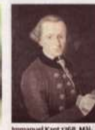
Immanuel Kant 1768. Målning av Johann Gottlieb Becker.