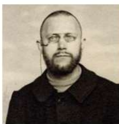
Ivan Aguéli blev 48 år gammal. Kort efter hans död sker hans stora genombrott.