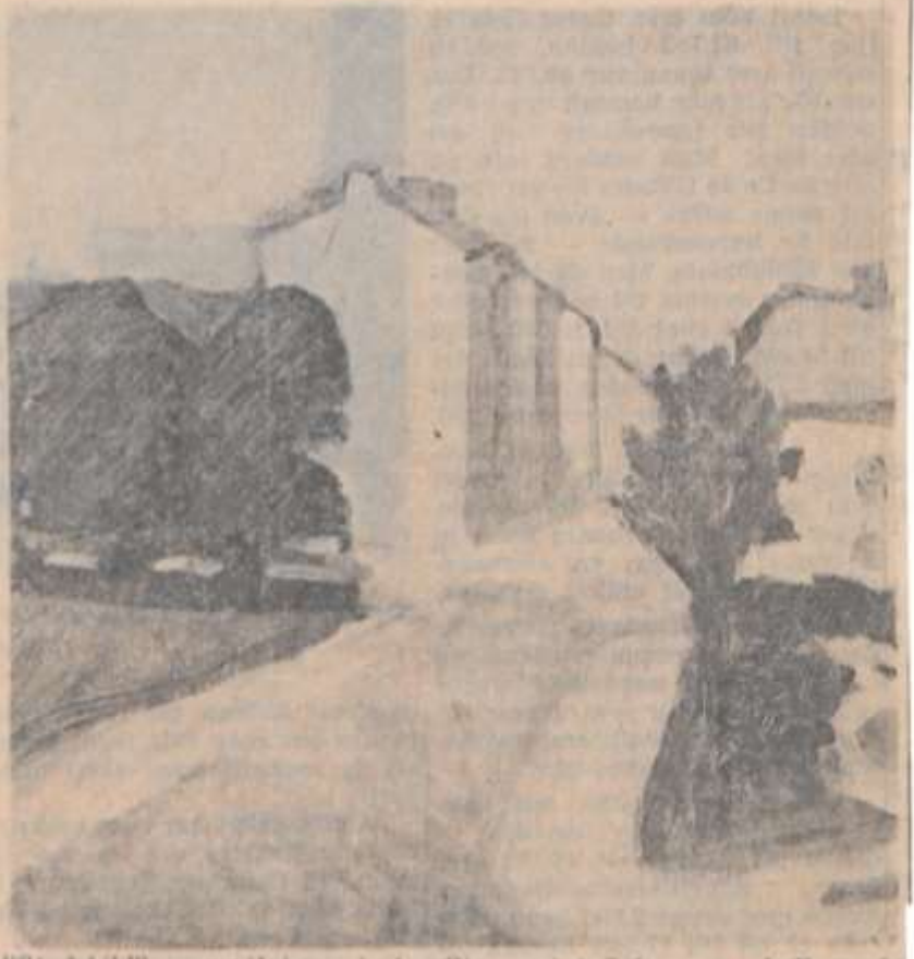
"Stadsbild", en målning på Aguélimuseet i Sala, som skall pryda utställningsaffischen.

— Vi räknar också med att kunna använda material ur utställningens katalog till den katalog över museets samlingar som vi saknat hittills men som vi nu ska försöka åstadkomma, säger hr Bergman.