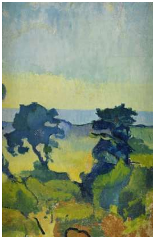
Ivan Aguéli, Kustlandskap med två träd, Gotland , 1892, olja 72 x 47 cm Auktionsverket nr 2073 i juni 2015