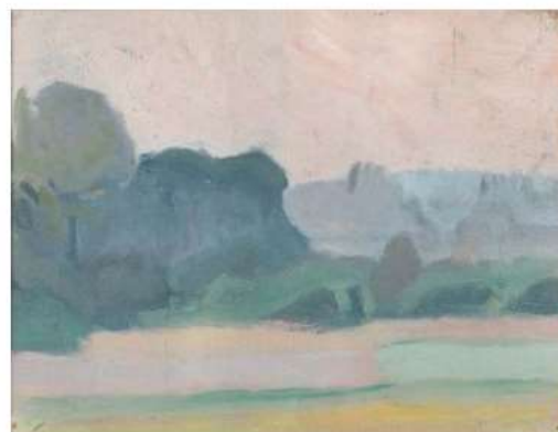
För Ivan Aguéli var måleriet en gudsämnelse (Morgonrodnad, 1913).

av religiöst orienterad litteratur, skriver han till målaren Olof Sager-Nelson: