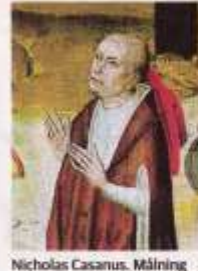
Nicholas Casanus. Målning av Mästaren av Marias levnad från 1480.