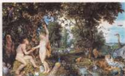
Peter Paul Rubens och Jan Bruegel den äldre skildring av paradiset från 1617 influerad av Origenes allegoriska och mystiska läsning av Skapelseberättelsen.