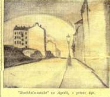
'Svartskårets landskap' av Aguéli, i privat ägo.