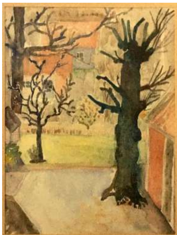
Kåge Bergman, akvarell 40 x 25 cm.