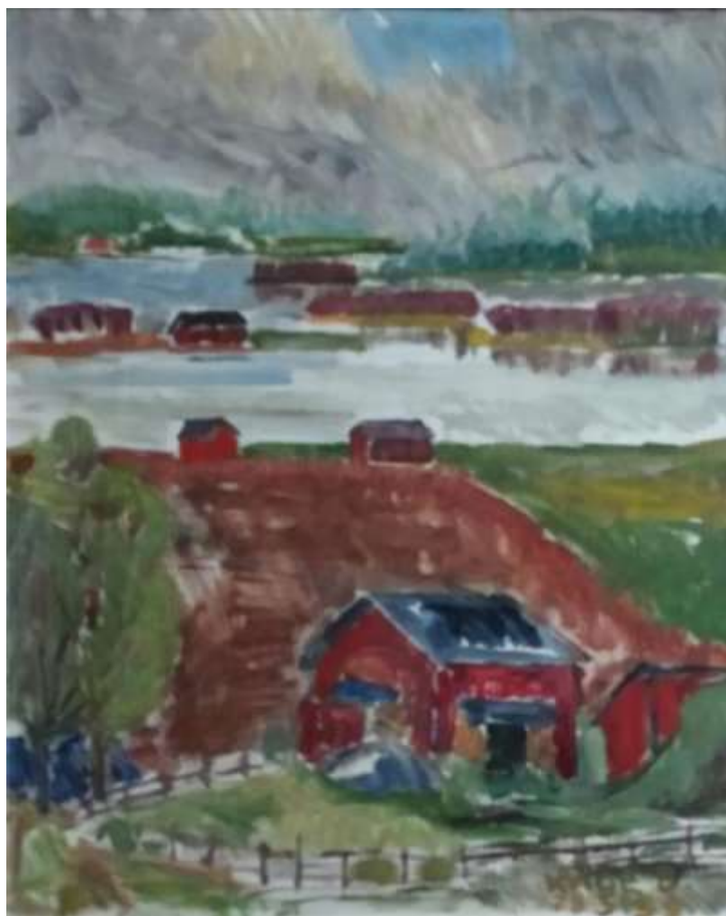
Kåge Bergman, Lador i Hälsingland , olja 1959, 45 X 37 cm.