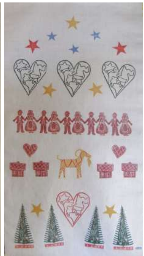
115 x 59 cm