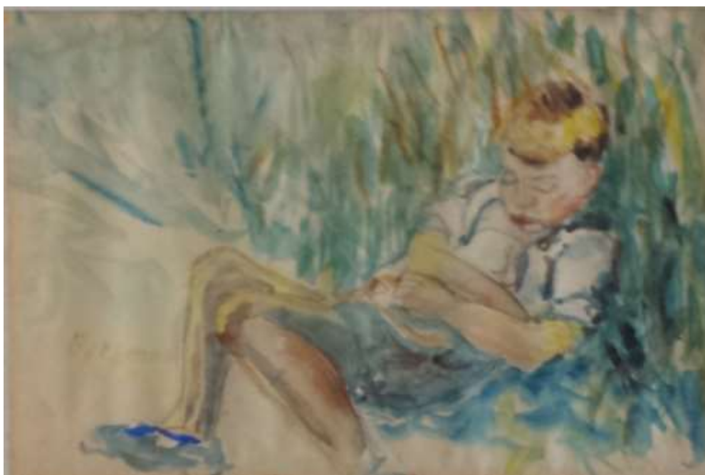
Kåge Bergman, Sovande pojke , akvarell 15 x 22 cm.