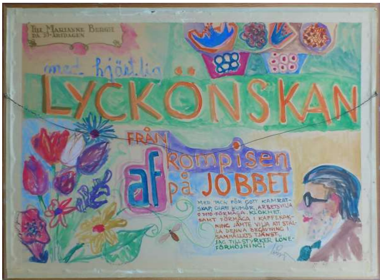
Kåge Bergman, akvarell 26 oktober 1969, 29 x 49 cm, baksida.