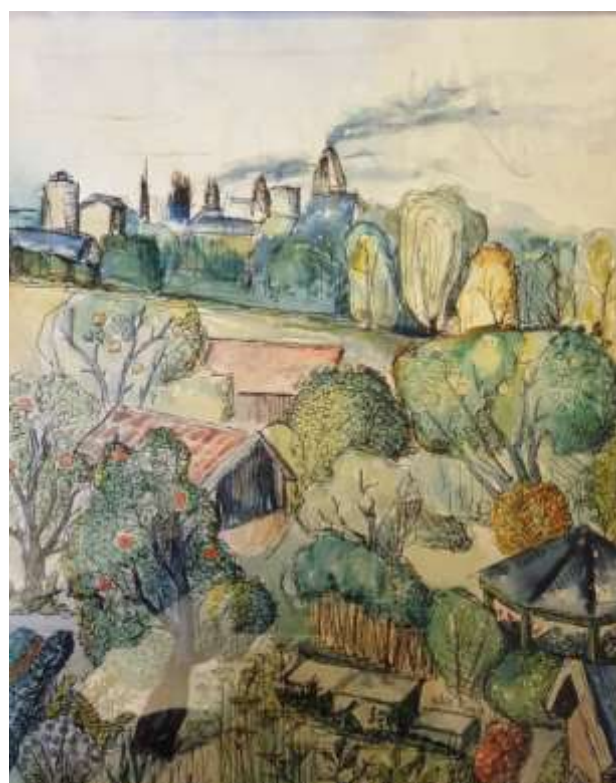
Kåge Bergman, Strå kalkbruk , akvarell 27 sept 1953, 39 x 32 cm.