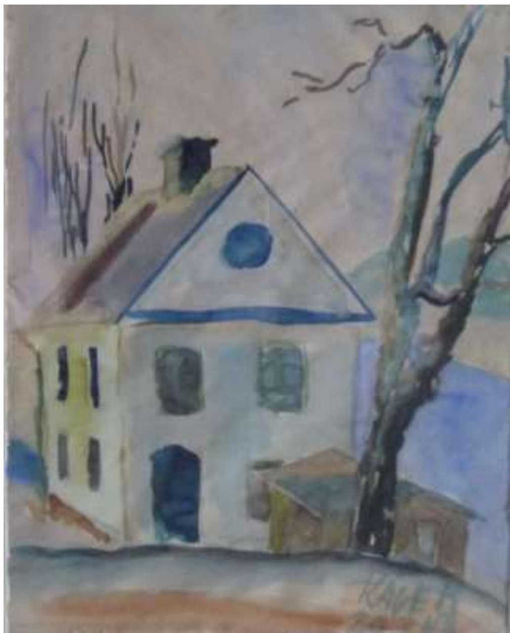
Kåge Bergman, Gammalt hus, Södertälje , akvarell 20 mars 1943, 26 x 21 cm