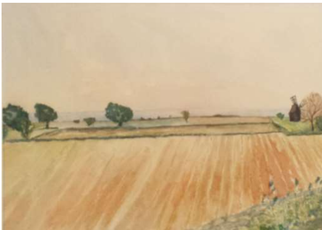
Kåge Bergman, 1984, Öland , akvarell 1984, 29 x 41 cm.