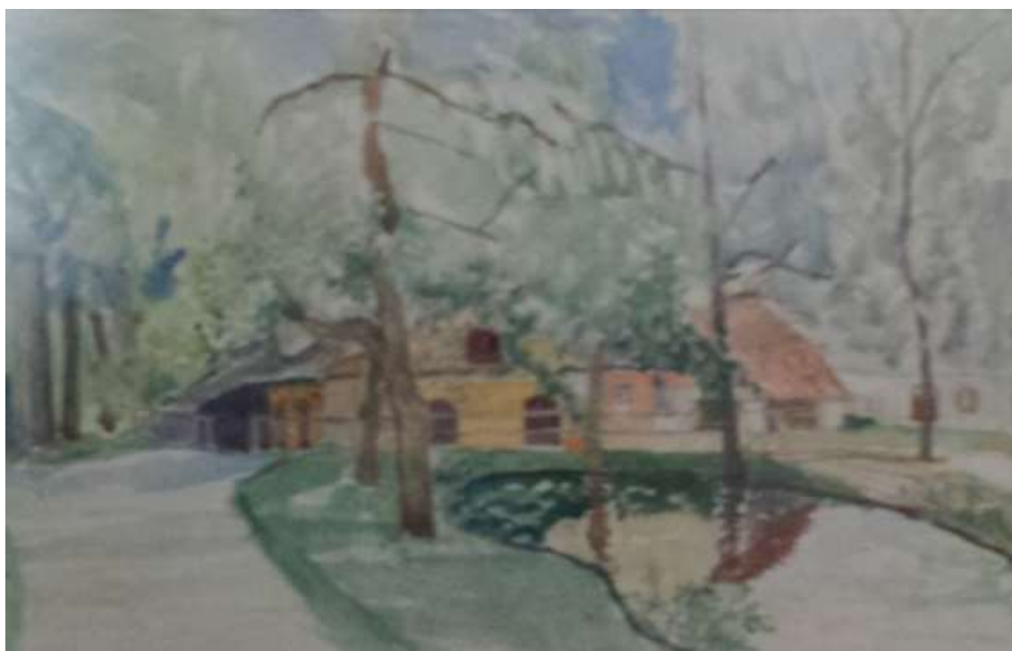
Kåge Bergman, Smedjan Österbybruk , akvarell 1978, 45 x 29 cm.