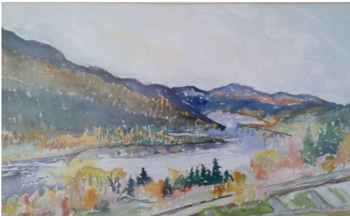
Kåge Bergman, (28 sept 1977?).