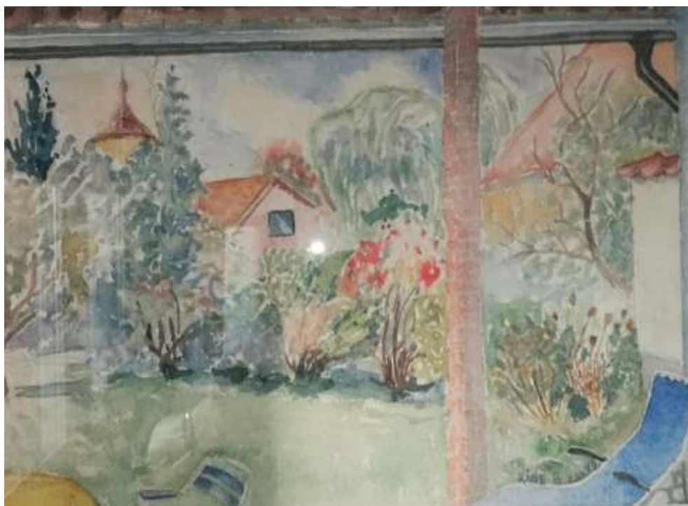
Kåge Bergman, Trädgården Hyttgatan , akvarell 2 oktober 1975, 25 x 37 cm.