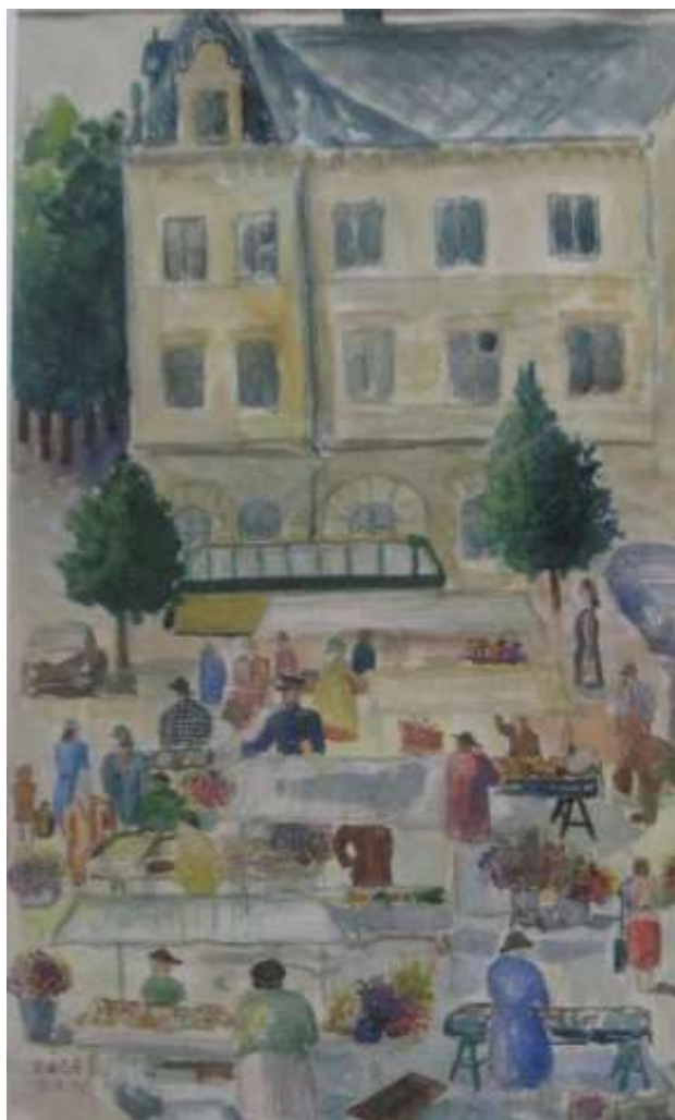
Kåge Bergman, Stora Torget 1948, akvarell 48 x 29 cm