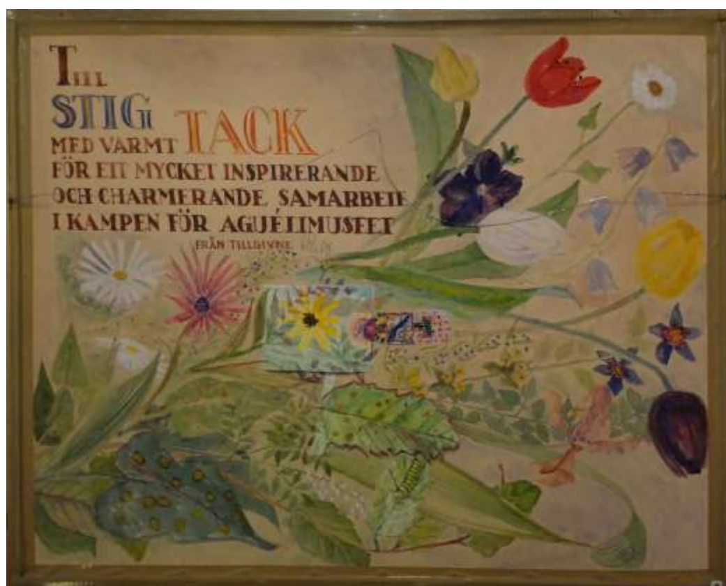
Kåge Bergman, 36 x 53 cm, baksida: akvarell 4 augusti 1985, 55 x 69 cm.