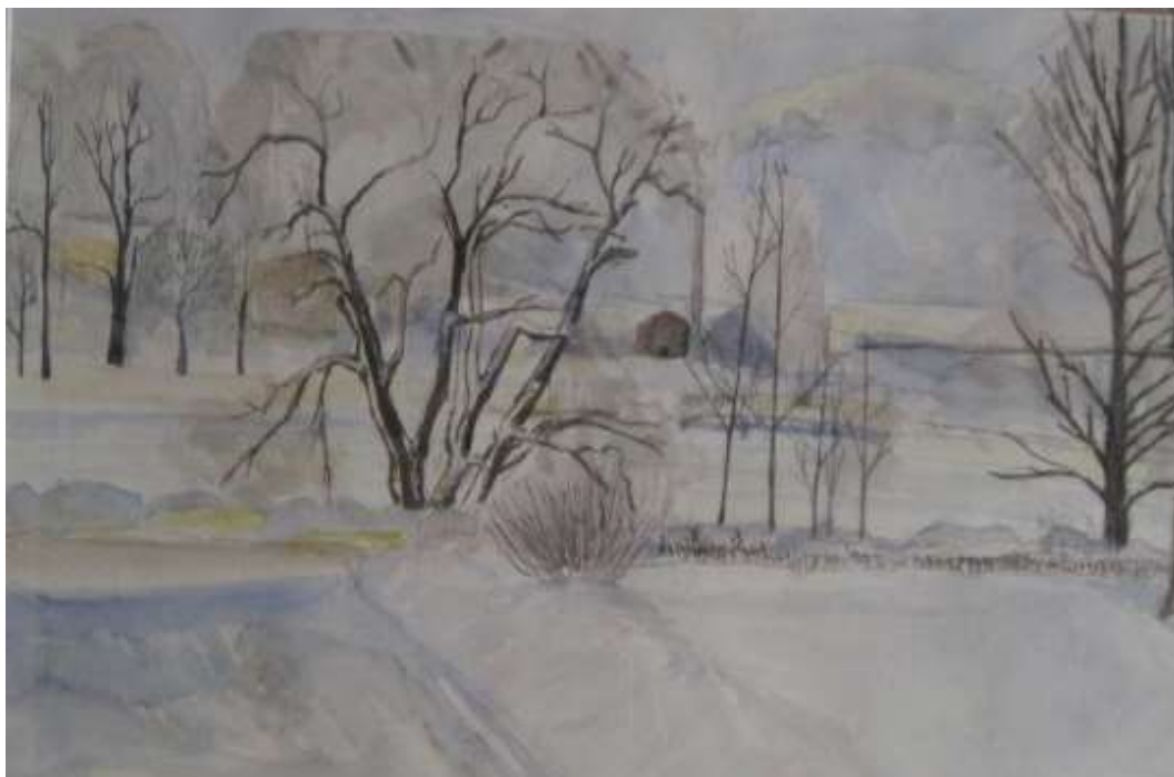
Kåge Bergman, Vinterbild, dammarna 1970, akvarell 47 x 29 cm