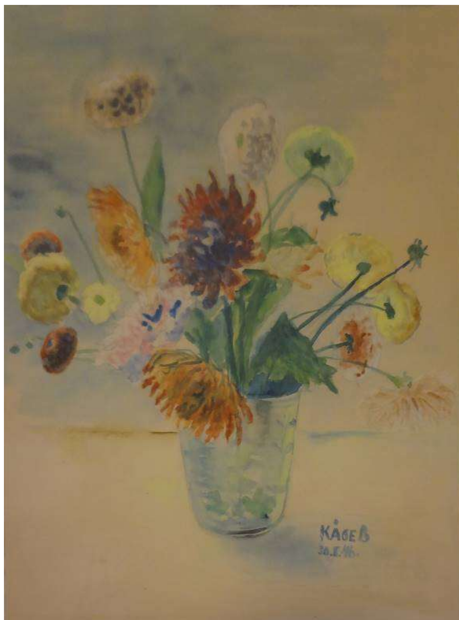
Kåge Bergman, Dahlia , akvarell 30 augusti 1946, 60 x 46 cm. Landstinget i Västmanland.