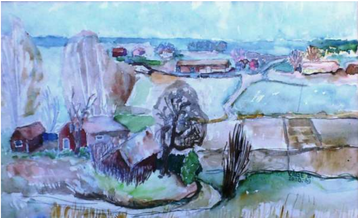
Kåge Bergman, akvarell 26 oktober 1969, 29 x 49 cm.