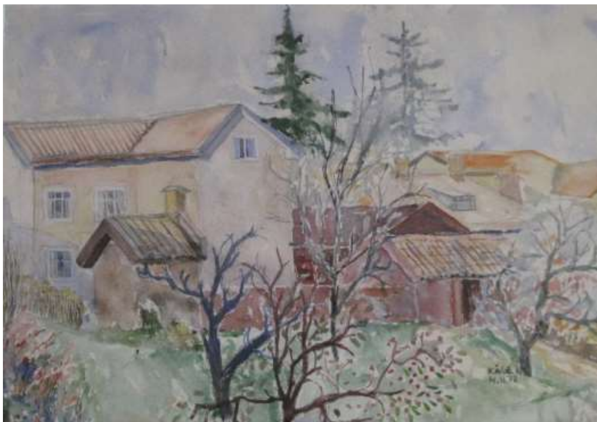
Kåge Bergman, Marsvinterbild. Utsikt mot Bellanderska gården , akvarell 1972, 37x51 cm.