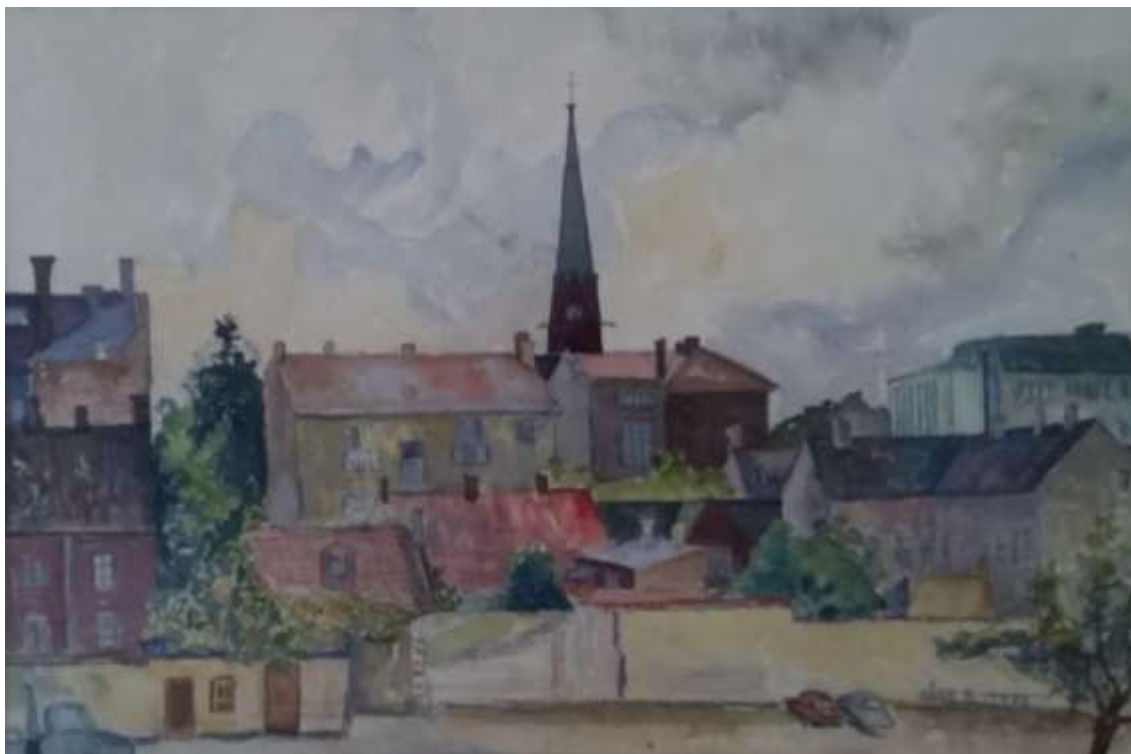
Kåge Bergman, akvarell (17 juli 1973?).