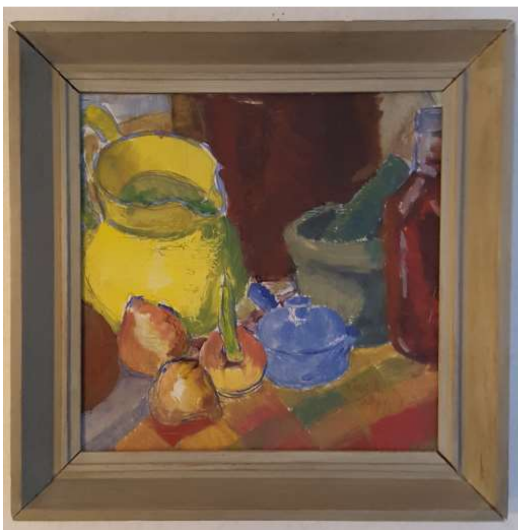
Kåge Bergman, olja 1953, 27 x 27 cm.