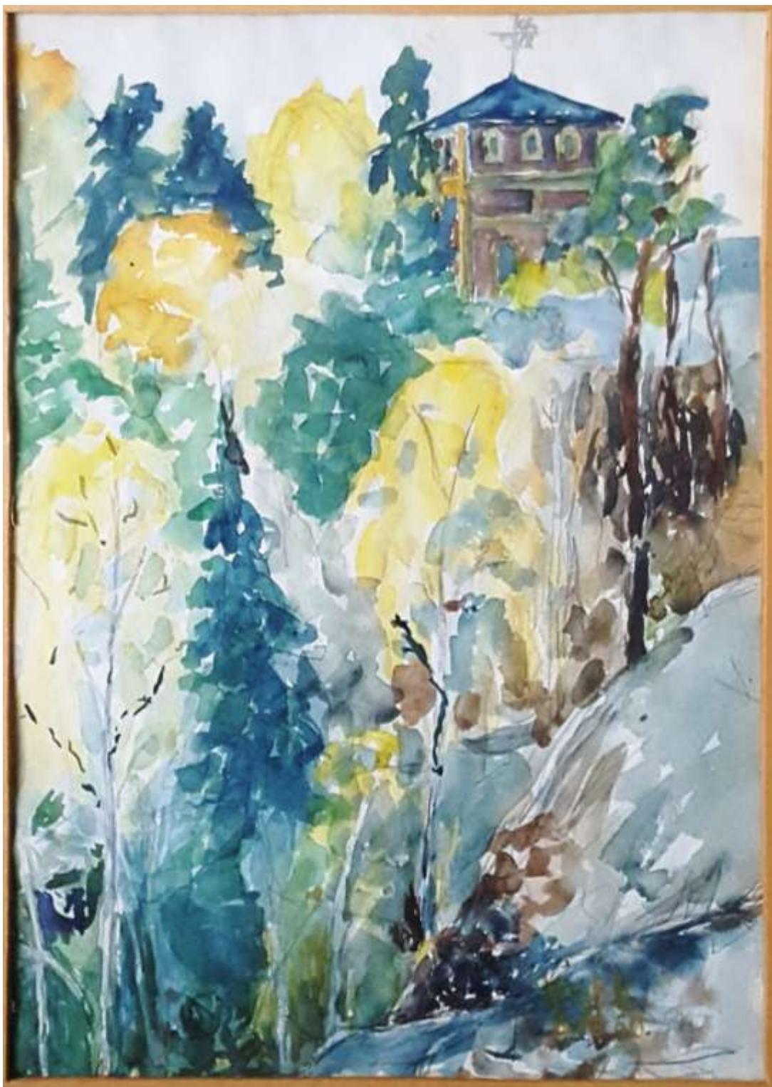
Kåge Bergman, Knechtschaktet , akvarell 1950.

Text på baksidan: Till Barbro med önskan om en god jul 1950. Kåge B.