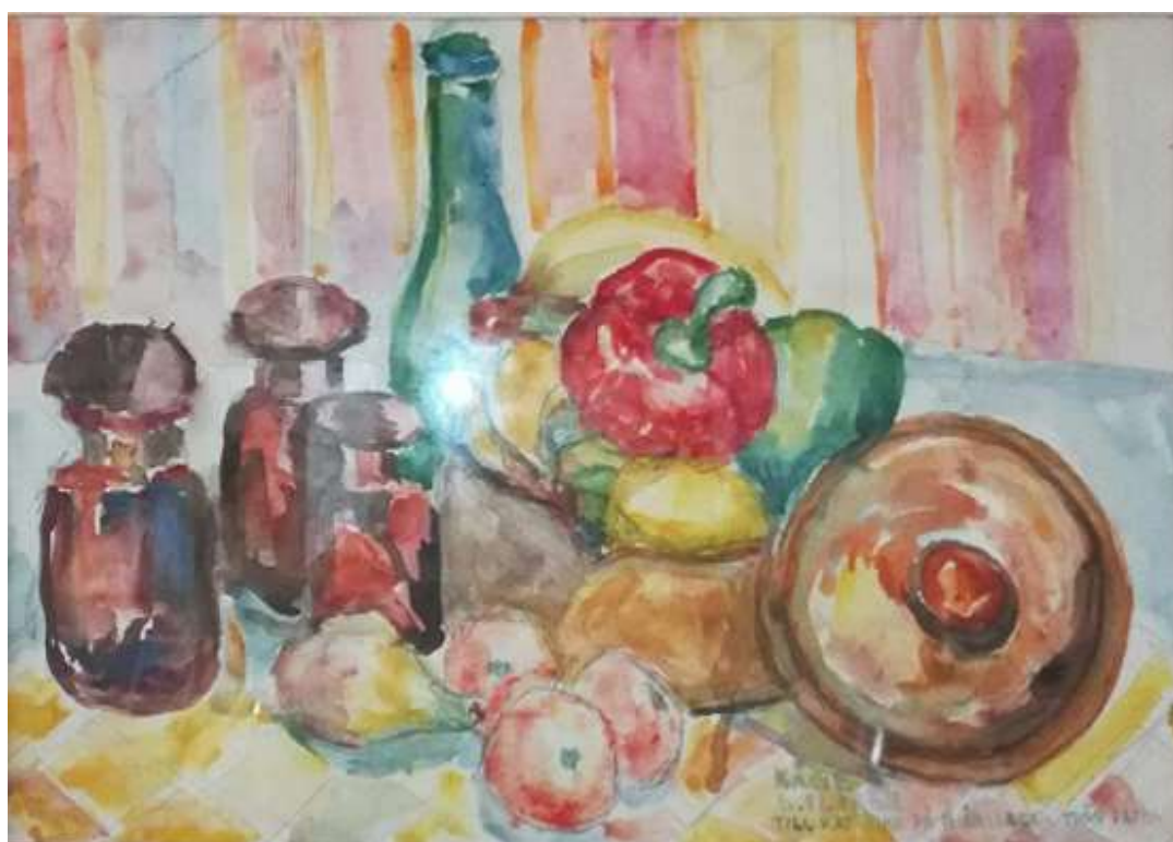
Kåge Bergman, Stilleben , akvarell 1968, 29 x 42 cm.

Text: TILL KATARINA PÅ 11-ÅRS DAGEN FRÅN PAPPA (reflex i glaset)