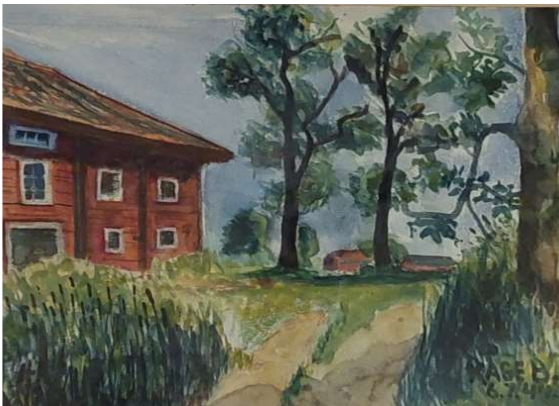
Kåge Bergman, akvarell 6 juli 1944.