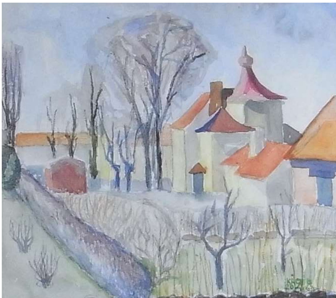
Kåge Bergman, Stadsbild , akvarell 20 april 1963, 21 x 26 cm.