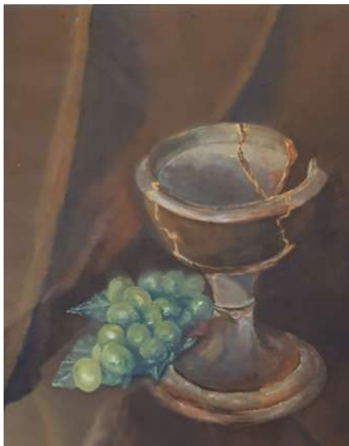
Kåge Bergman, Skål med vindruvor , gouache 1934, 27 x 23 cm. 0