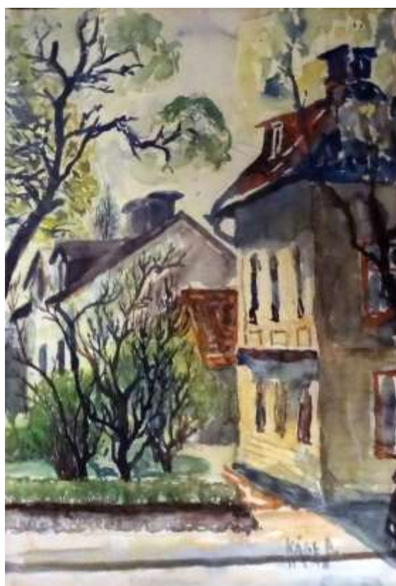
Kåge Bergman, akvarell 11 mars 1948, 33 x 24 cm