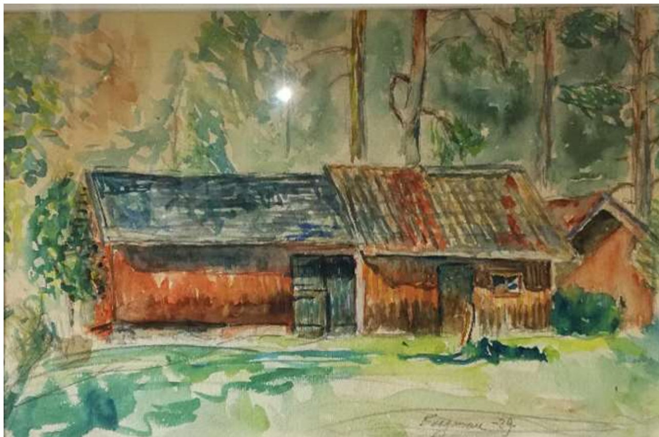
Kåge Bergman, Lärarens lada , akvarell 1939, 22 x 34 cm. (reflex i glaset)