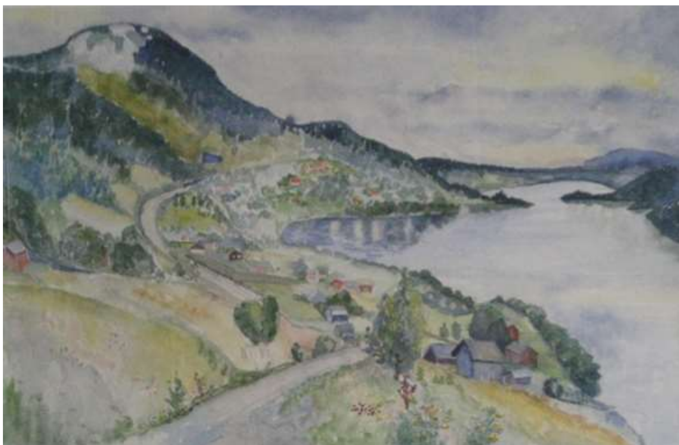
Kåge Bergman, Berg o dal Åre , akvarell 1976, 37 x 57 cm.

Text på baksidan: Till Elisabet o Jalle med varma lyckönskningar från ma Barbro o pa Kåge 2/2 1979