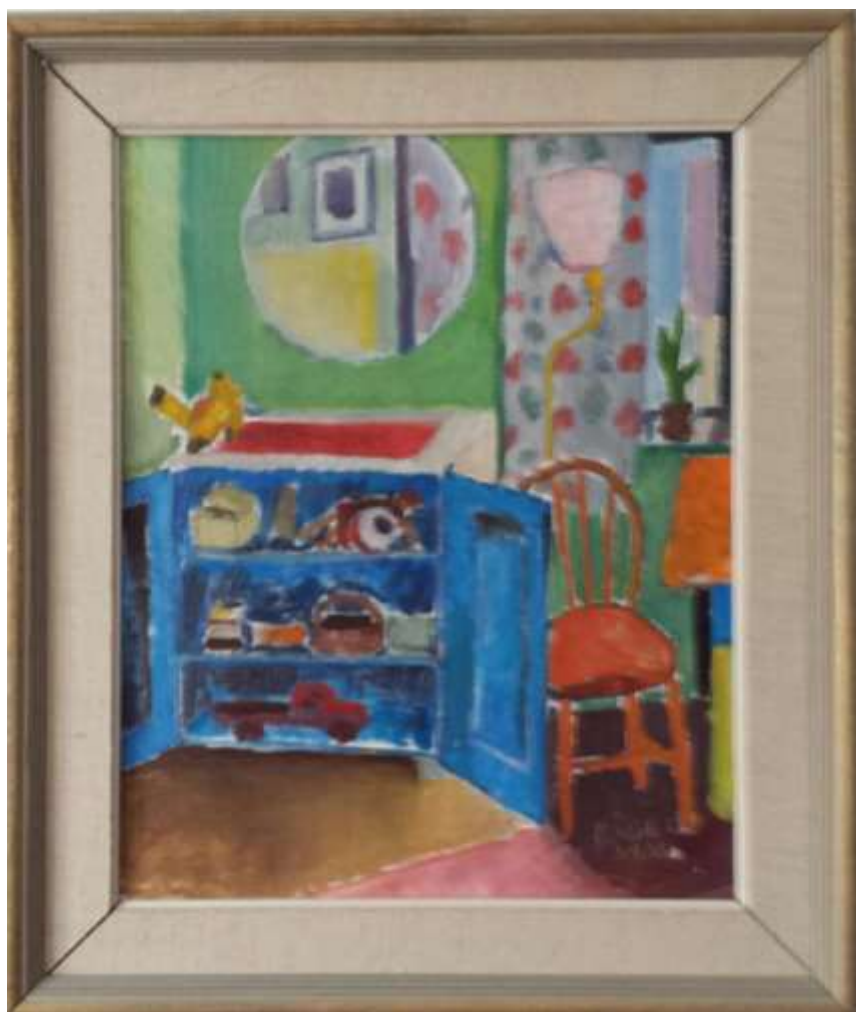
Kåge Bergman, Leksaksskåpet , olja 1953, 40 X 33 cm.