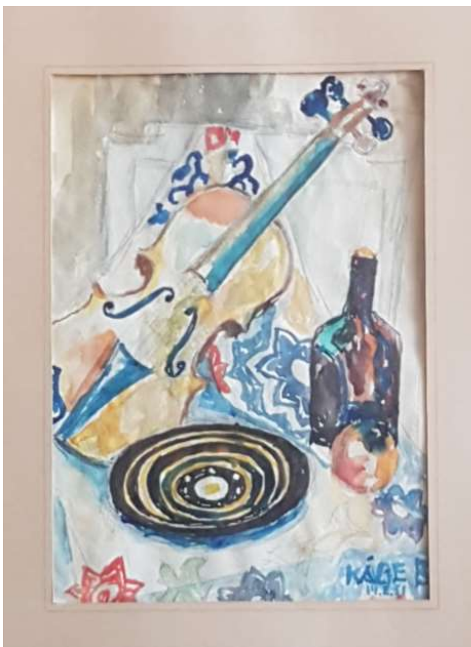
Kåge Bergman, akvarell 14 februari 1951, 50 x 38 cm med ram.