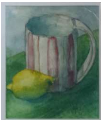
Kåge Bergman 1945, Mugg och citron , akvarell 1945, 18 x 15 cm.