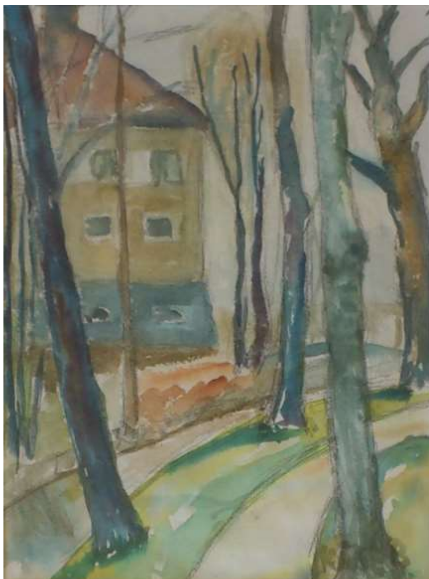
Kåge Bergman, Carl Fribergs hus , akvarell 1944, 35 x 24 cm