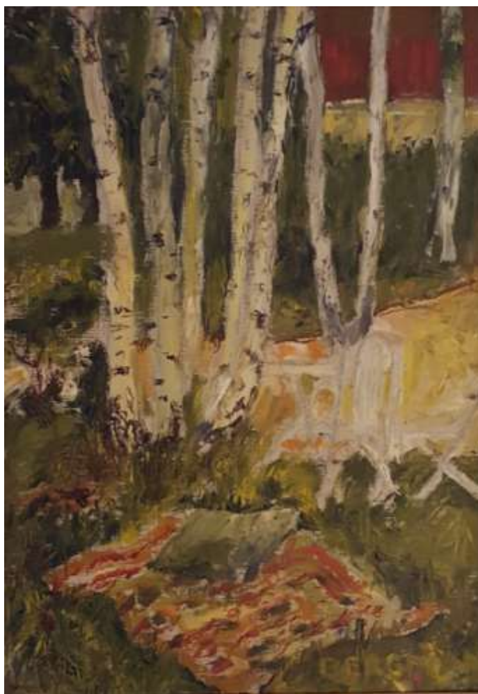
Kåge Bergman, olja 46 x 33 cm.