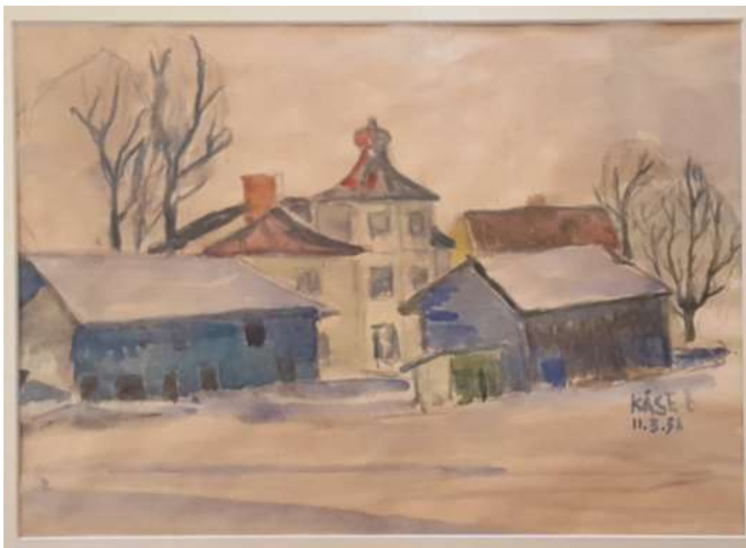
Kåge Bergman, akvarell 11 mars 1956, 27 x 35 cm.