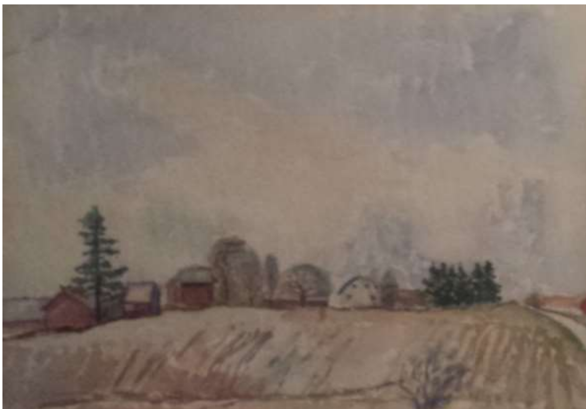
Kåge Bergman, akvarell 1974, 24 x 35 cm.