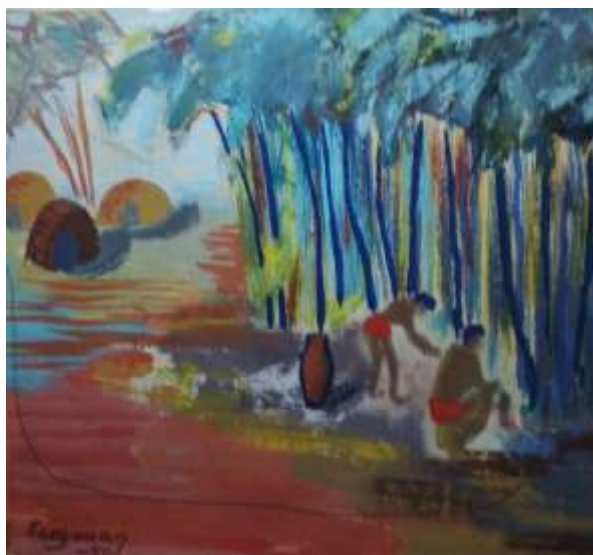
Kåge Bergman, Strandhugg , gouache 1940, 10 x 11 cm.