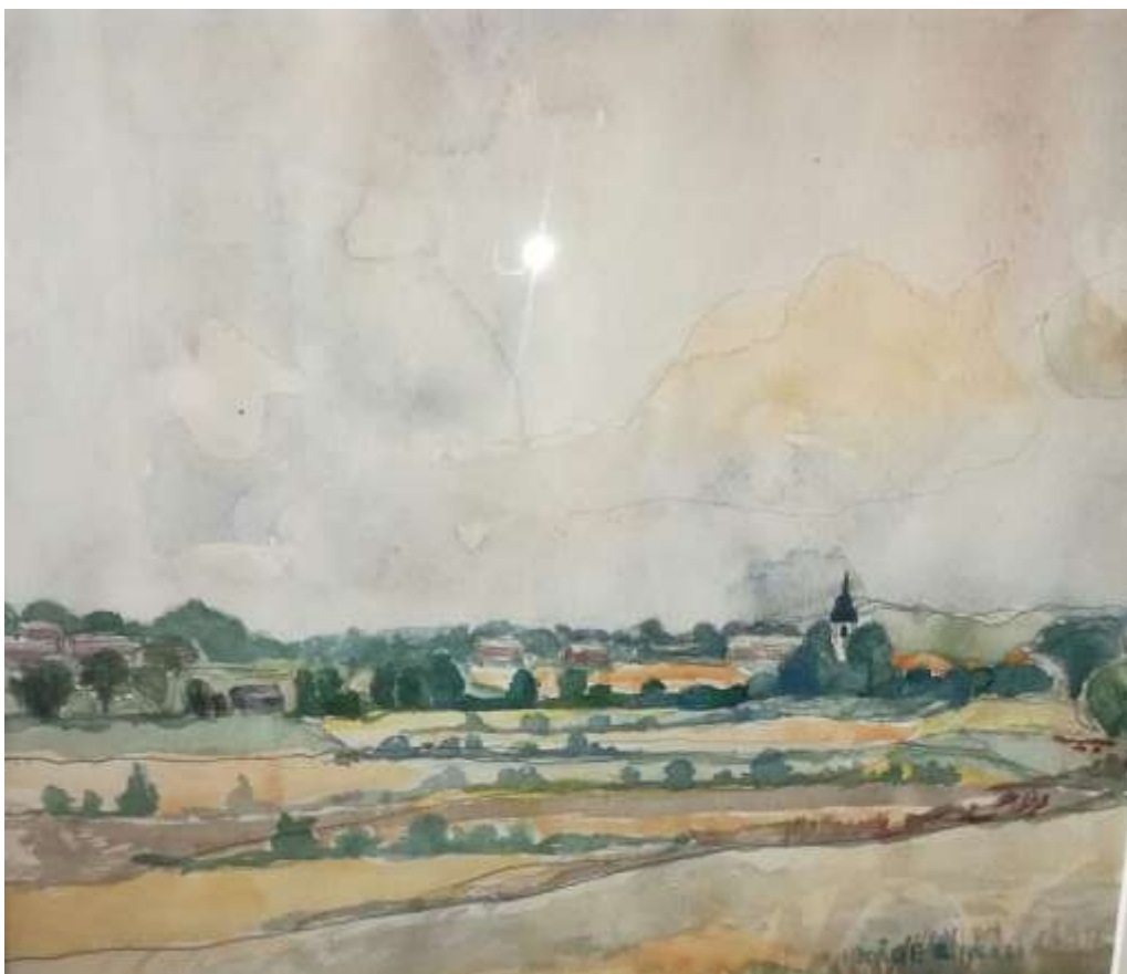
Kåge Bergman, Ängar och åkrar , akvarell 1969, 23 x 28 cm.