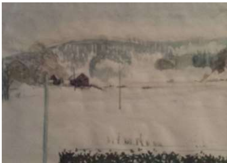
Kåge Bergman, akvarell 1951, 23 x 32 cm.