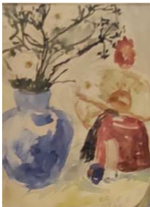
Kåge Bergman, akvarell 1944.