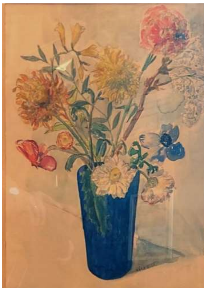
Kåge Bergman, akvarell 1952, 48 x 34 cm. (reflexer i glaset)