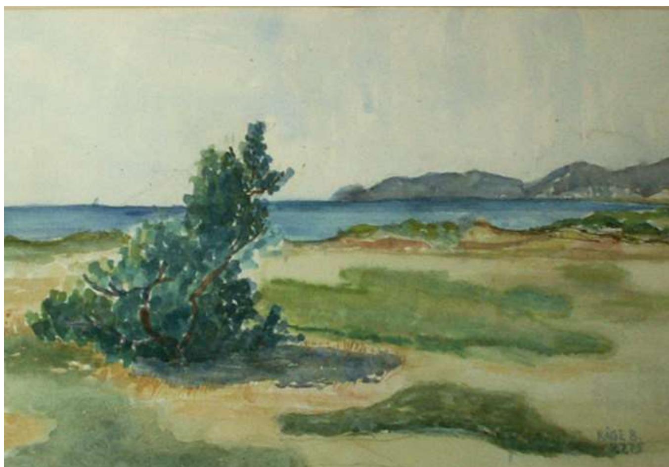
Kåge Bergman, Från Strandbaden, Skåne , akvarell 1975, 36 x 54 cm. Sala Konstförenings samlingar nr 84