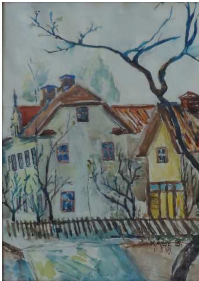
Kåge Bergman, akvarell 11 maj 1949, 44 x 30 cm.