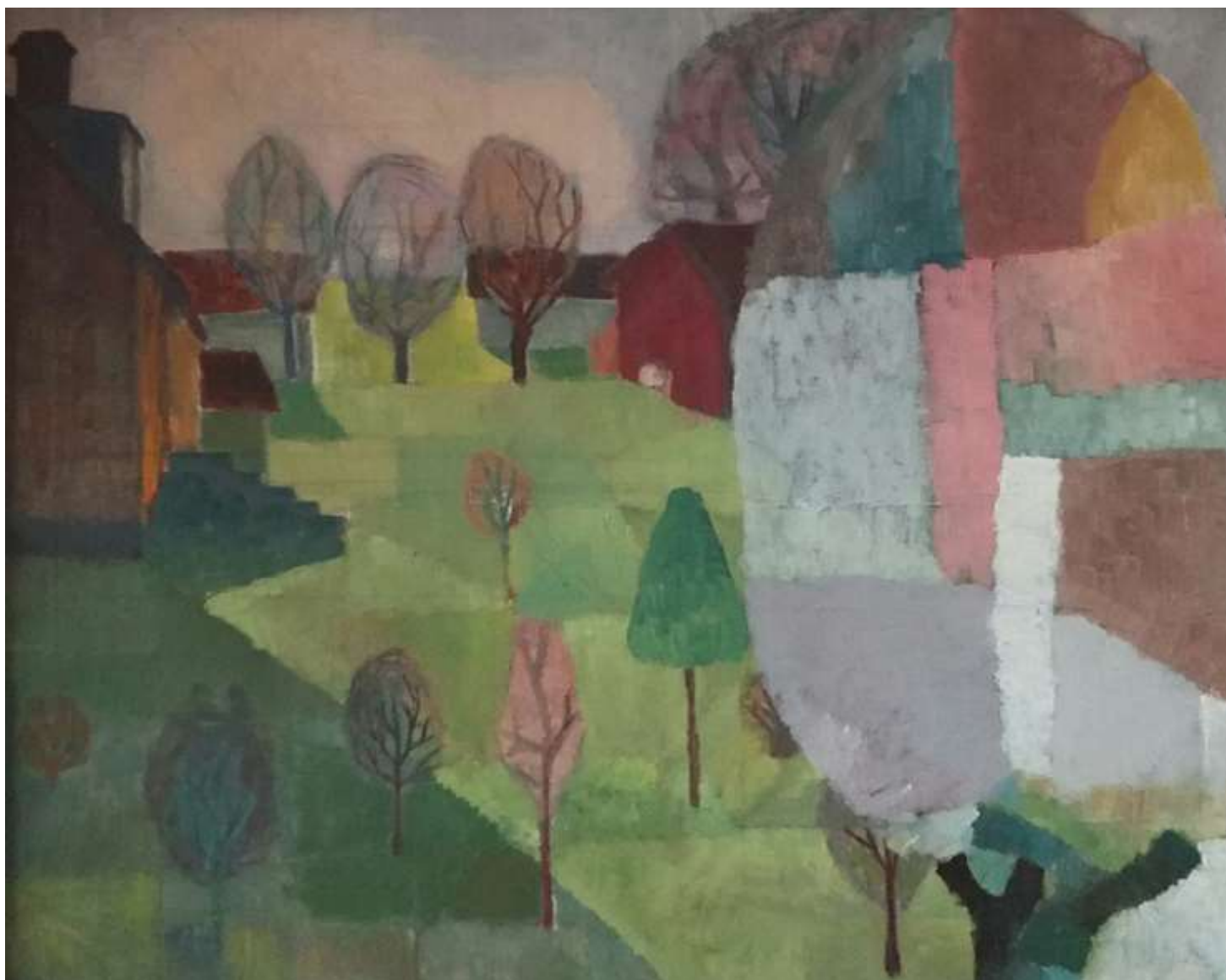
Kåge Bergman, Utsikt mot trädgården , olja 64 x 81 cm.