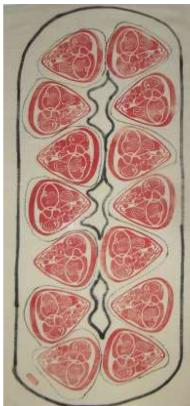
68 x 32 cm