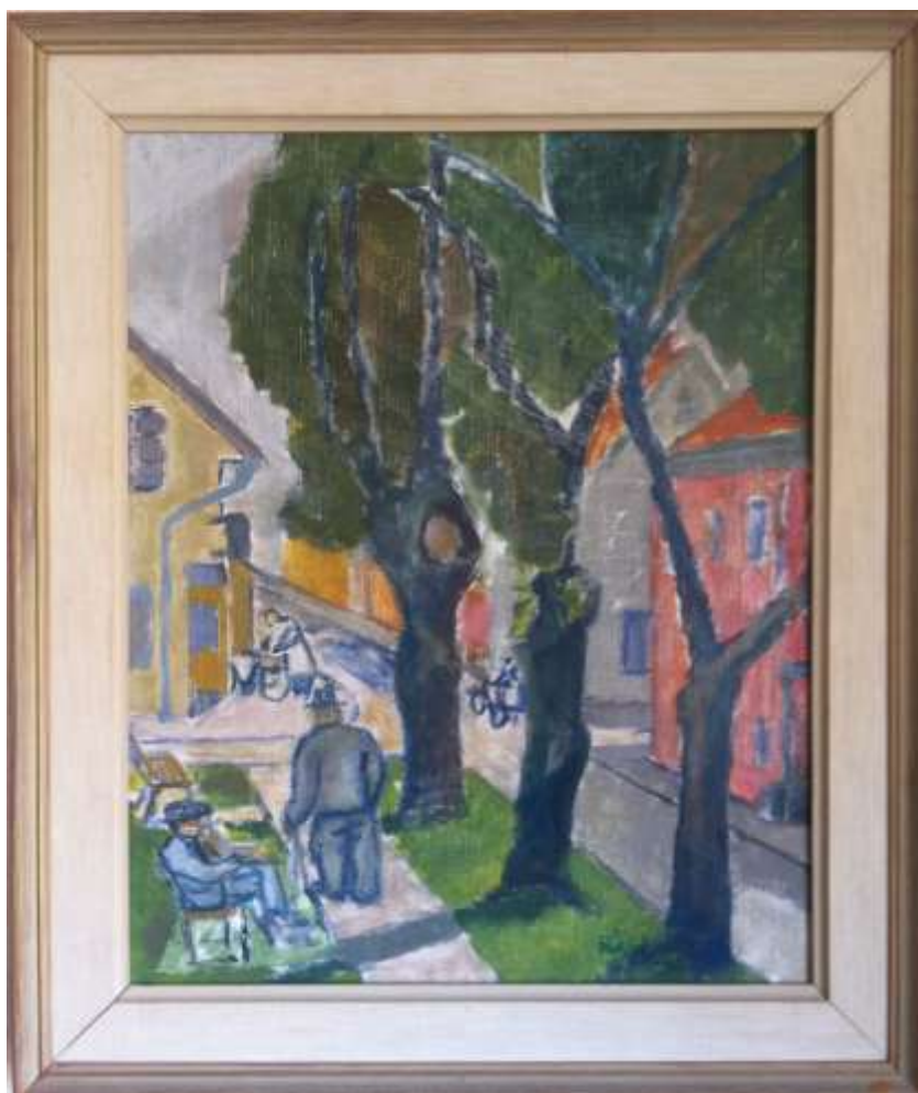
Kåge Bergman, Kungsgatan - Hyttgatan , olja 40 x 32 cm.