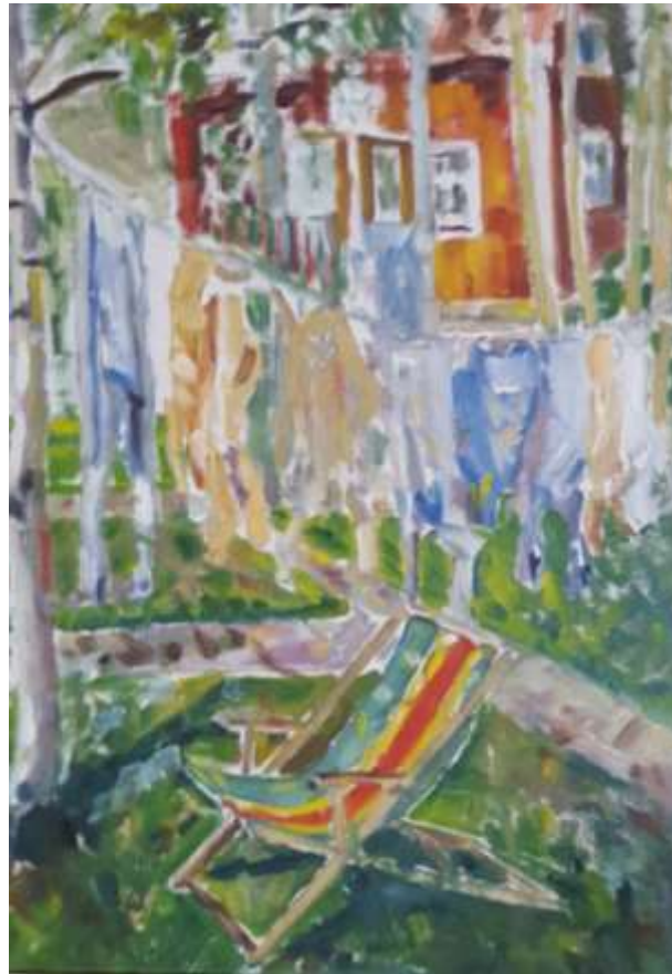
Kåge Bergman, Tvätten Björkelid , olja 48 x 33 cm.

Paradhanduk, duk och bonad av Kåge, linoleumtryck på tyg: