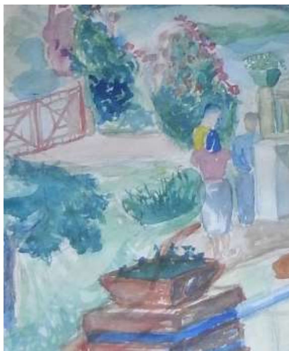
Kåge Bergman, Trädgårdsmotiv , akvarell 1952, 18 x 14 cm.