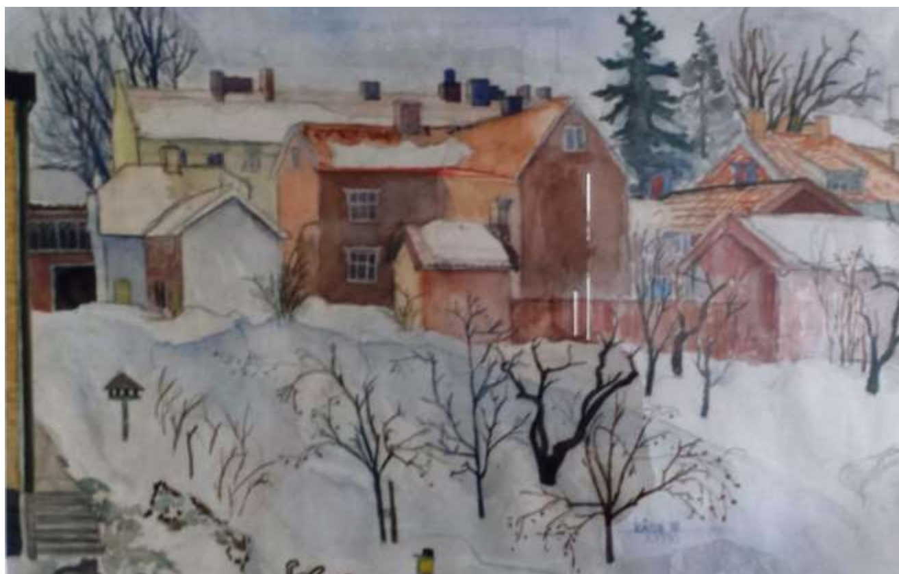
Kåge Bergman, Bellanderska gården vinter , akvarell 1970, 35 x 55 cm. (reflexer i glaset)