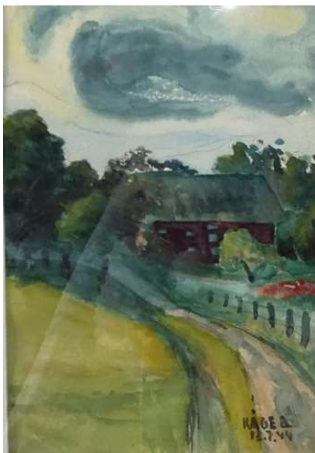
Kåge Bergman, Gammalt magasin, Lunda gård, Vingåker , akvarell 13 juli 1944, 22 x 15 cm.