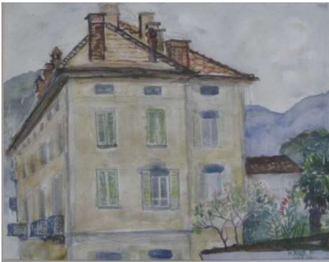
Kåge Bergman 1972, Hus i Schweiz , akvarell 1972, 23 x 29 cm.