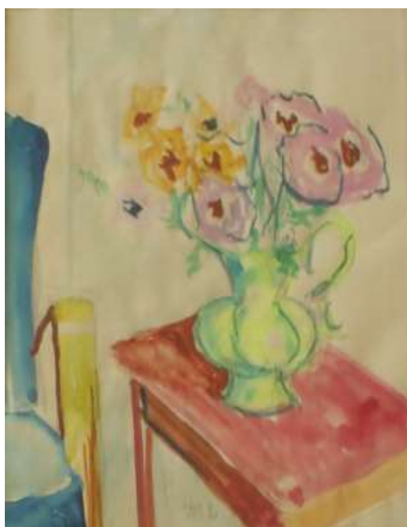
Kåge Bergman, akvarell, 27 x 21 cm