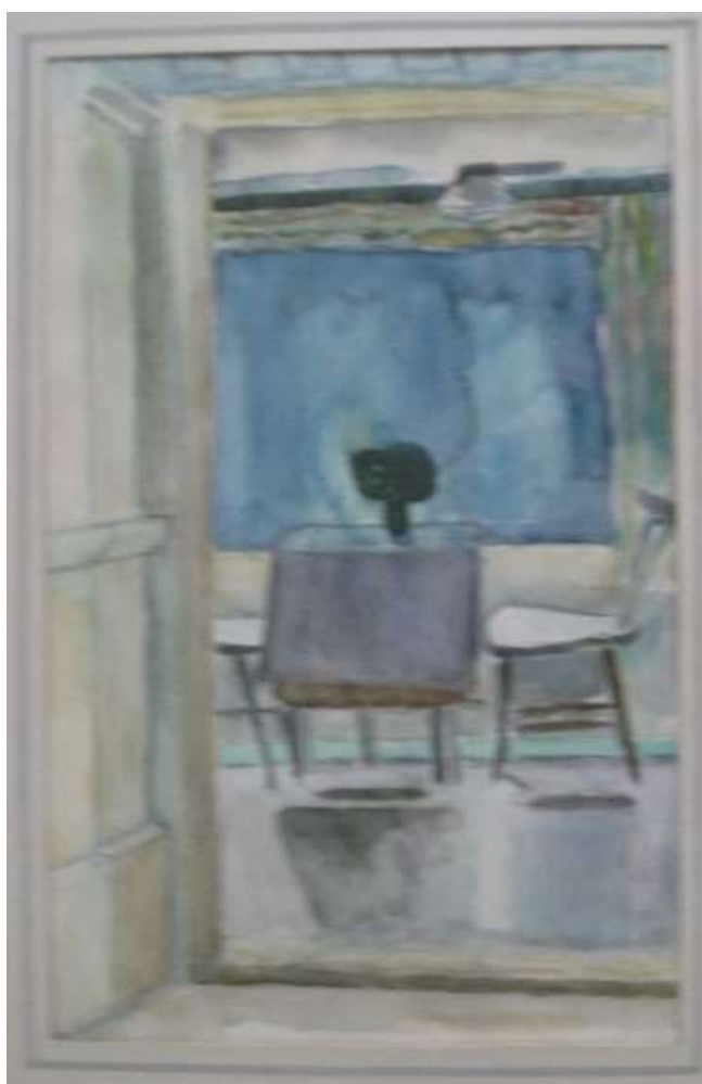
Kåge Bergman, Köket, Vingåker , akvarell 1957, 40 x 25 cm.