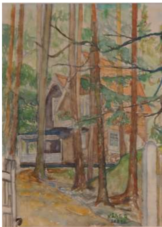
Kåge Bergman, Palmska villan , akvarell 26 augusti 1950, 33 x 23 cm.