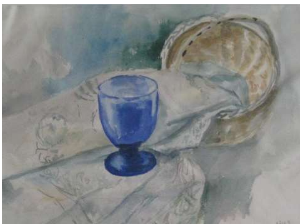
Kåge Bergman, Blått glas , akvarell 1947, 26 x 36 cm.