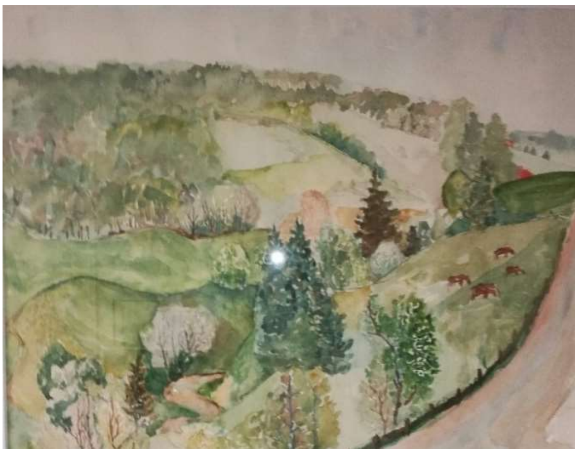
Kåge Bergman, Blommande gröna dalar , akvarell 1973, 31 x 40 cm.