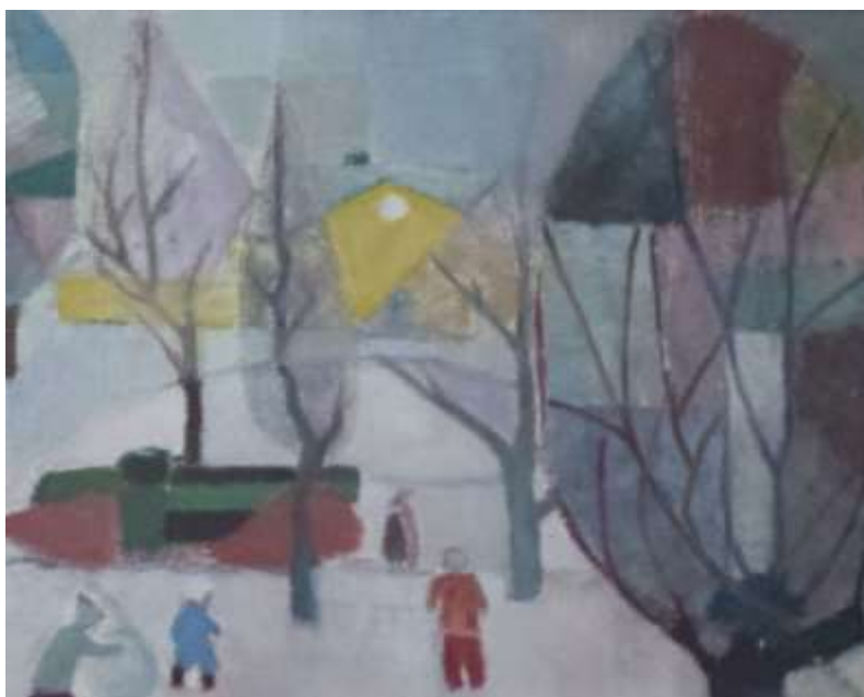
Kåge Bergman, Utsikt från Bergmästaregatan 4 (ca 1955), olja 41 x 32 cm.