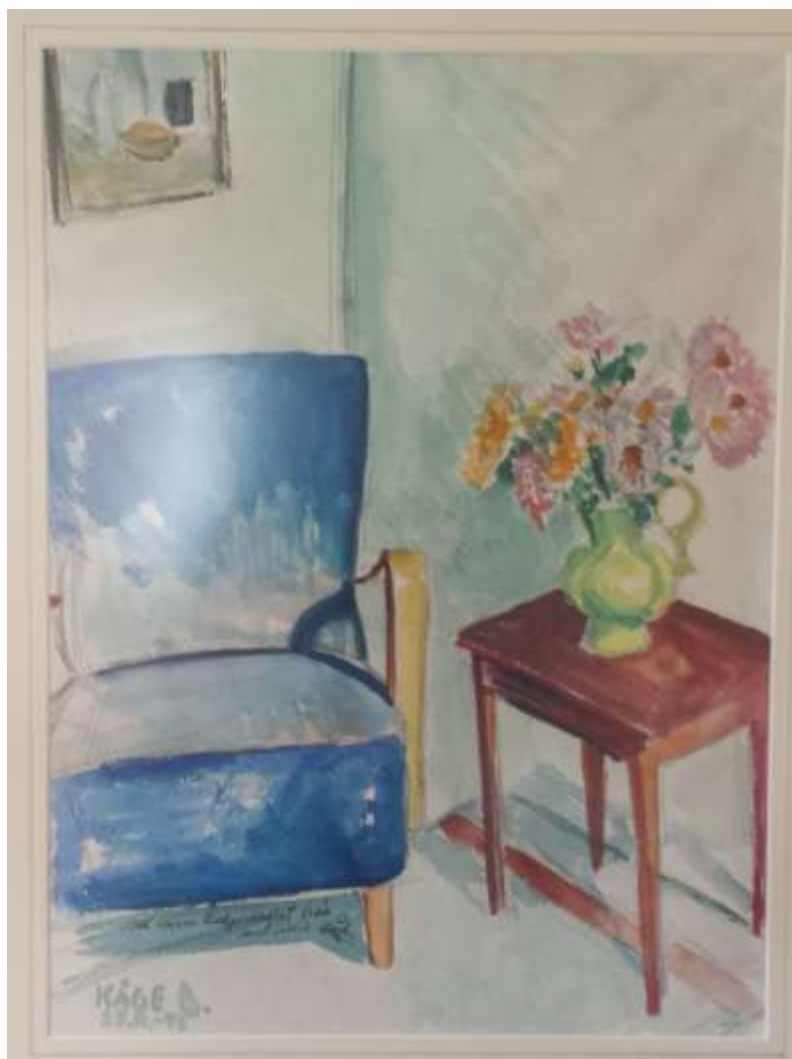
Kåge Bergman, akvarell, 46 x 35 cm