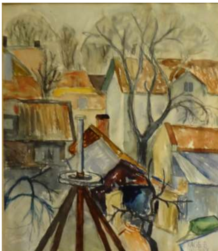
Kåge Bergman, Utsikt över hustaken , akvarell 10 maj 1957, 31 x 28 cm.