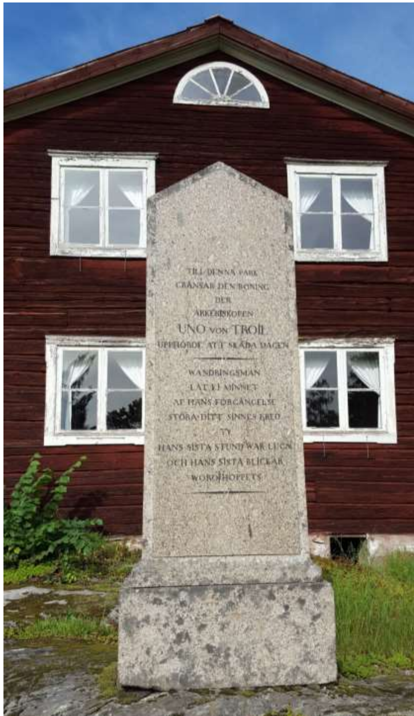
Minnessten för Uno von Troil på Sätra Brunn med texten "Till denna park gränsar den boning der ärkebiskopen Uno von Troil upphörde att skåda dagen. Wandringsman låt ej minnet af hans förgängelse störa ditt sinnes fred, ty hans sista stund war lugn och hans sista blickar woro hoppets"