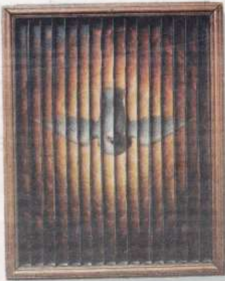
Trefaldighetsmålningen visar olika motiv beroende från vilken vinkel man tittar på den - Fadern, Sonen och den heliga Anden.