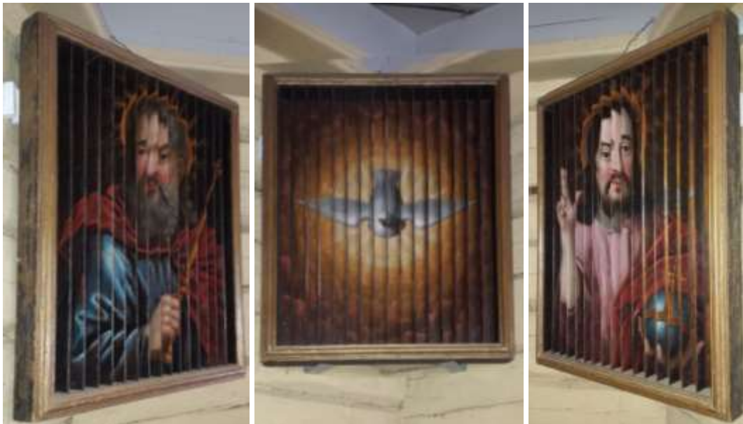
Den märkliga treenighetstavlan som skiftar motiv beroende på hur den betraktas.