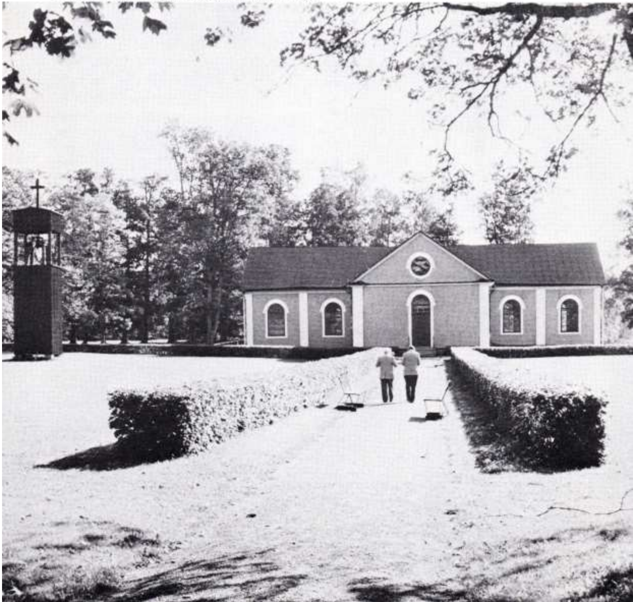
Kyrkan invigdes 1867. T v klockstapeln från 1952.

Eftersom kyrkobesökarna uteslutande är vuxna människor, finns här ingen dopfont. Vid eventuella dop får man gå till Kila kyrka, som är närmast och till vilken Sätrabrunn i pastorathänseende hör.