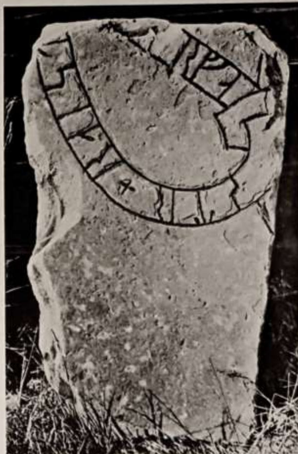
Vs 30. Forneby, Möklinta sn. Nu på Gammelgården