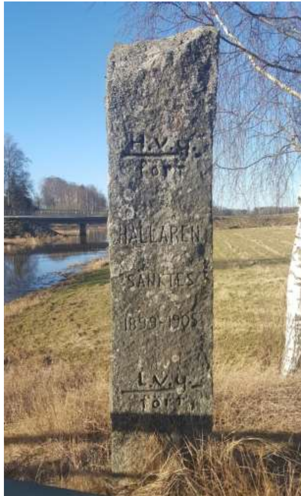
Minnessten vid Sundsbron efter vägen mellan Sala och Möklinta via Saladamm. Text: