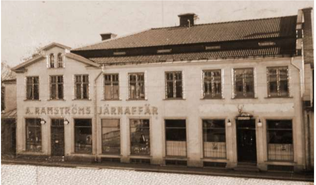
Apoteket på Rådhusgatan efter branden.