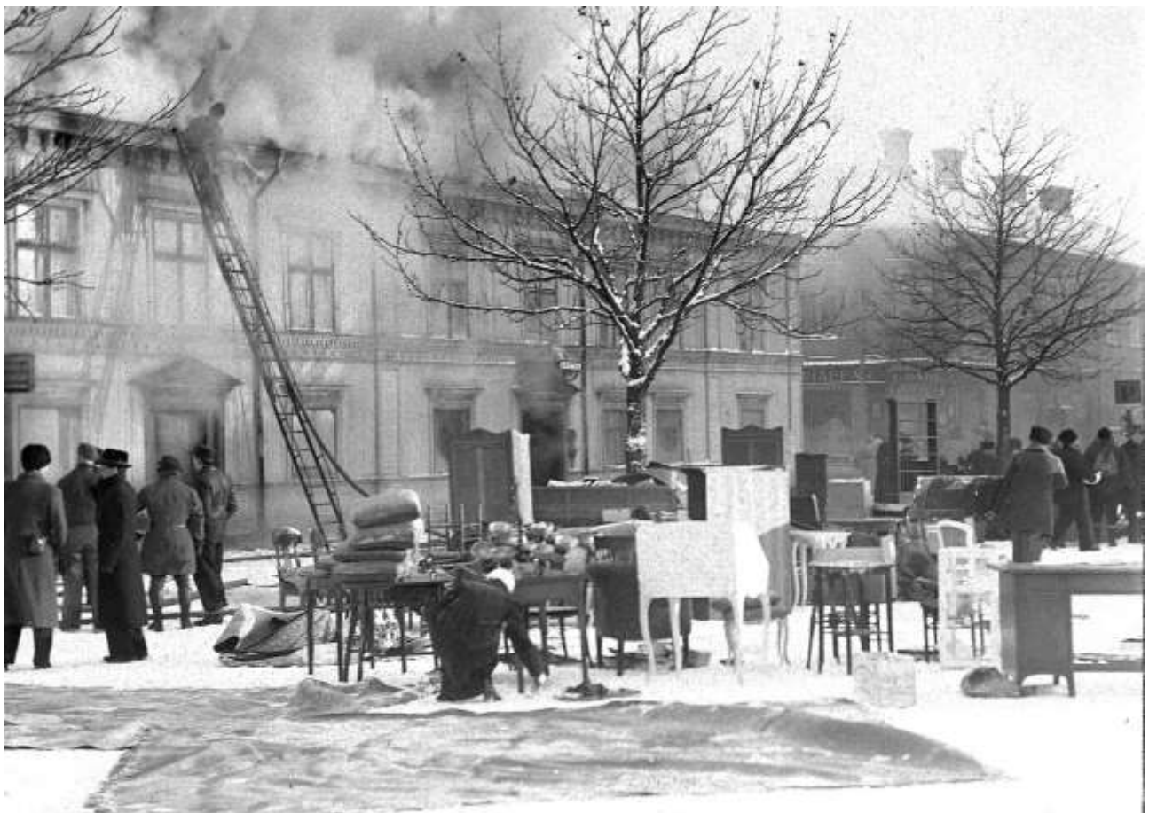
Apoteksbranden 1940, foto Sven Norling