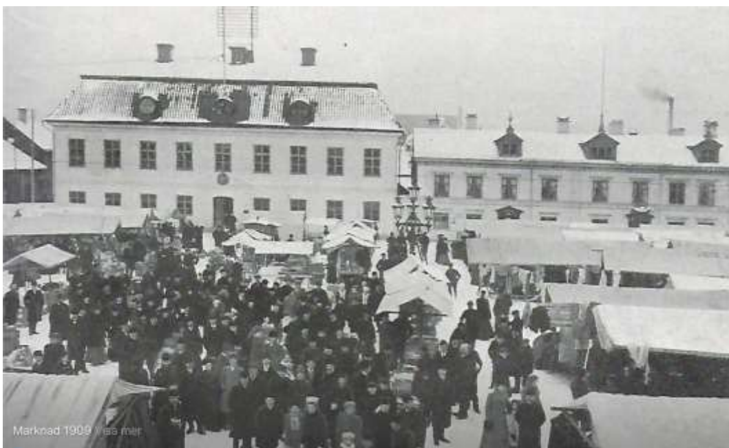
Marknad 1909.