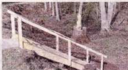
En trappa ner från dammvallen har kommit på plats.

– Det blir bänkar av enkla slag, och med olika teman, som kommer placeras nedanför dammvallen.