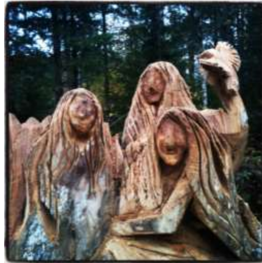
Före och efter. Skulptur2012.