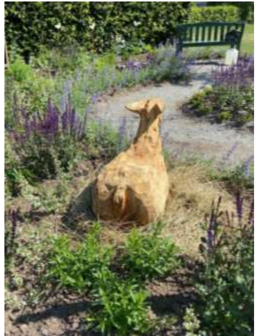
"Tacka", i idéträdgården vid Åpromenaden i Enköping. Jag gjorde också några ugglor till Skolparken, men jag vet inte om de finns kvar.