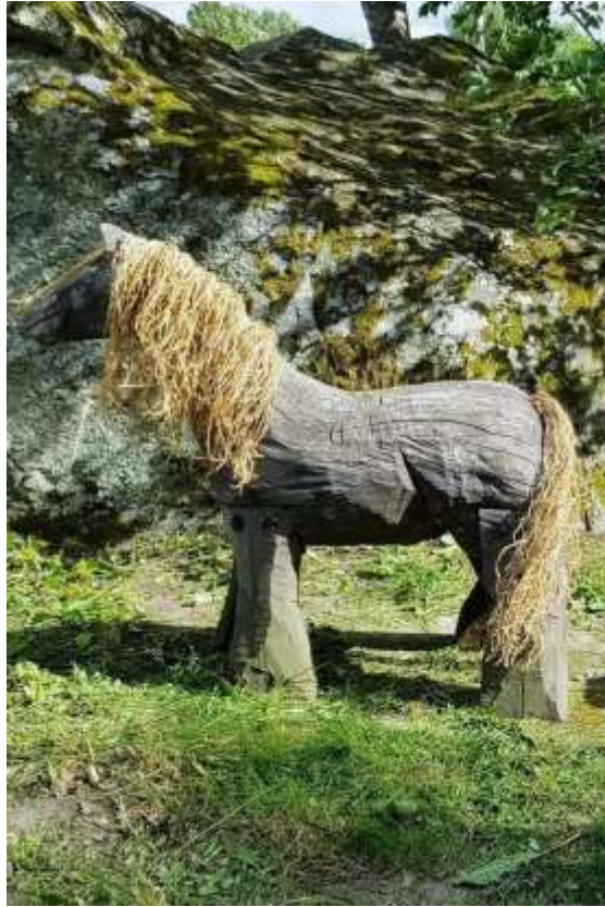
"Fjalar", vid Gammelgården i Fläckebo. Sommaren 2020 utlystes en tävling som gick ut på att namnge hästen. Det förslag som fick flest röster var "Fjalar". Manen är gjord av sisalgarn.