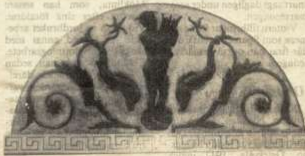
Väggdekoren är en del av byggnadens finesser.

I samband med byggnadsminnesförklaringen meddelade också länsstyrelsen vilka skyddsföreskrifter som skall gälla. Byggnaden med tillhörande flygelbyggnader och angränsande mur längs solgården får inte rivas, byggas om eller förändras till sitt yttre. Vidare säger länsstyrelsen att interiören i före detta simhal-