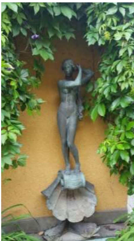
Carl Elmberg, Badande flicka , bronsskulptur