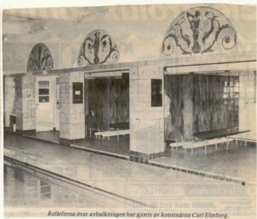
Relieferna över avbalkningen har gjorts av konstnären Carl Elmberg.