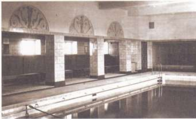
Gamla varmbadhuset, nu Blå Salen.