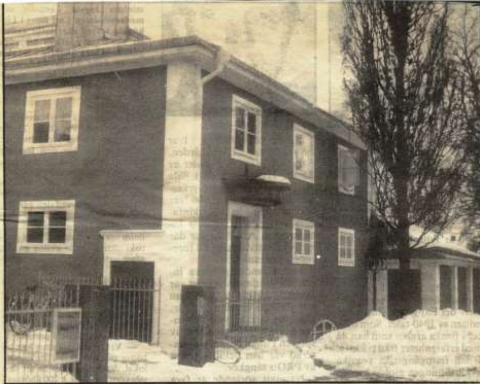
Gamla varmbadhuset får i och med byggnadsminnesförklaringen inte rivas eller genomgå några förändringar. SA 17/388