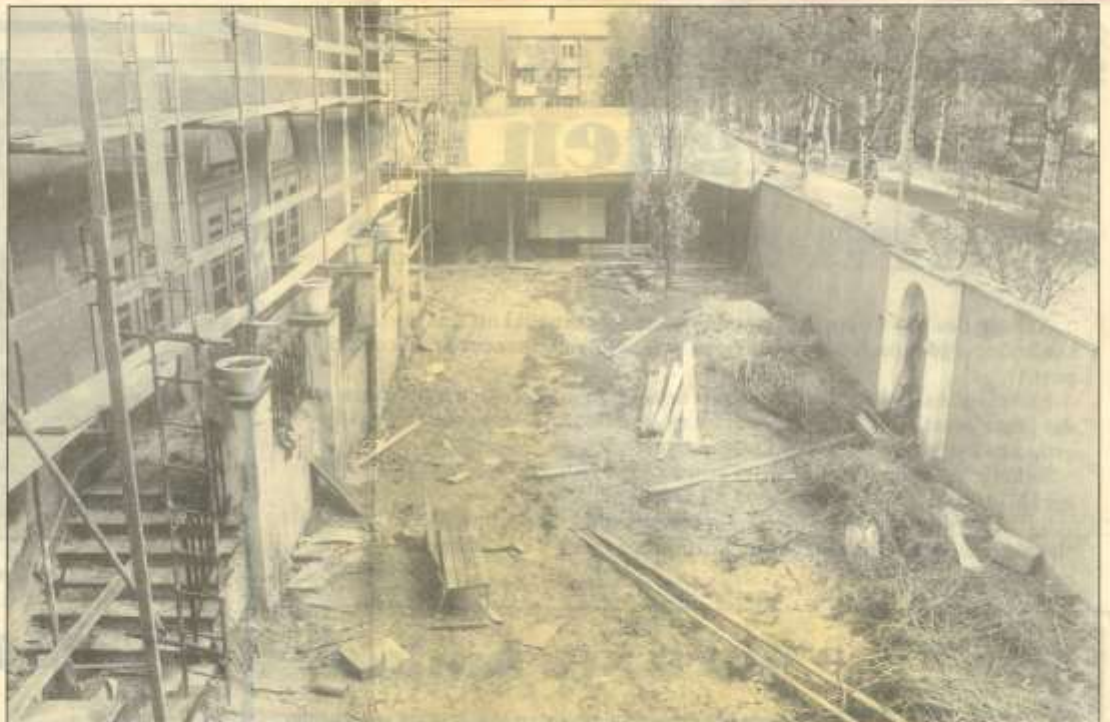
Galler för fönstren ut mot gården är en förutsättning för att dyrbara utställningar skall kunna visas på Aguéli-museet.

Allt det här är under arbete, och några detaljer vill styrelsen inte lämna ut ännu.