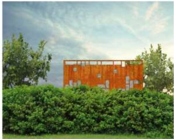
Lyktans sedd från gravkvarteret norr om lunden.