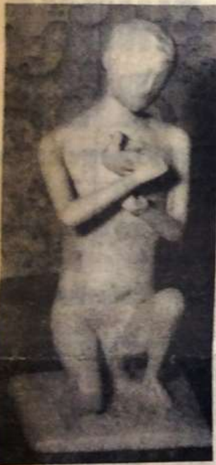
Den här ynglingafiguren skall kröna fontänen. Han försöker hålla kvar en liten fågel och gruppen symboliserar livets flyktighet.