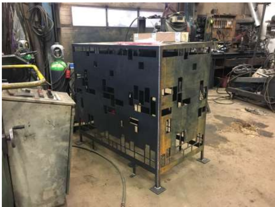
Under tillverkning.