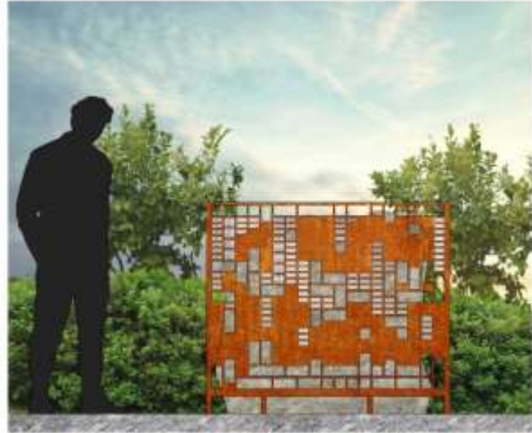
Lyktan sedd framifrån. 30 % av skyltarna fastsatta.

Namnplatsen vid askgravlunden utgörs av ett raster av cortenstål som omsluter ett dolomitblock, från den närbelägna gruvan i Sala. Rastret har utfrästa partier som dolomitblocket skymtas genom och blocket är även belyst. Kvällstid gör belysningen så att namnplatsen glimmar likt en ljuslykta i mörkret.