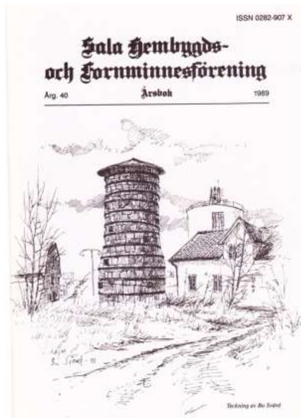
Omslaget till Sala Hembygds- och Fornminnesförenings årsbok 1989. Teckning Bo Svärd.