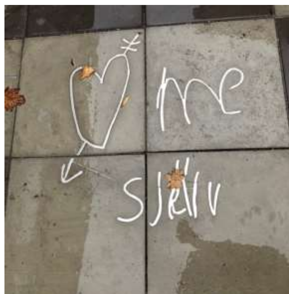
Eleverna på Vallaskolan har bidragit med teckningar och text till konstverken.