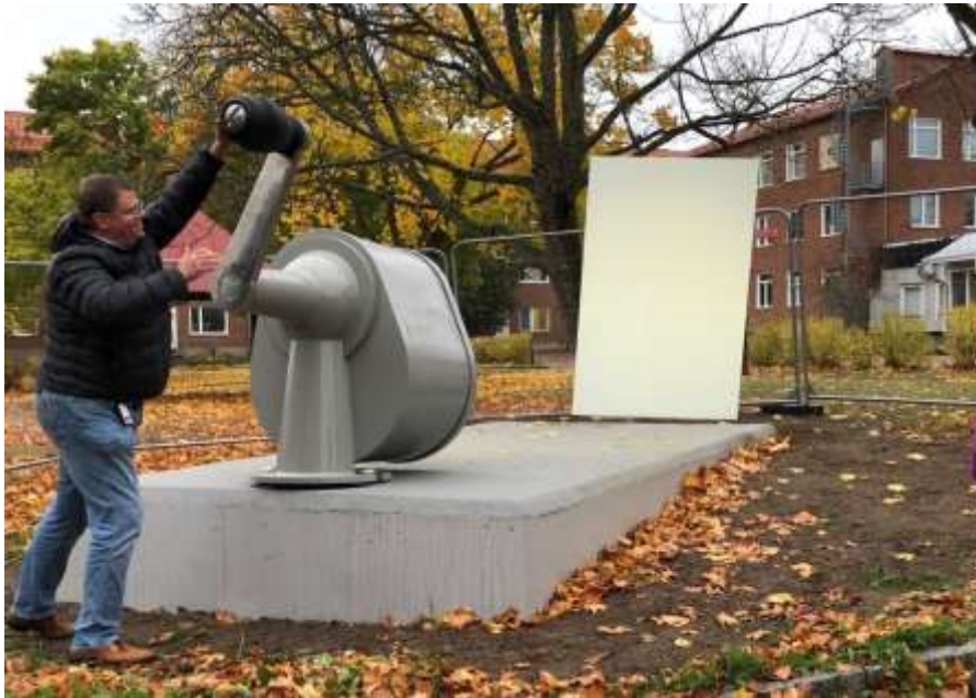
Den stora pennvässaren lyser upp den vita ytan i mörkret.