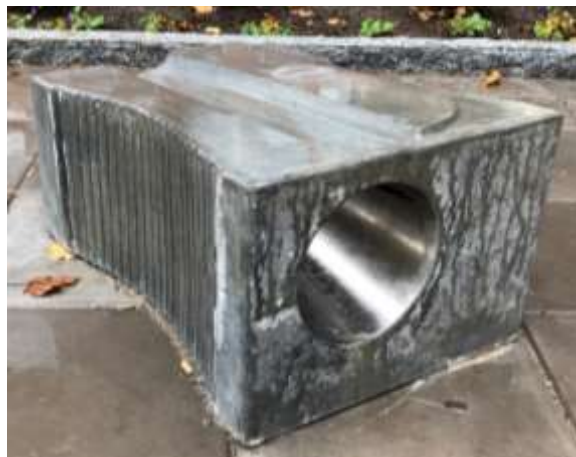
Det finns flera pennvässare på skolgården.